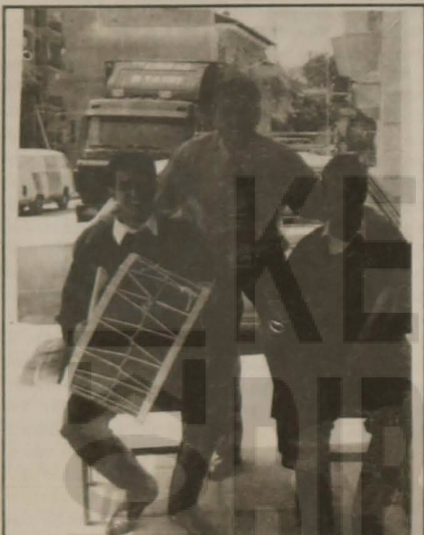
Οι νέοι μας και σήμερα είναι άξιοι λειτούργοι της ποντιακής μούσας.

Του Γιώργου Χ.Χιονίδη "νηστική αρκούδα δεν χορεύει...", ούτε καν είναι ικανή να περιηγηθεί, απολαμβάνοντας κόρτο... Εκεί μας περίμεναν οι ελληνοπόντιοι κάτοικοι του χωριού, που είναι πολύ μεγάλο (μέχρι 1200 σπίτια). Εδώ το ελληνικό κράτος έκτισε μια από τις 9 εκκλησίες που αναγέρθηκαν με έξοδό του. Μπρόδα του, για να το παινέψω και λίγο. Μας περίμενε και ο ιερέας του χωριού (με τον οποίο συλλειτουργηθήκαμε στη Σουμελιά, όπως προσημείωσα).