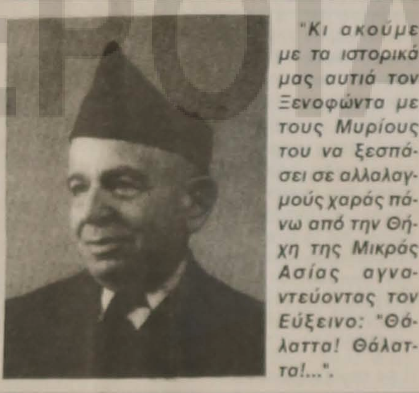
"Κι ακούμε με τα ιστορικά μας αυτιά τον Ξενοφώντα με τους Μυρίους του να ξεσπάσει σε αλλαγμούς χαράς πάνω από την Θήχη της Μικράς Ασίας αγναντεύοντας τον Εύξεινο: "Θάλαττα! Θάλαττα!..."

Δηλαδή: Εγώ είμαι που τραγουδούσα επτά νύχτες και μέρες στις Δεσποινούλας τη χαρά, της Κωνσταντή το γάμο. Αυτή είναι η ψυχή των οργανοποιών μας. Είναι αυτοί που εκφράζουν και διαλαλούν τις χαρές και τους καημούς. Ας είναι καλά!