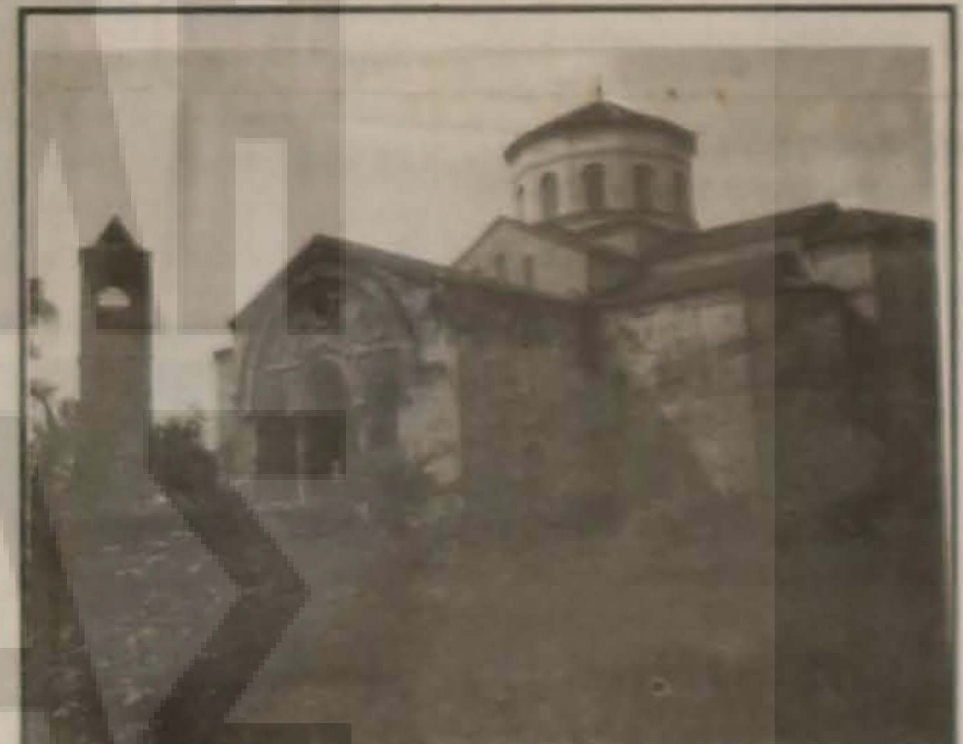
Σύμβολα της πίστης μας. Η Μονή Αγίας Τριάδος Τραπεζούντας. Κτισμένη το 1238 - 63 από το Μανουήλ Α' το Μέγα Κομνηνό. Είναι φημισμένη για τις θαυμάσιες τοιχογραφίες της.