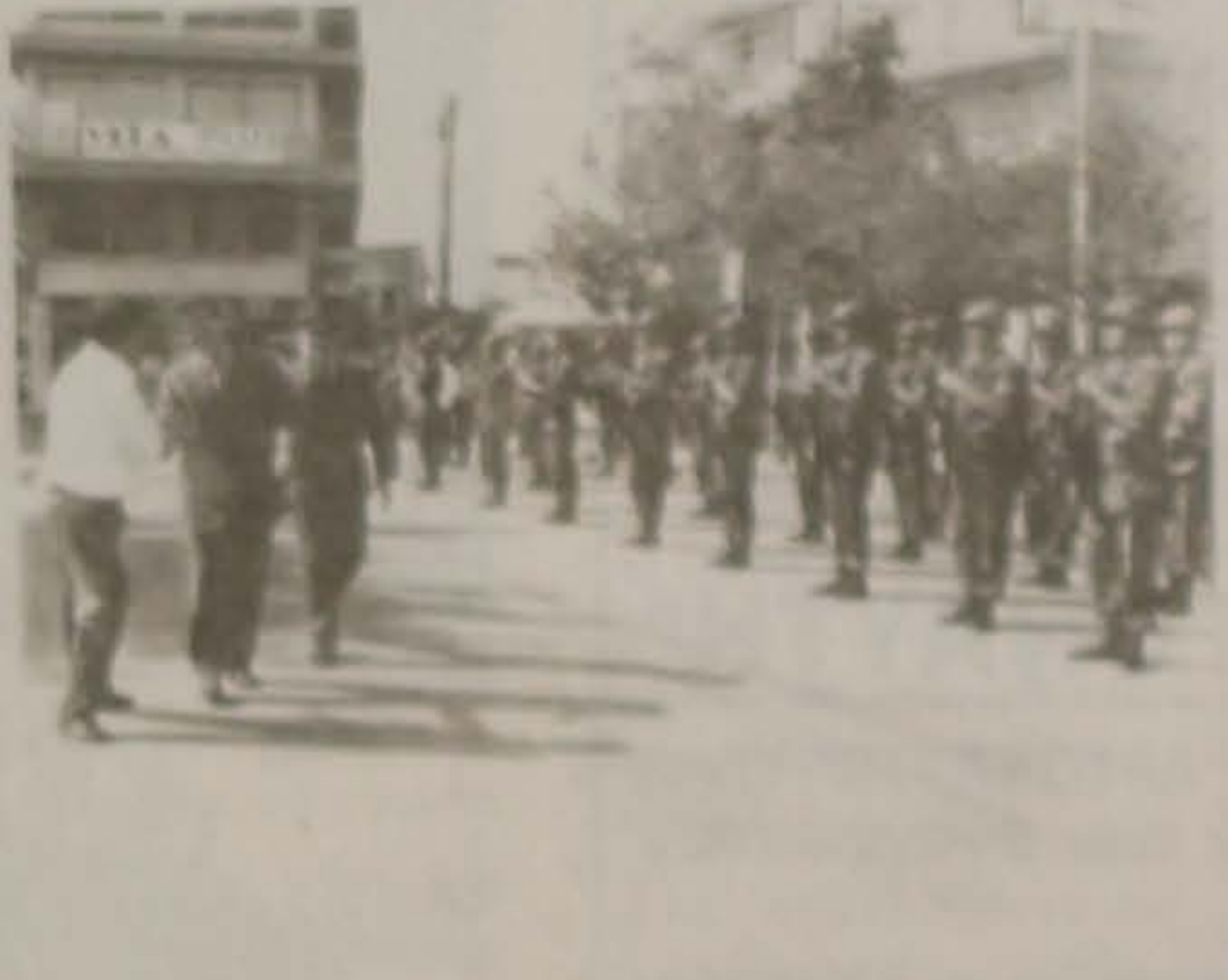
Ο υφυπουργός κ. Μ. Χρυσόχοϊδης