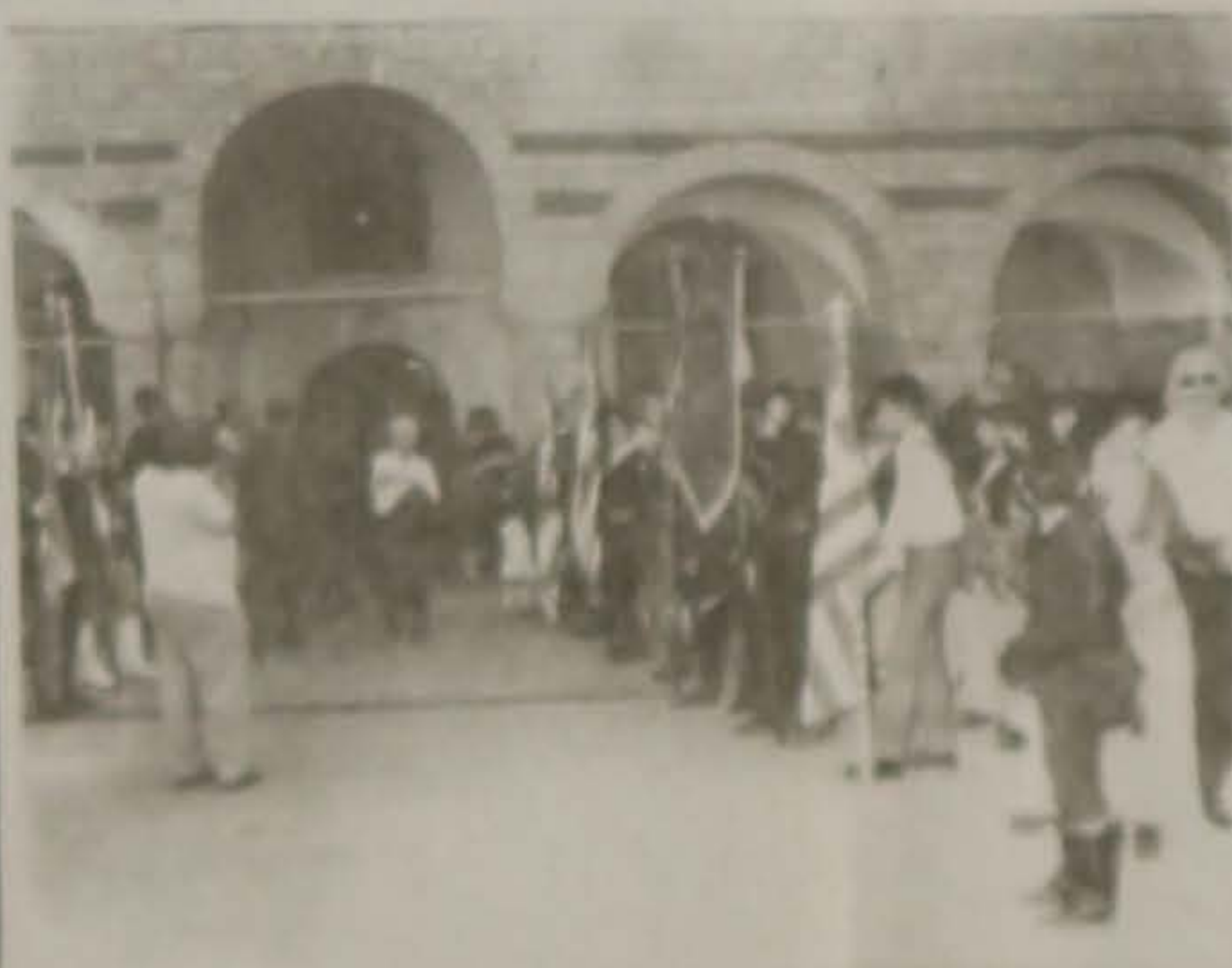
Μπροστά στο ναό