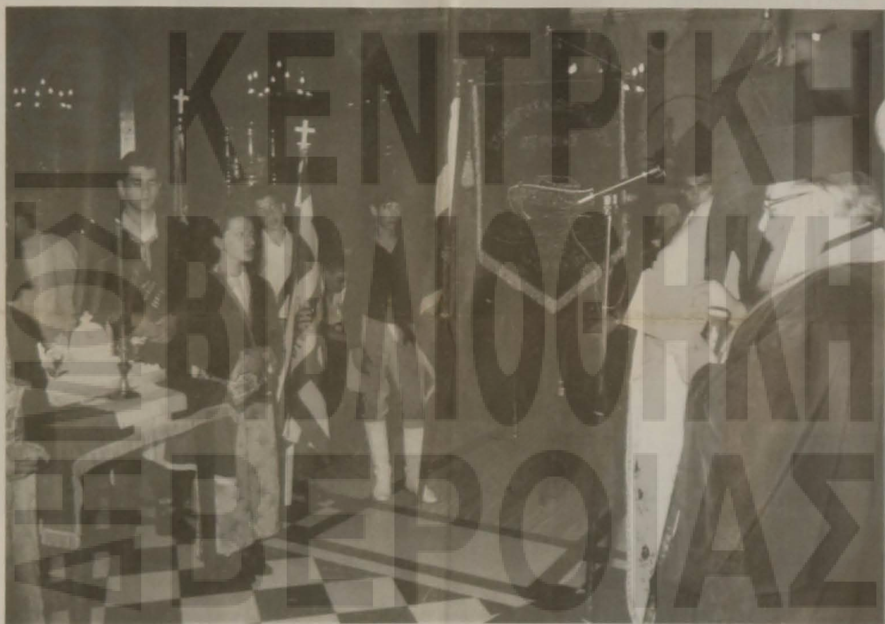
Κατά την επιμνημόσυνη δέηση.

Οι τρόποι οι μέθοδοι και τα μέσα που χρησιμοποιήσαν οι τουρκικές κυβερνήσεις για να εξοντώσουν τον ποντιακό ελληνισμό, είναι ανίστευτα. Επιστράτευση και εξόντωση των νέων. Τάγματα εργασίας - Τάγματα θανάτου - Στρατόπεδα συγκέντρωσης και εξόντωσης δουλειά 12ωρη και σκληρή κάτω από άβυσσους συνθήκες. Οι στρατεύμενοι και συλλεπθέντες ήταν υποχρεωμένοι να σπάζουν πέτρες, να κόβουν ξυ-