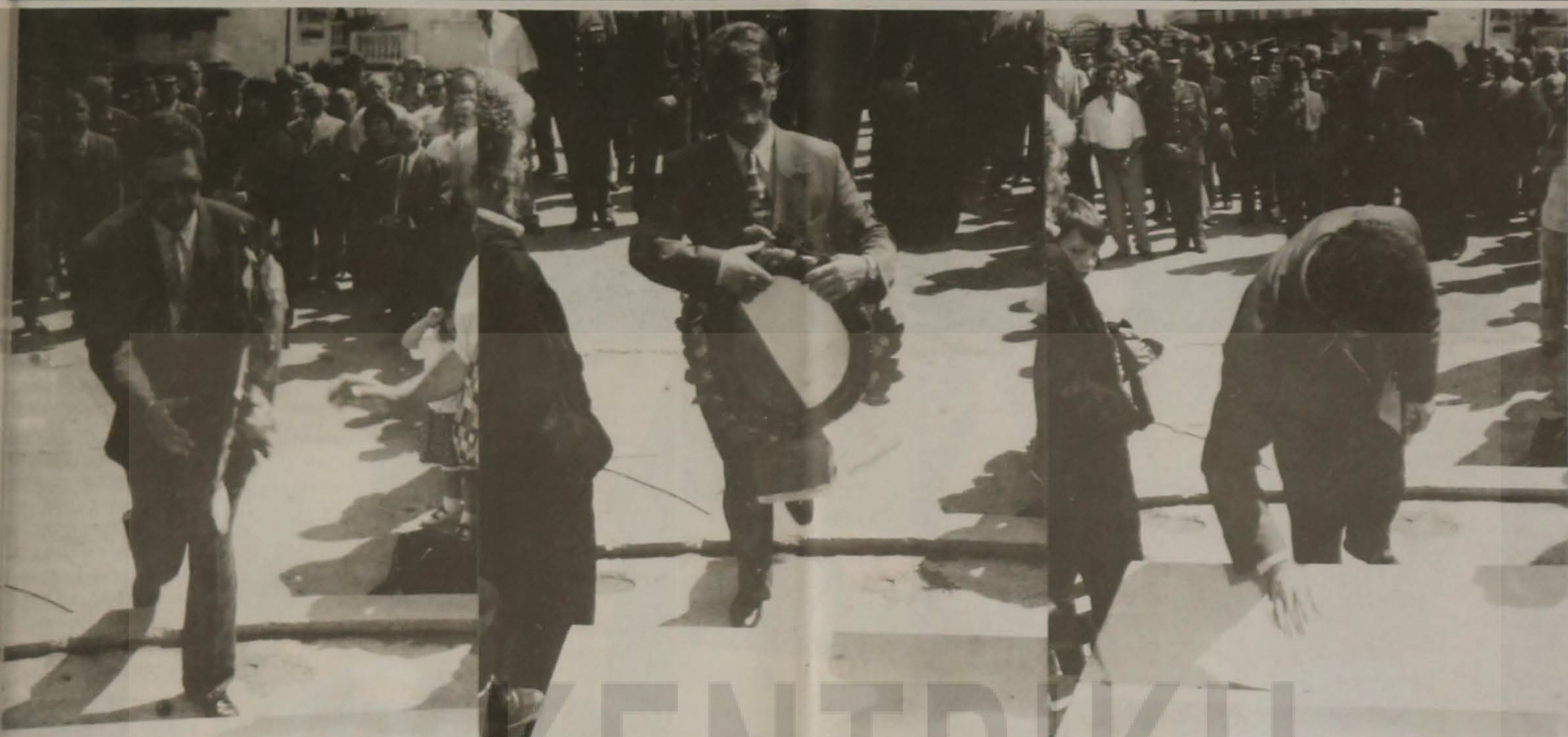
Συνέχεια από τη 2η σελ.