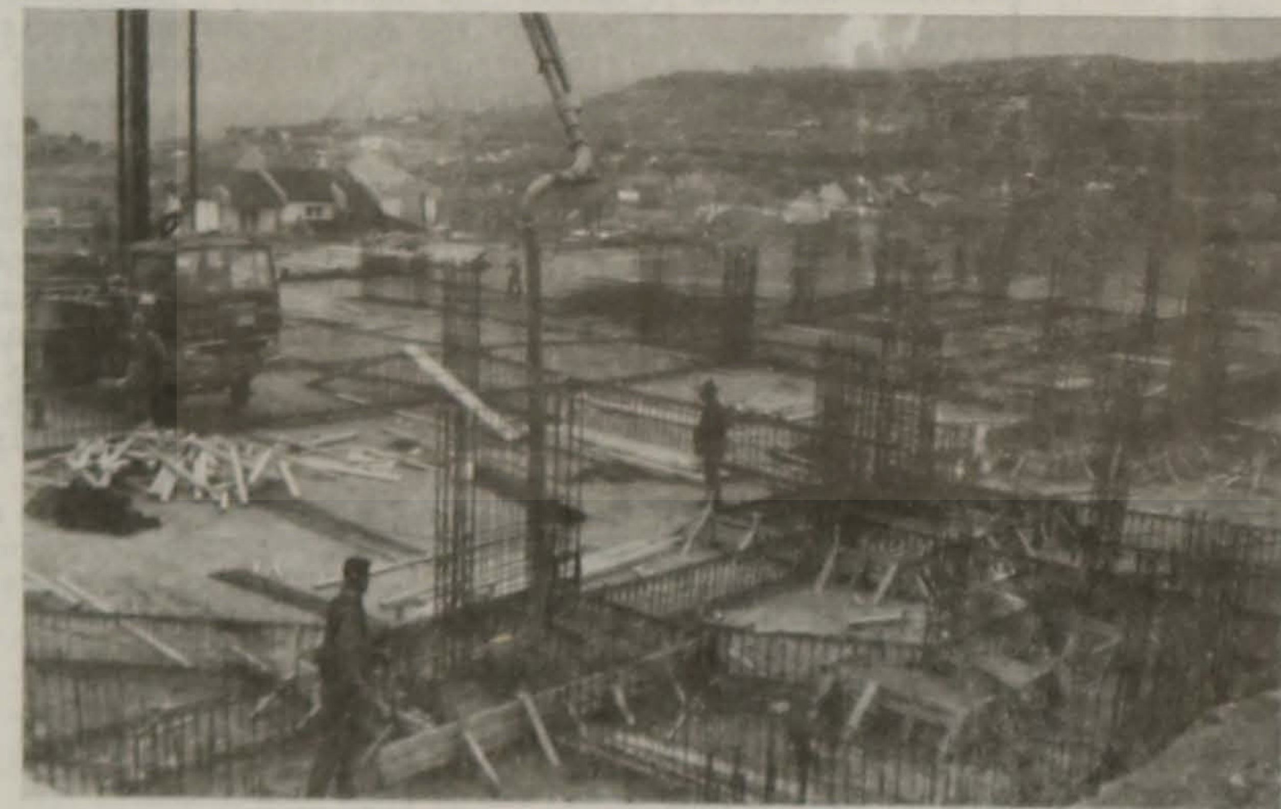
Εικόνες από την έναρξη των εργασιών.

Άρχισαν οι εργασίες του μεγάλου έργου της ανέγερσης του Πολιτιστικού Κέντρου της ΕΛΒ. Είναι ένα έργο που θα αποτελέσει μετά την αποπεράτωσή του την κεντρική συντήρηση - έρευνας της συλλογικής εθνικής μνήμης και έρευνας της ιστορίας και λογογραφίας του ανατολικού Ελληνισμού. Ακόμα θα είναι ένα θησαυροφυλάκιο της πολιτιστικής μας ταυτότητας. Σ' αυτόν τον χώρο θα συντελεστεί η μυσταγωγία της μεταλημπόδευσης της ιστορικής μας μνήμης και παράδοσης στις επερχόμενες γενιές.