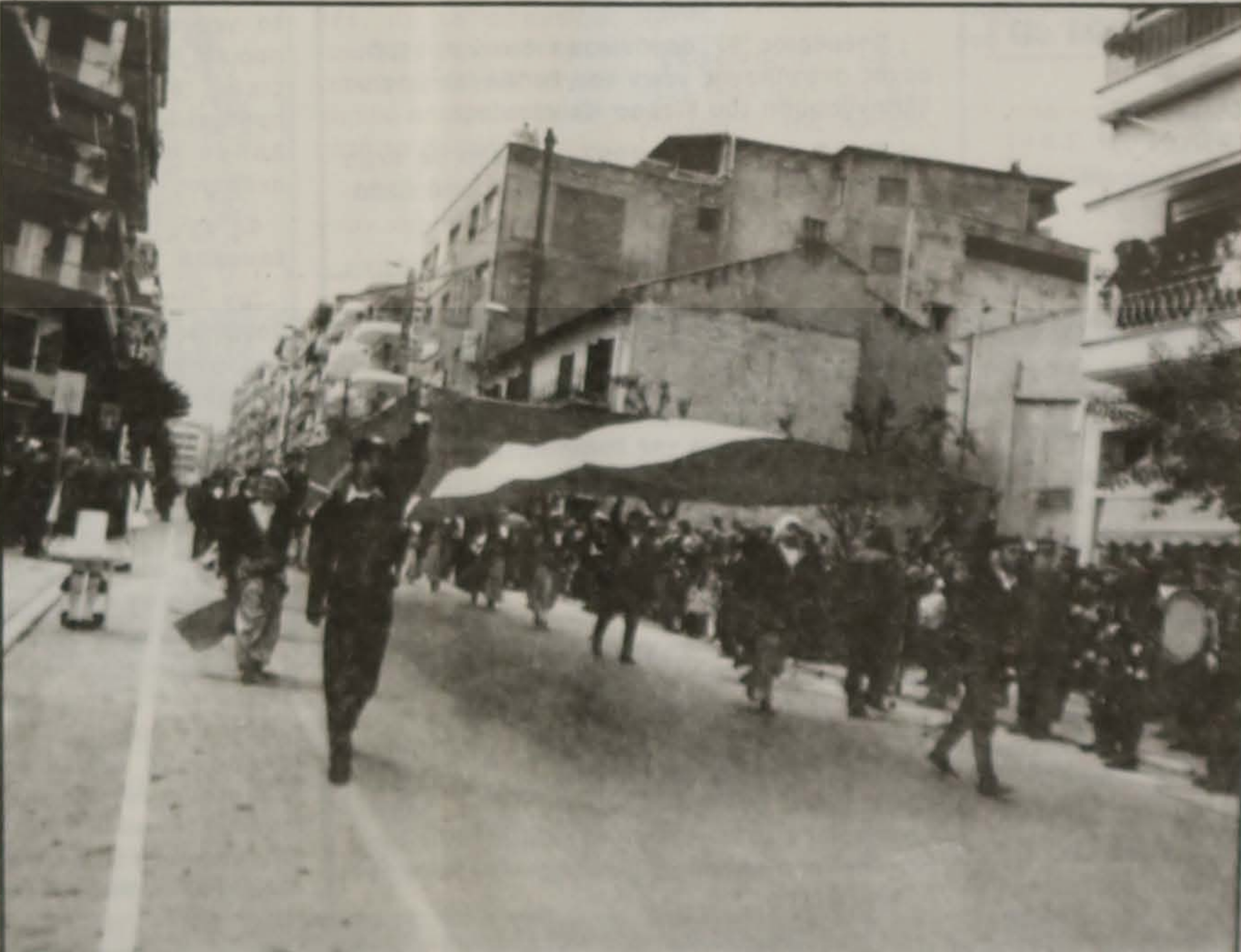
Από την παρέλαση της 25ης Μαρτίου στην πόλη της Βέροιας. Τα κληρονομιά νάτα κρατούν τη γαλανόλευκη.