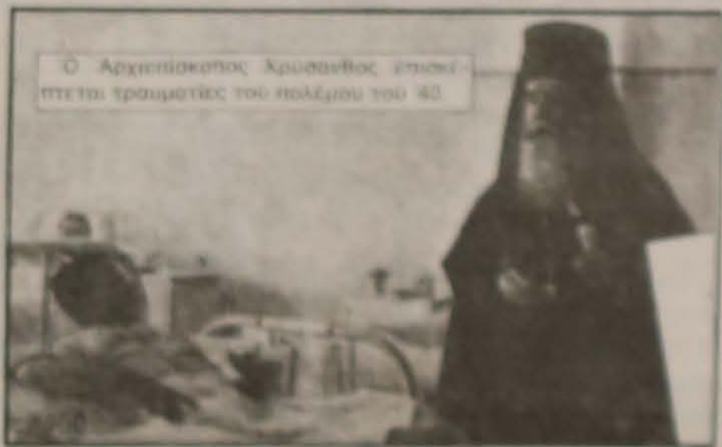
Ο Αρχιεπίσκοπος Χρυσάνθος επισκέπτεται τραυματίες του πολέμου του '40

Ο Χρυσάνθος, ο ηρωικός Αρχιεπίσκοπος, είχε μεταβεί με το μετόπισθεν σε στρατόπεδο προσεχώς. Είχε δύο εντολές να γίνονται κάθε μέρα σε όλους τους ναούς της Αρχιεπισκοπής (Αθηνών και Πειραιώς) παρακλήσεις "υπέρ της ειρήνης του σύμπαντος κόσμου, ενισχύσεως, ευδοξίας, νίκης και κράτους των κατ' Εθρον, αίρα και βασιλείων μακαρίων ελλήνων στρατευμάτων". Και μήλο ο έθνος ήταν παρών στις δεήσεις και τις δεηολογίες, όταν νικούσαν οι στρατός μας. Τότε δεν λησμονούσαν οι καμπάνες λόγω του πολεμικού, αλλά ο ελληνοεθνικός λόγος είναι εδρασημένο από τις εμπειρίες ότι κάθε ημέρα η Παράκληση δοθεί στην Εκκλησία στις 4 η ώρα το απόγευμα. Το αυτό γίνεται σ' ολόκληρη την Ελλάδα. Έτσι, ενώ ο Στρατός μας υπερασπιζόταν με την Αθήνη την Ελευθερία μας, ο έθνος πληθυσμός ευλόγητο γονατώντας στις Εκκλησίες υπέρ της νίκης του θείου, και της ελευθερίας και ειρήνης του σύμπαντος κόσμου.