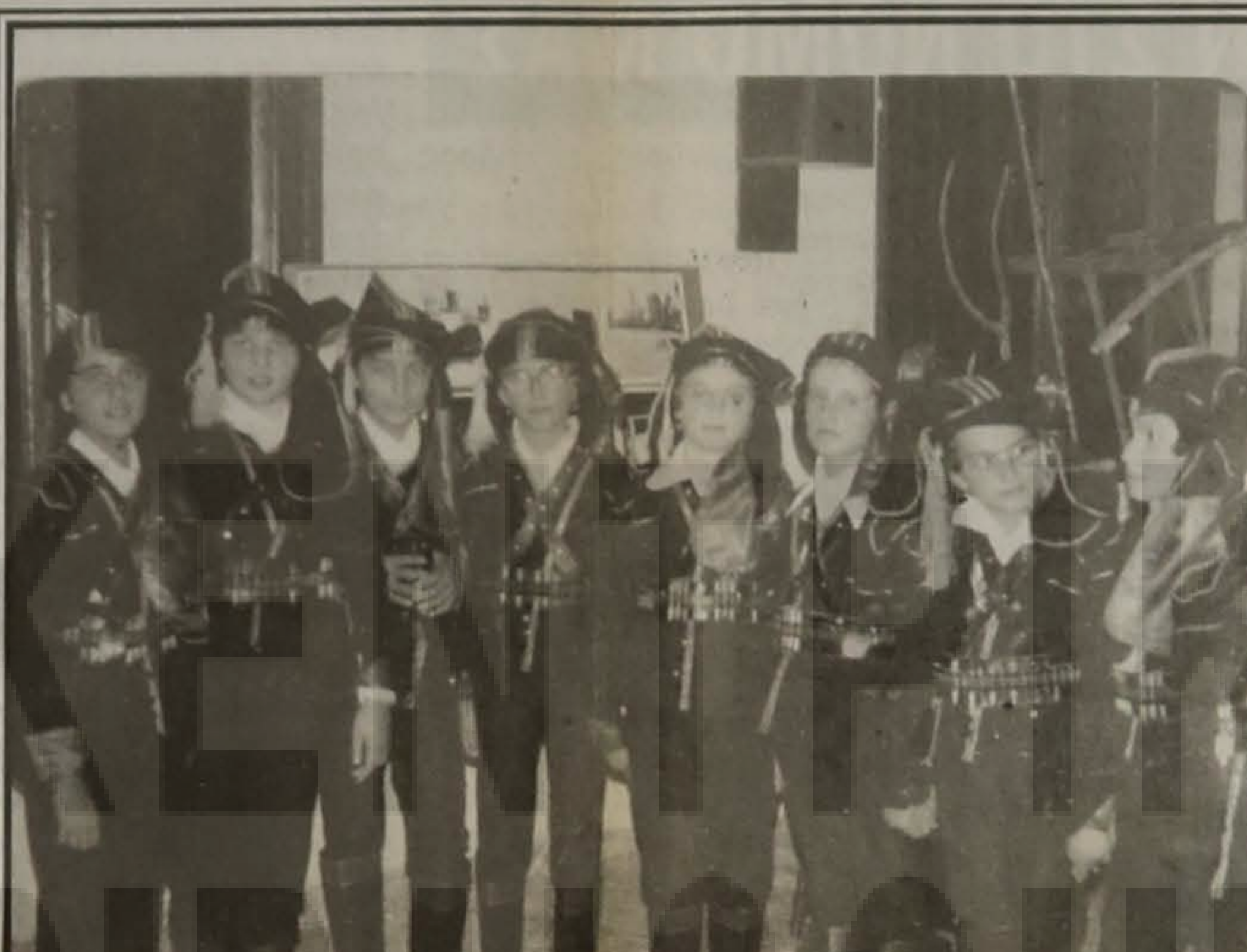
Αρχές της δεκαετίας του 1980. Το υπέροχο τότε χορευτικό συγκρότημα του Μορφωτικού Συλλόγου Λαζοχωρίου Βέροιας. Ήταν τότε όλοι τους παιδιά. Για χάρη τους δημοσιεύεται.