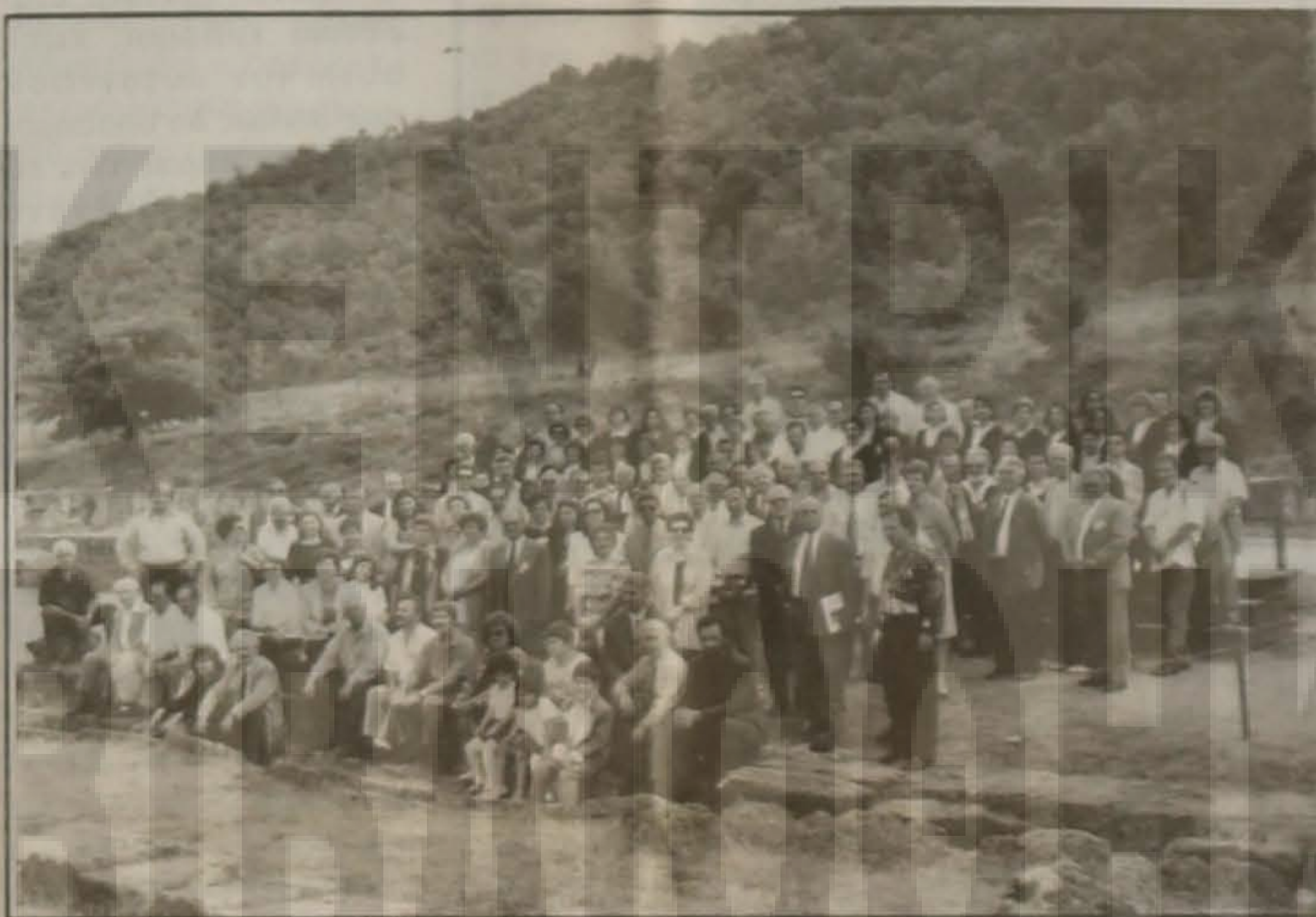
Οι Σύμβουλοι στη Βεργίνα.