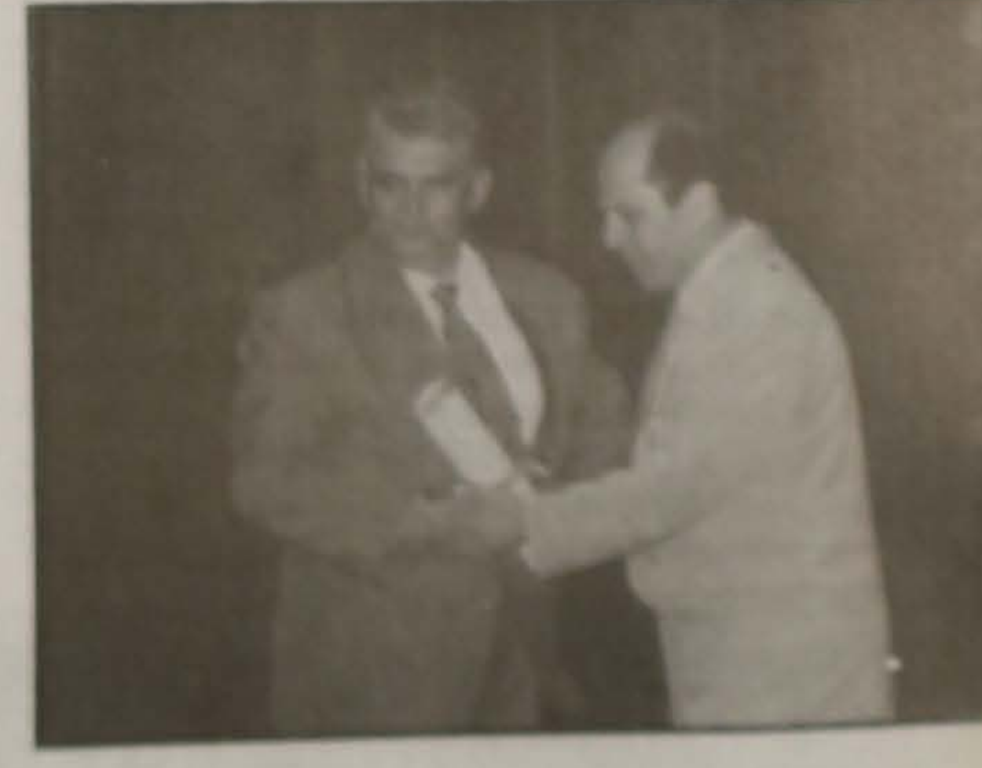
Ο τιμηθείς Κυριακός.