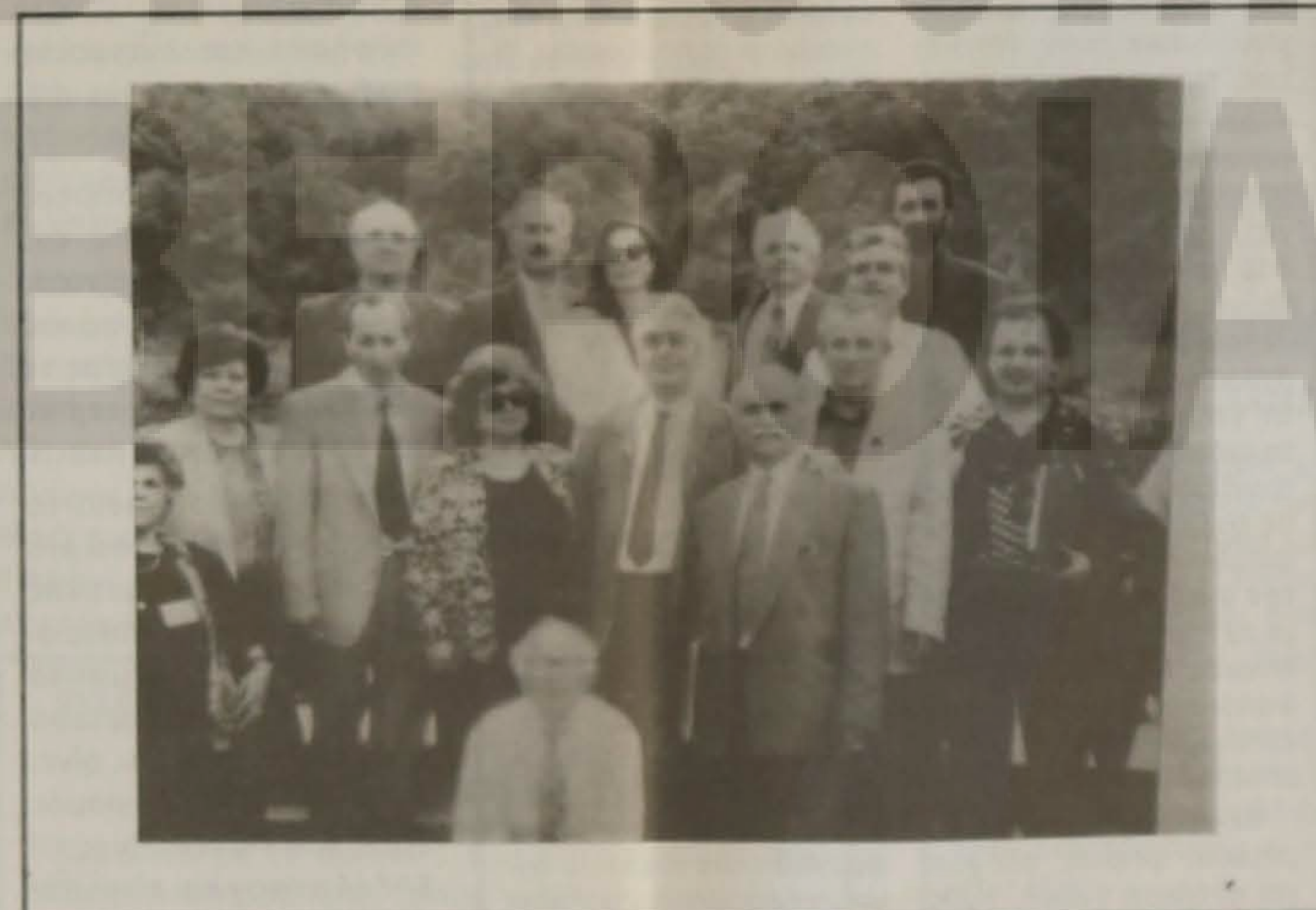
Αναμνηστικό στιγμιότυπο στη Βεργίνα.