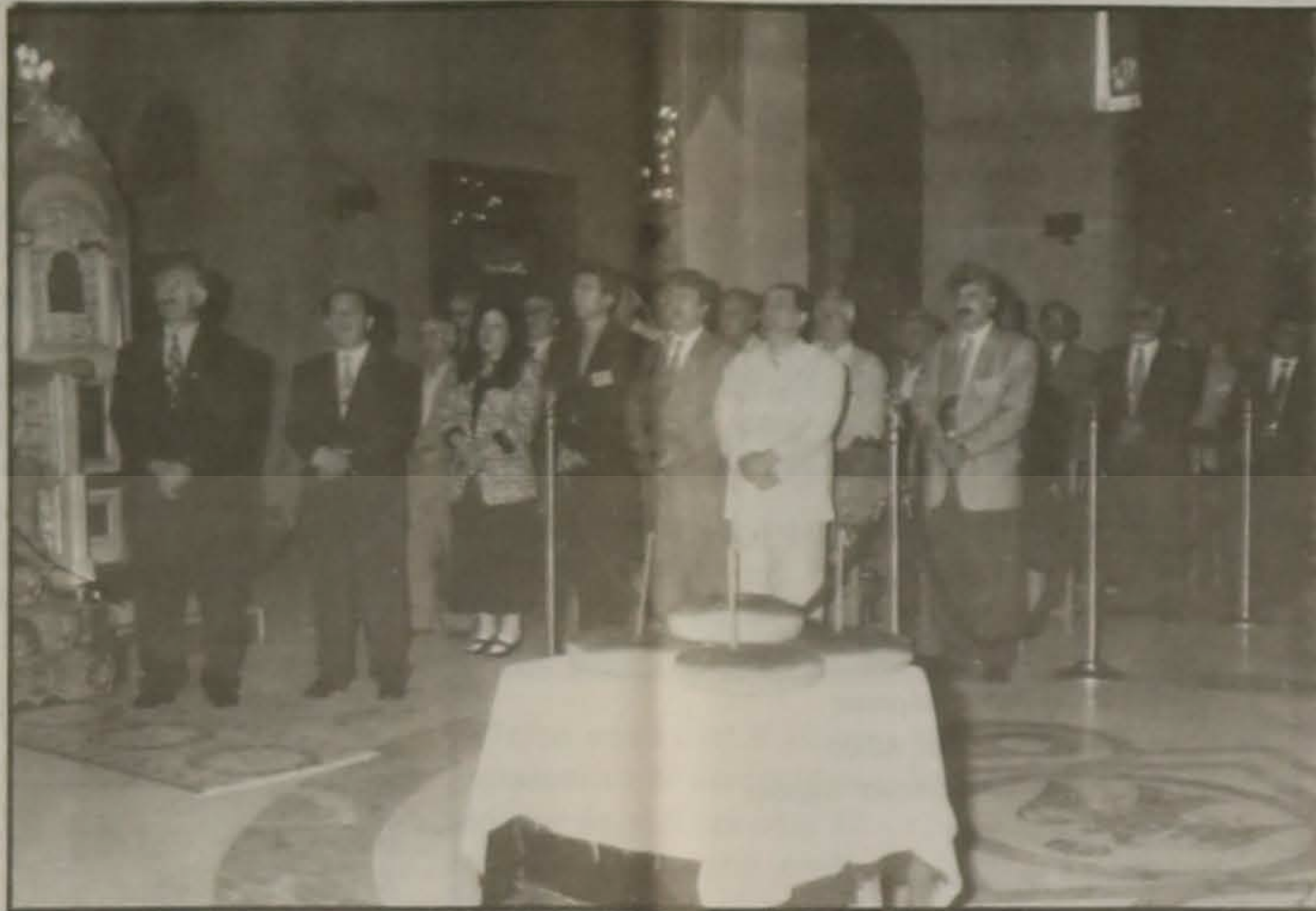
Οι Σύμβουλοι στον Ιερό Ναό Παναγίας Σουμελά.