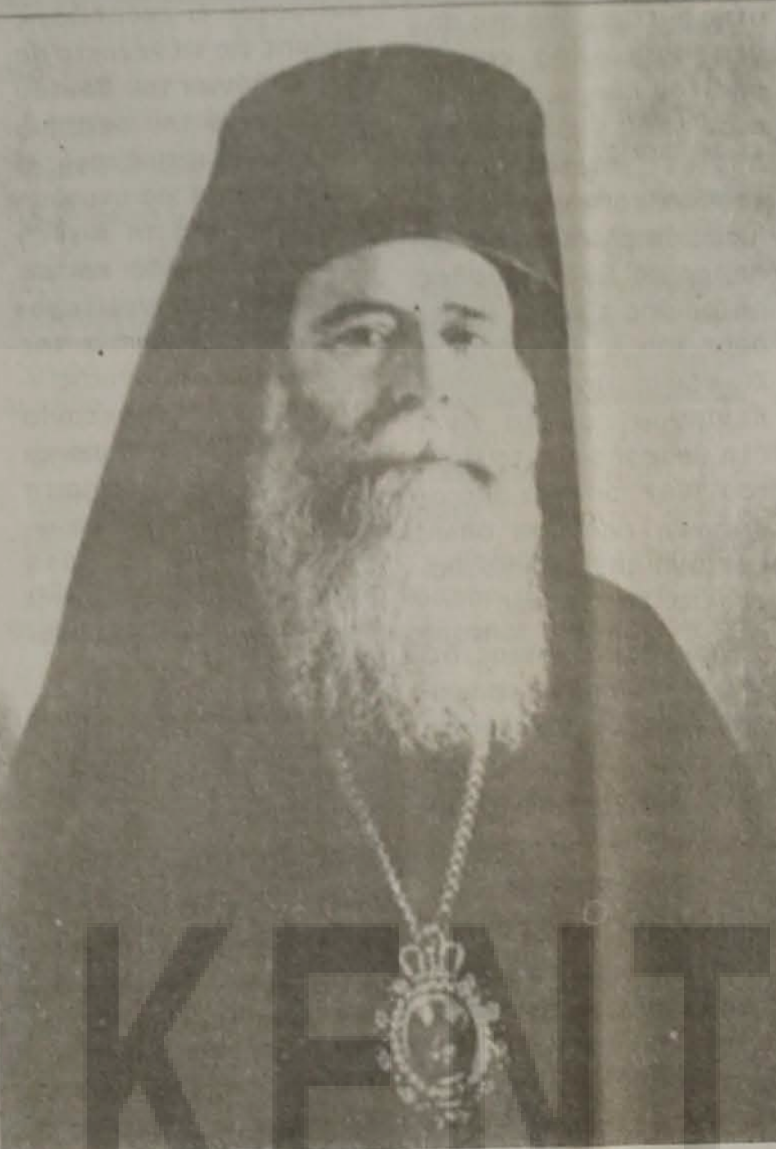
Ο ασίδημος Αρχιεπίσκοπος Αθηνών κυρός Χρυσάνθος ο από Τραπεζούντος (1881 - 1949).

Εις την επακοουθήσασαν συνομιλίαν, προσομιδίζουσαν προς την του Μεγάλου Βασιλείου προς τον εκπρόσωπον του αυτοκράτορος Μόδεστον, ο αρχιεπίσκοπος Χρυσάνθος βαθείαν επίγνωσιν έχων των αρχιερατικών και εθναρχικών καθηκόντων