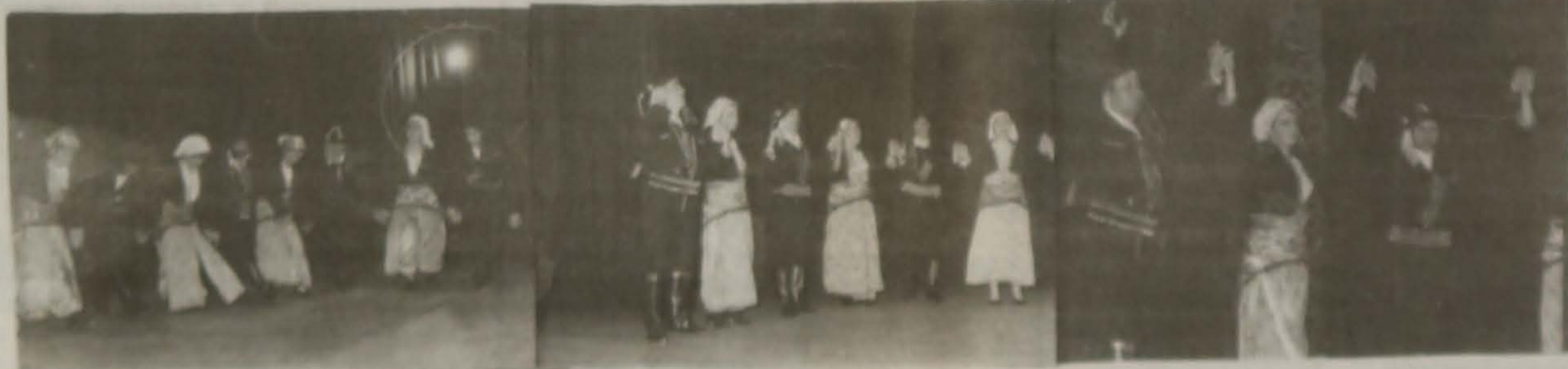
Από τις επιδείξεις του χορευτικού της Ε.Λ.Β.