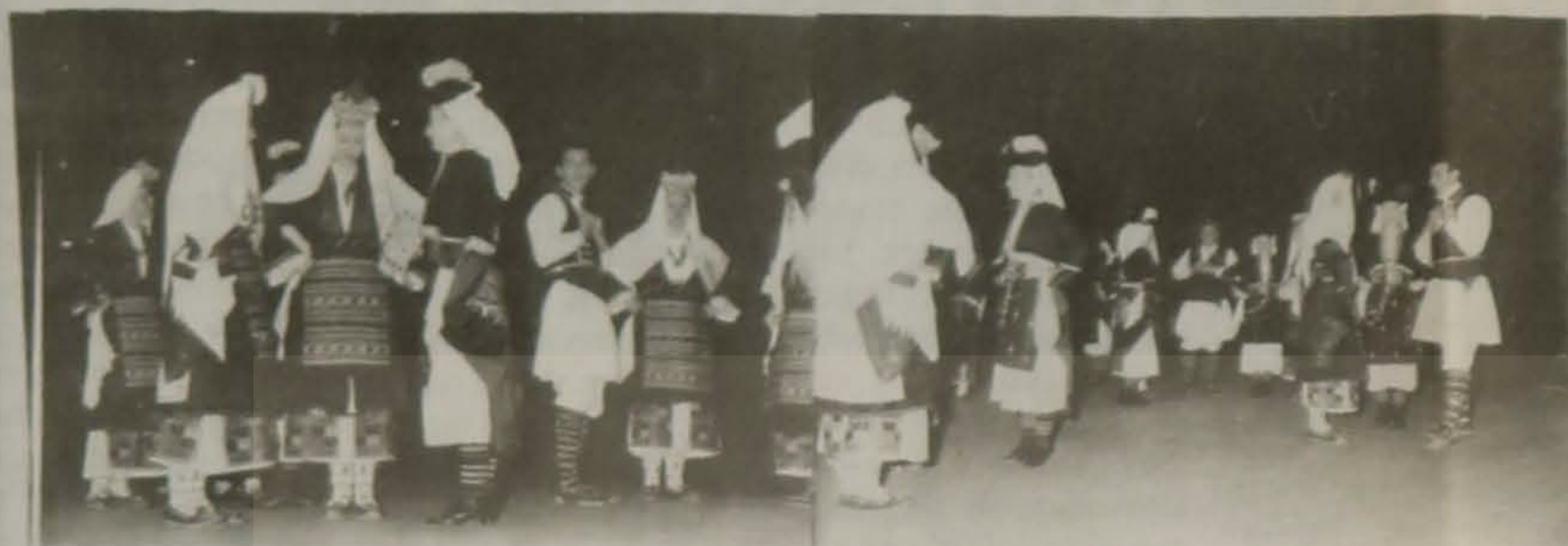
Από τις επιδείξεις του Λυκείου Ελληνίδων Βέροιας.