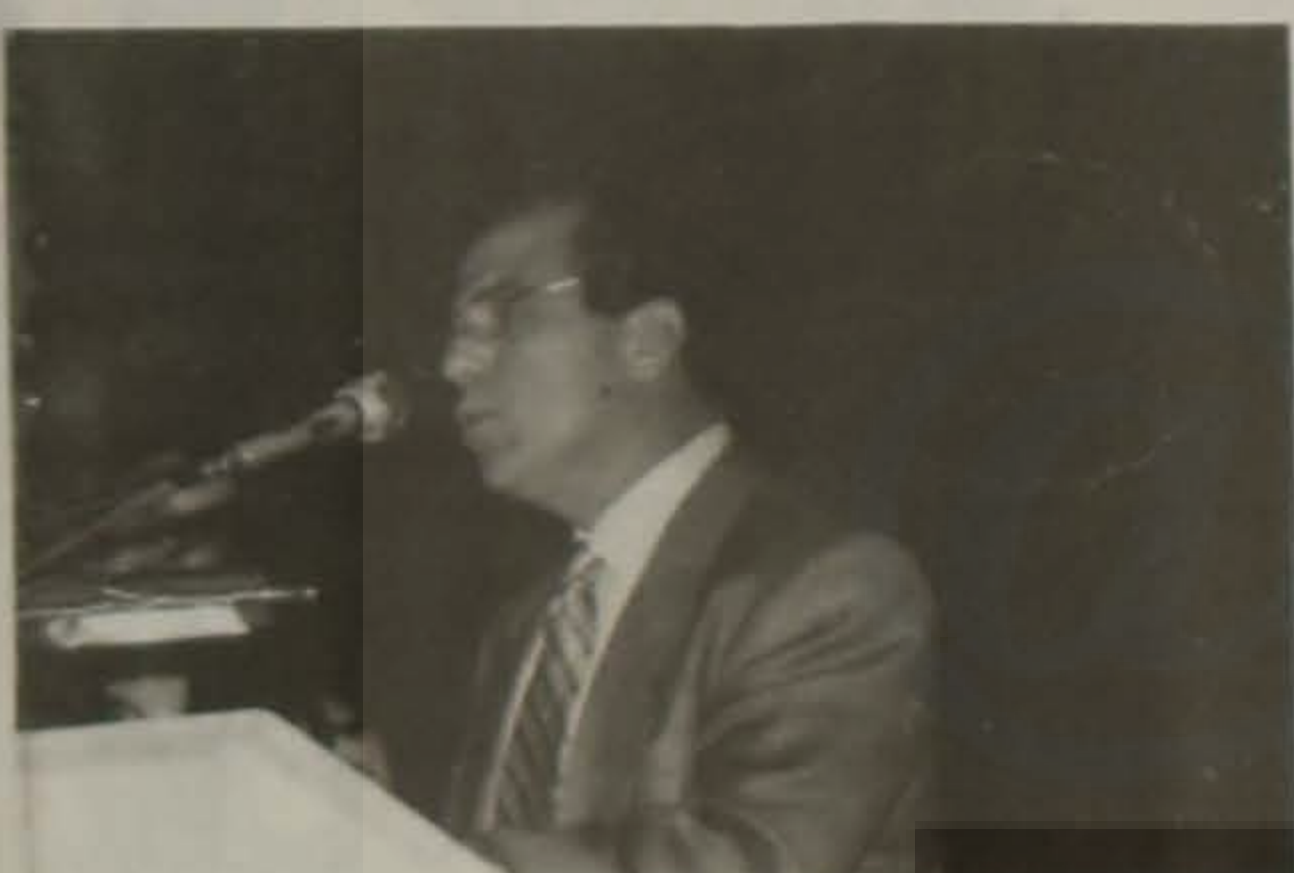
Ο Πρόεδρος της ΕΛΒ κ. Γ. Μιχαηλίδης, ενώ απευθύνει χαιρετισμό.