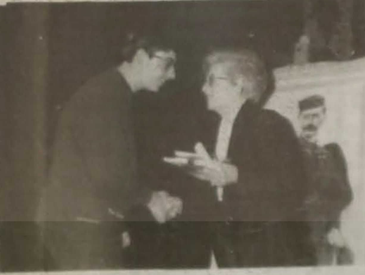
Από τις βραβεύσεις των μαθητών.