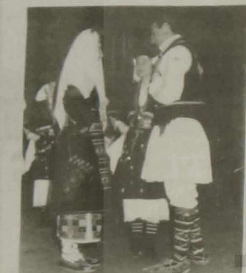
Επιδείξεις από την 1η σεβ.