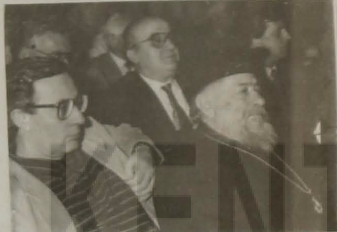
Από το ακροατήριο.

...ανισαν την πρέπενουσα... ...κατά την 1η σεβ.