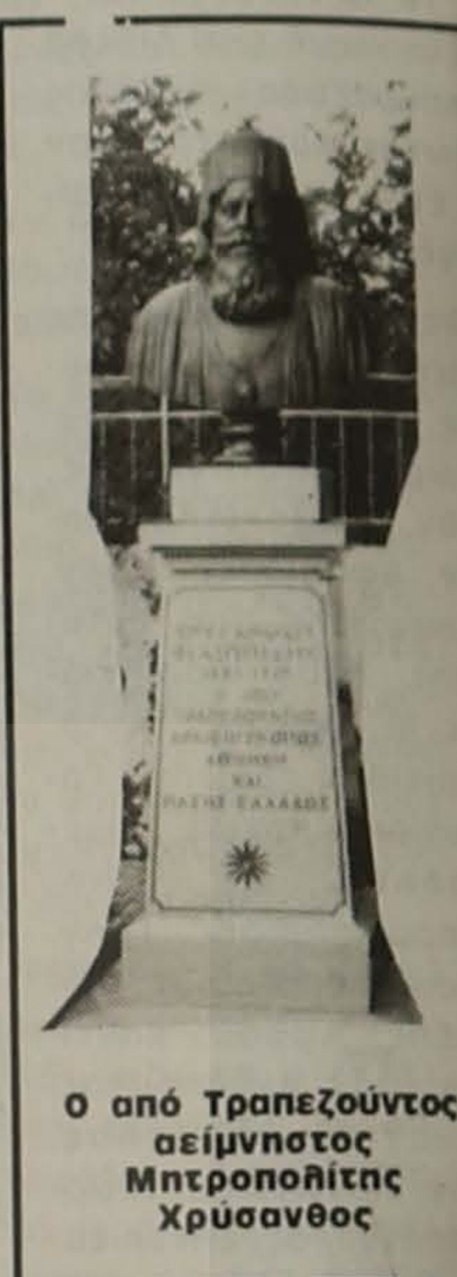
Ο από Τραπεζούντας αείμνηστος Μητροπολίτης Χρυσάνθος

Κατάθεσα ήδη την καλή μας μαρτυρία για τις συγγραφικές ικανότητες του εκλεκτού αυτού Ποντιολόγητη Ιερωμένου μας, του κ. Παύλου Αποστολίδη. Και το κάνουμε με πολλή