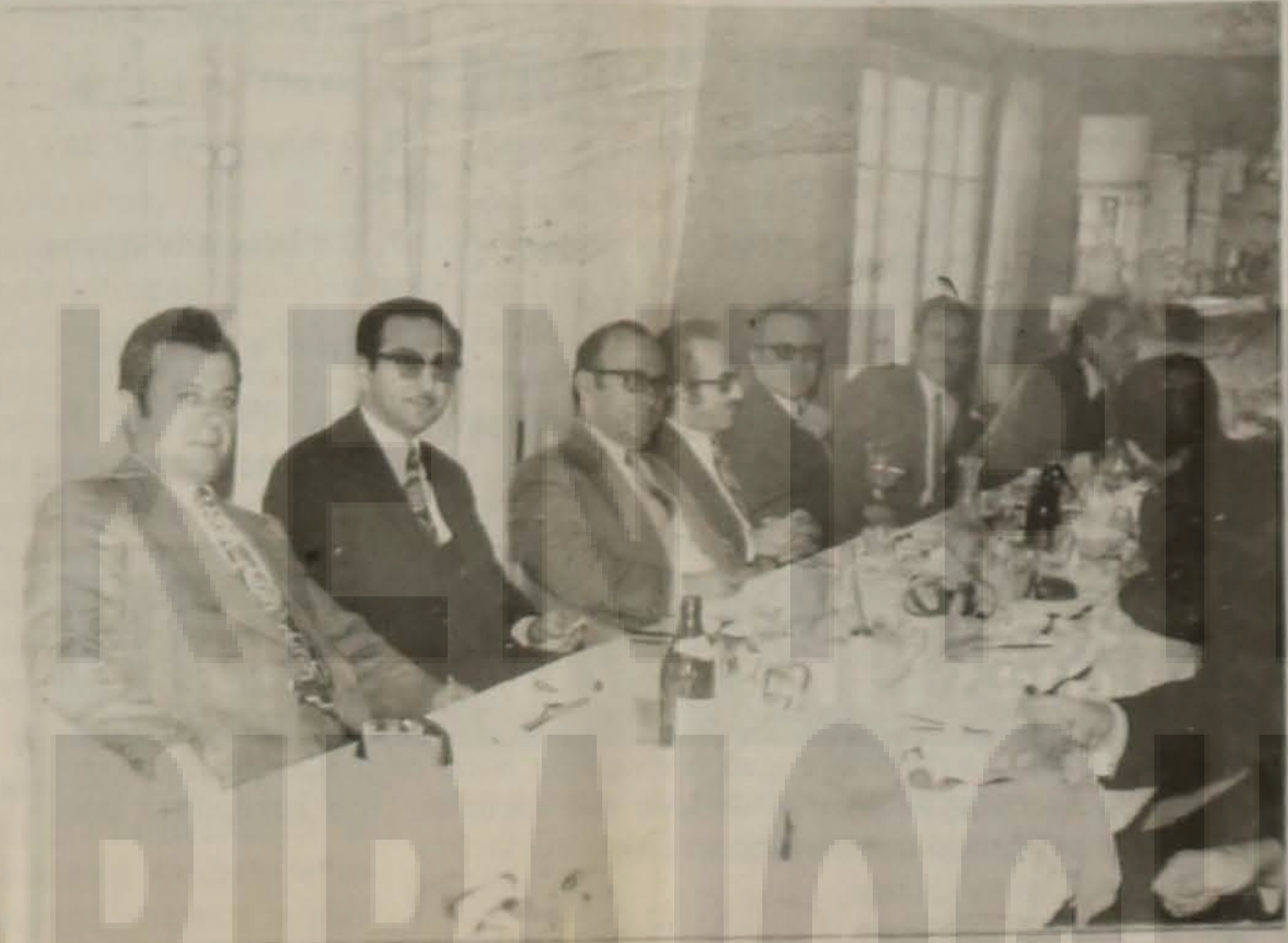
Δεκαετία του '60. Μέλη του Δ.Σ. της Ε.Λ.Β.

Μέσα σε μία ιδιαίτερα θερμή και πατριωτική ατμόσφαιρα στις 17-12-1994 το Διοικητικό Συμβούλιο της Ευξείνου Λέσχης Βέροιας τίμησε με σεμνή εκδήλωση τους ιδρυτές του Σωμα-