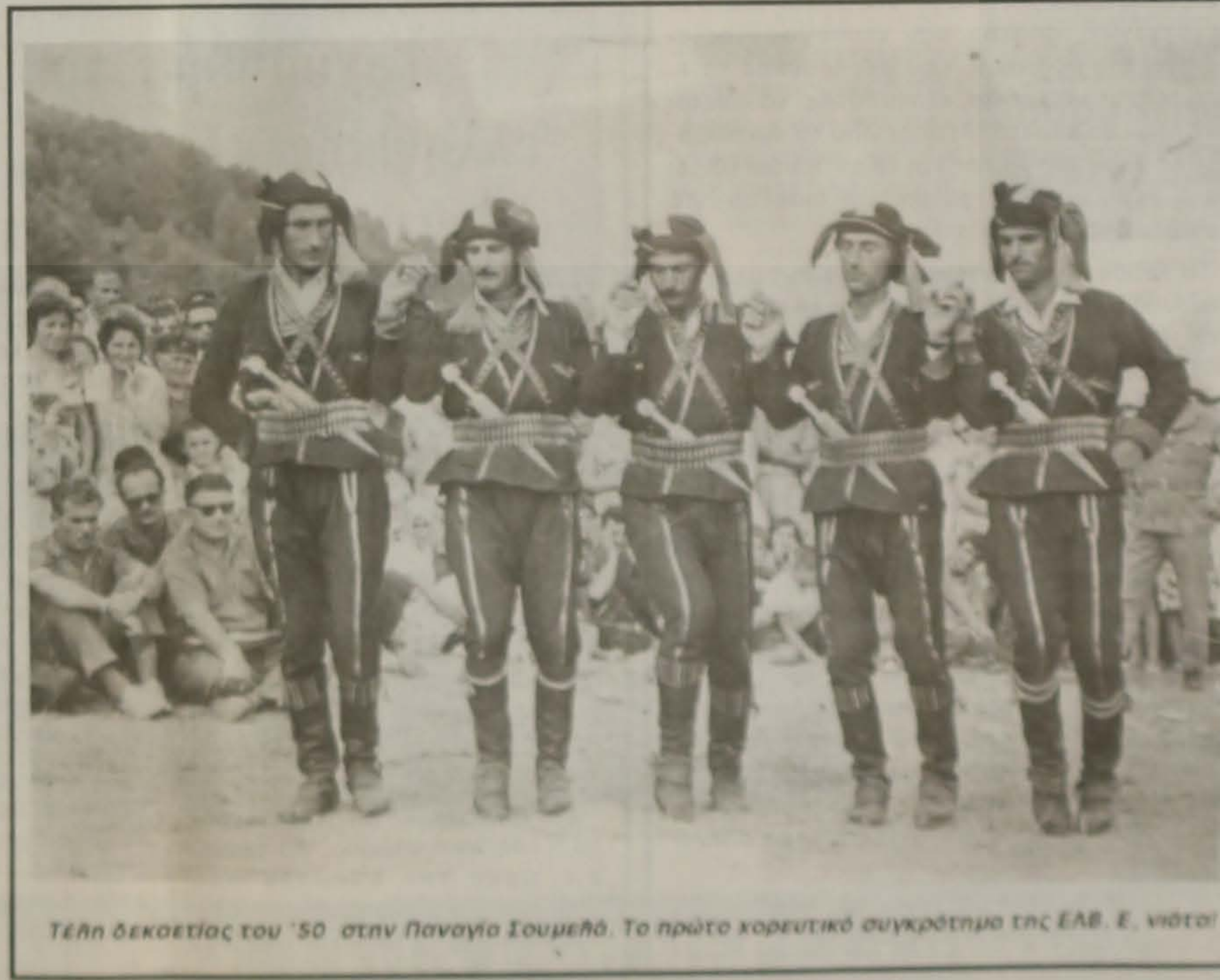
Τέλη δεκαετίας του '50 στην Παναγία Σουμελά. Το πρώτο χορευτικό συγκρότημα της ΕΑΒ. Ε. νιώτσι

"Κι ακούμε με τα ιστορικά μας αυτιά τον Ξενοφώντα με τους Μυρίους του να ξεσπάσει σε αλλαγαμούς χαράς πάνω από την Θύχη της Μικράς Ασίας αγναντεύοντας τον Εύξεινο: "Θάλαττα! Θάλαττα!..."