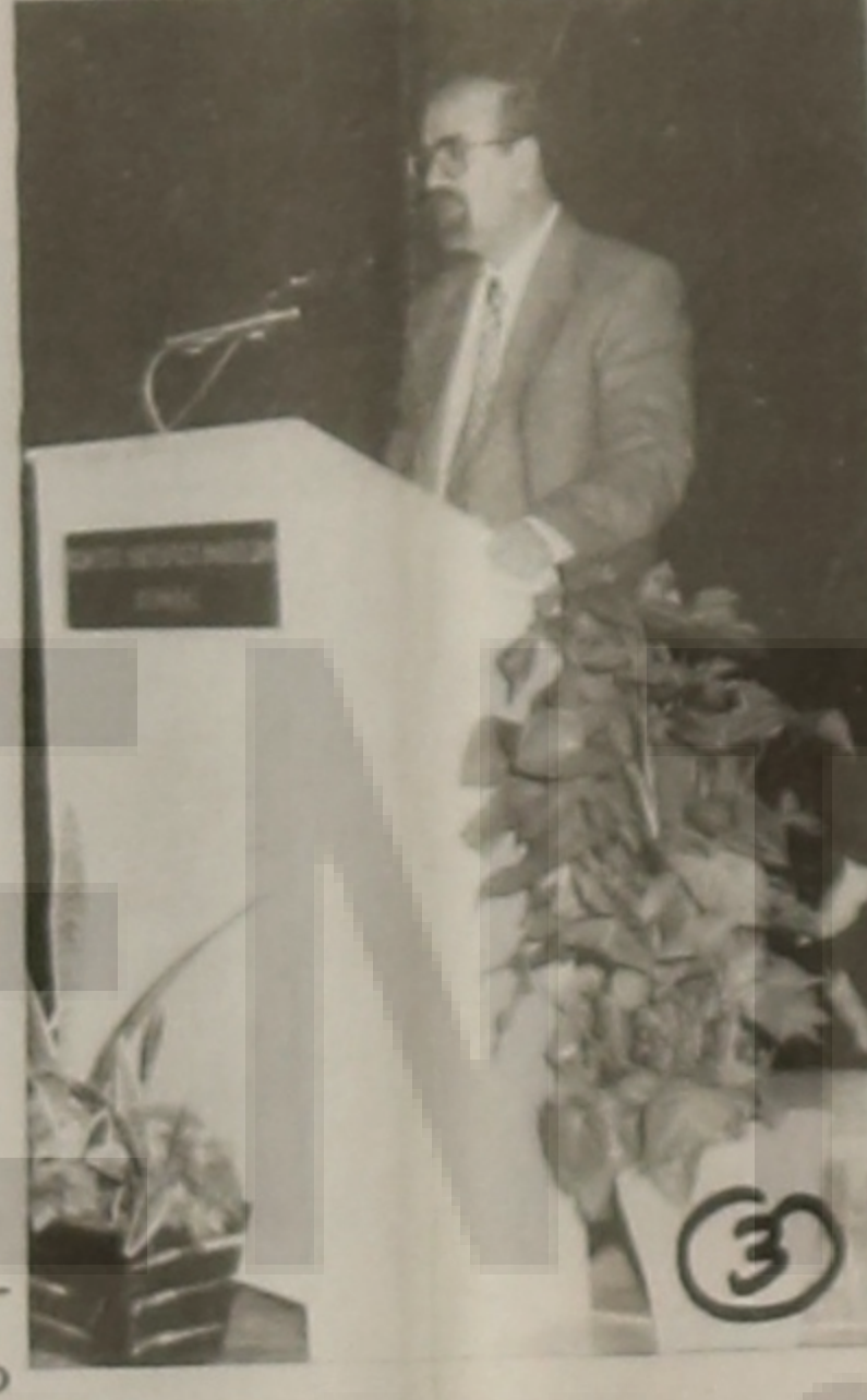
Ο Περιφερειακός κ. Ζήσης Μπεθιάγκας

Τέλος, την εκδήλωση τίμησαν με την παρουσία τους ο Μητροπολίτης Βέροιας Σεβασμιώτατος κ. Παντελεήμων, ο Νομάρχης Ημαθίας κ. Ανδρέας Βλοζάκης, ο Δήμαρχος Βέροιας κ. Γιάννης Χασιώτης, εκπρόσωπος του Διοικητή Β' Σ.Σ., της Αστυνομίας, της Πυροσβεστικής Υπηρεσίας, των Δικαστικών Αρχών, Νομαρχιακοί και Δημοτικοί