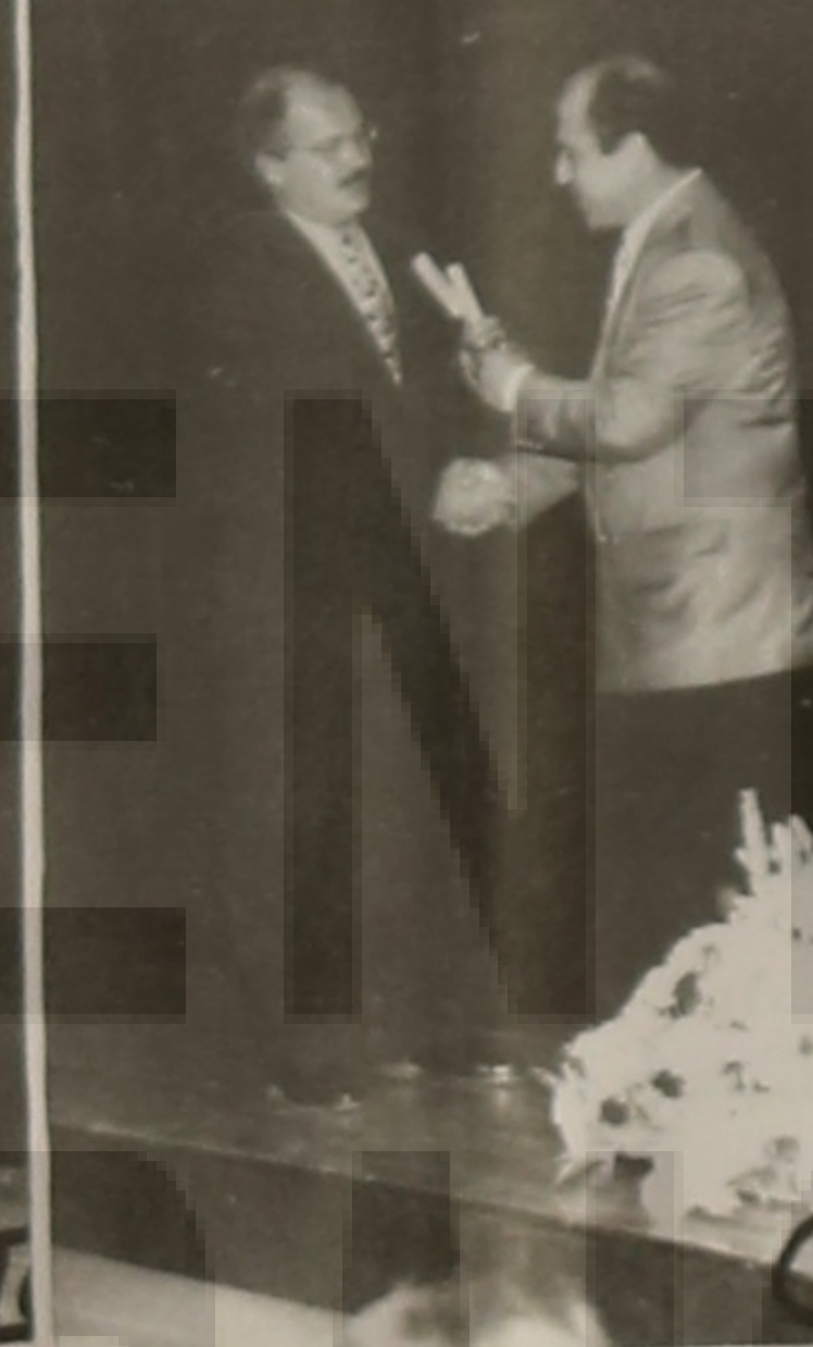
Από τη Ραδιοφωνία Ημαθίας