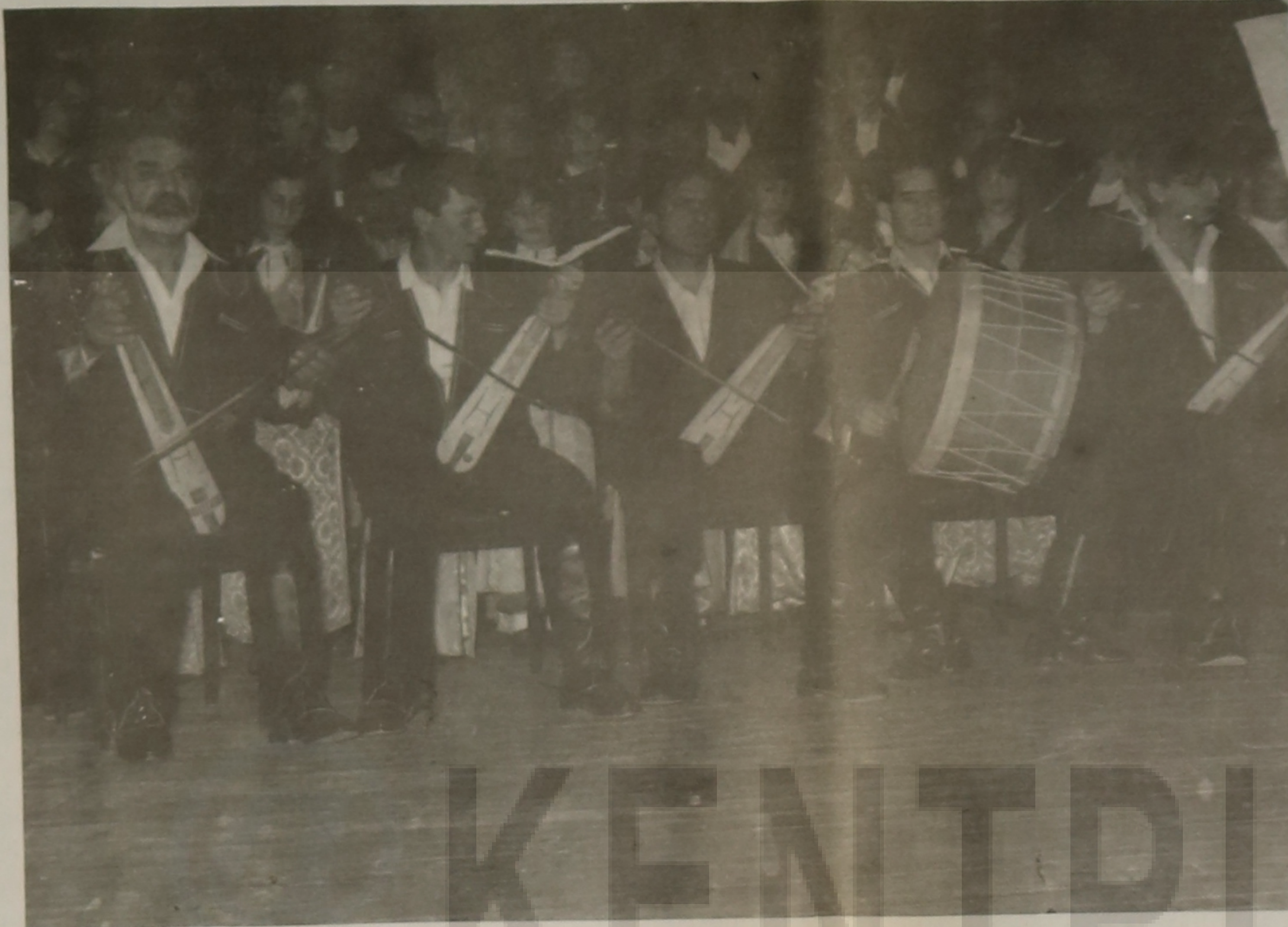
Η ΕΛΒ απαντά στον κ. Δήμαρχο

Αξιότιμε κ. Δήμαρχε, κάποιος χρόνος ίσως και Αφήσαμε να περάσει