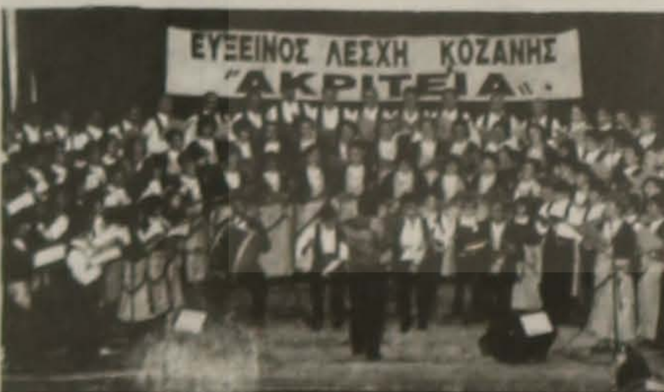
ΕΥΞΕΙΝΟΣ ΛΕΣΧΗ ΚΟΖΑΝΗΣ "ΑΚΡΙΤΕΙΑ"

ΝΕΟΣ ΔΙΣΚΟΣ ΜΕ ΠΑΡΑΔΟΣΙΑΚΑ ΠΟΝΤΙΑΚΑ ΤΡΑΓΟΥΔΙΑ ΜΕ ΤΗΝ ΕΠΙΜΕΛΕΙΑ ΤΟΥ ΚΩΣΤΑ ΚΑΡΑΠΑΝΑΓΙΩΤΙΔΗ