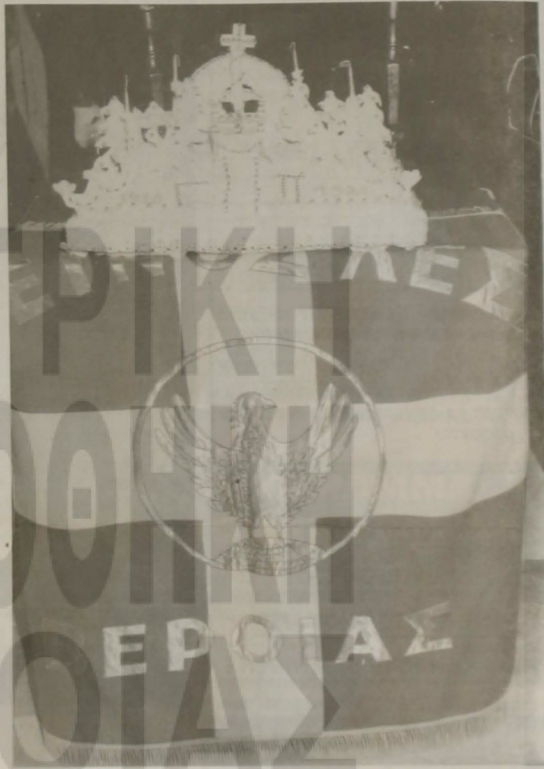
"Αιώνια αυτών η μνήμη".

Η ΓΕΝΟΚΤΟΝΙΑ Κορυφώθηκαν φέτος στην Ελλάδα και στο εξωτερικό οι εκδηλώσεις για την επέτειο της γενοκτονίας του Ελληνισμού του Πόντου από το κεμαλικό καθεστώς και τους νεοτούρκους, που στις αρχές του 20ού αι. οδήγησαν στο θάνατο 352.000 Έλληνες. Η γενοκτονία, μετά από 70 χρόνια, και με την ευαισθητοποίηση ορισμένων ανθρώπων, εκπροσώπων ποντιακών φορέων και επιστημόνων, που έδωσαν και δίνουν αγώνες για το δικαίωμα στη μνήμη, άρχισε να τηρείται από την επίσημη πολιτεία.