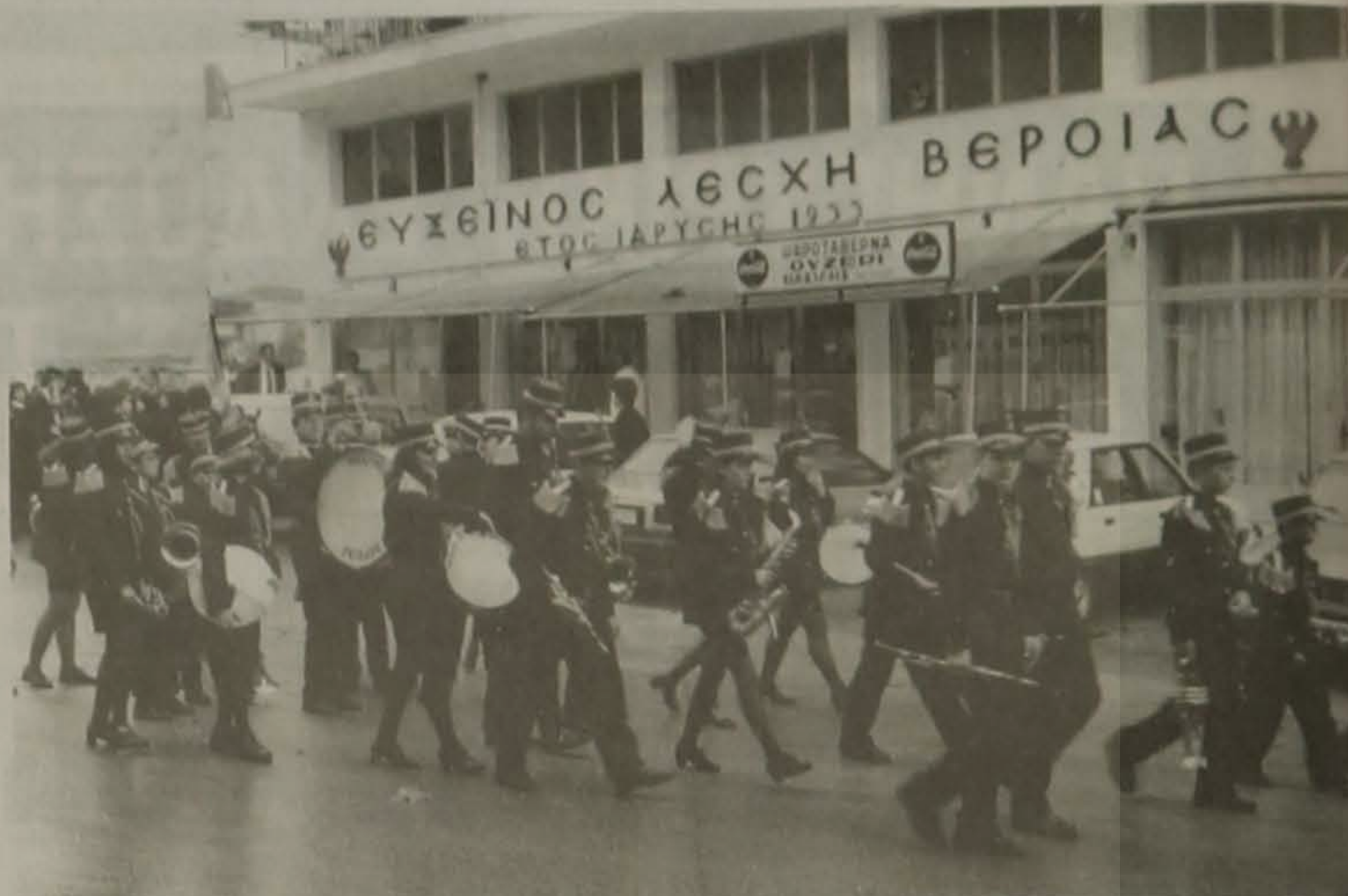
Η Φιλαρμονική του Δήμου Βέροιας.