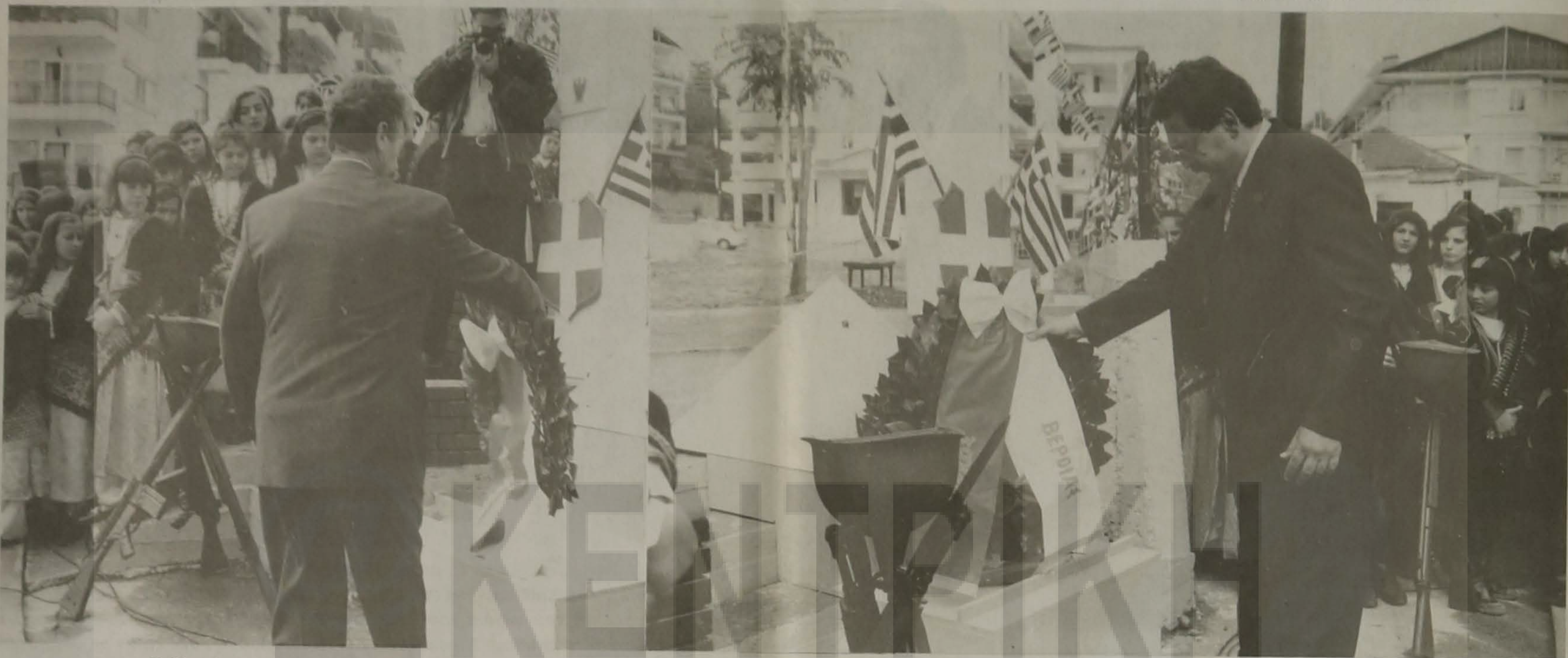
Ο Νομάρχης Ηρακλίας κ. Ανδρέας Βλαζάκης.