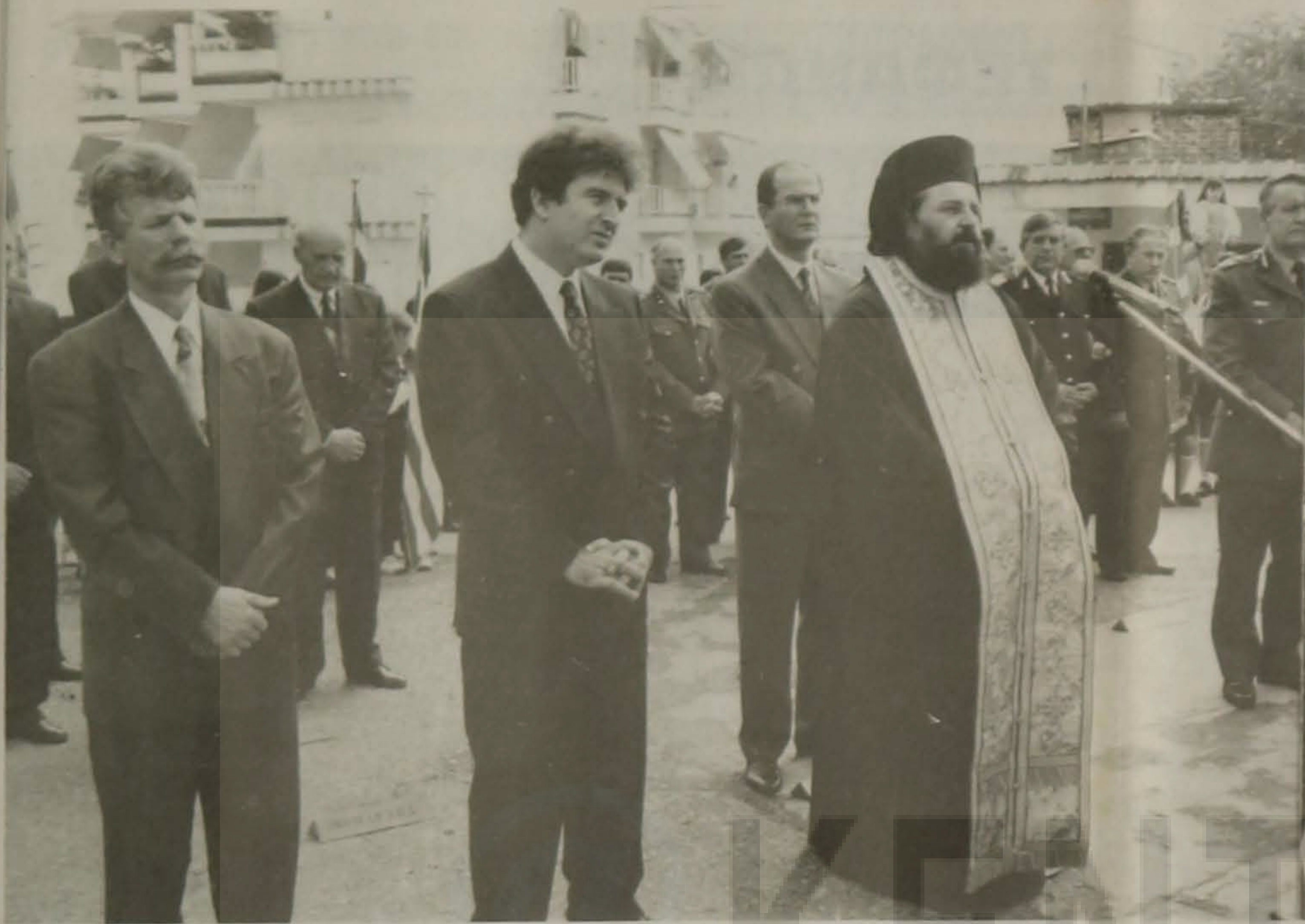
Στιγμιότυπο από την επιμνημόσυνη δέηση στο μνημείο του εθνομάρτυρα Νίκου Καπετανίδη.