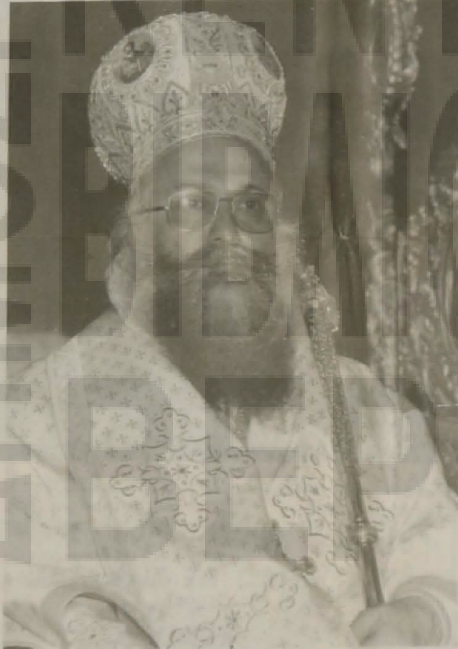
Ο Σεβασμιώτατος Μητροπολίτης κ.κ. Παντελεήμων κατά την δοξολογία.

Ακολούθησε στη συνέχεια κατάθεση στεφάνων από τις Αρχές και τους