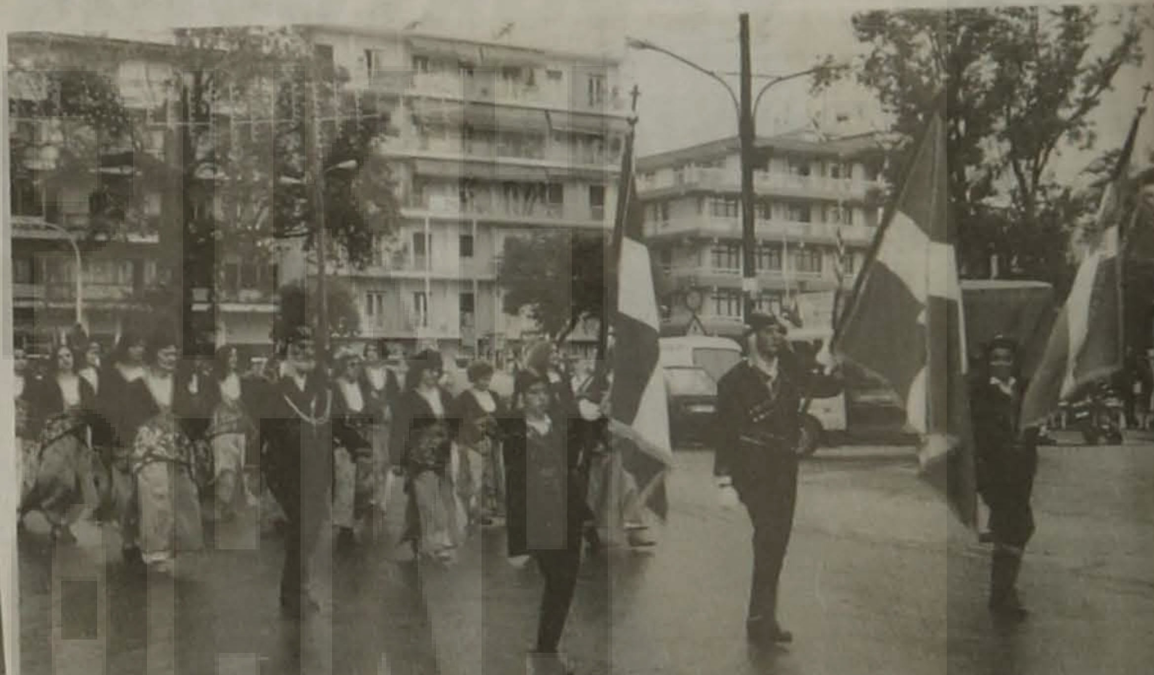
Τα τιμητικά τμήματα.