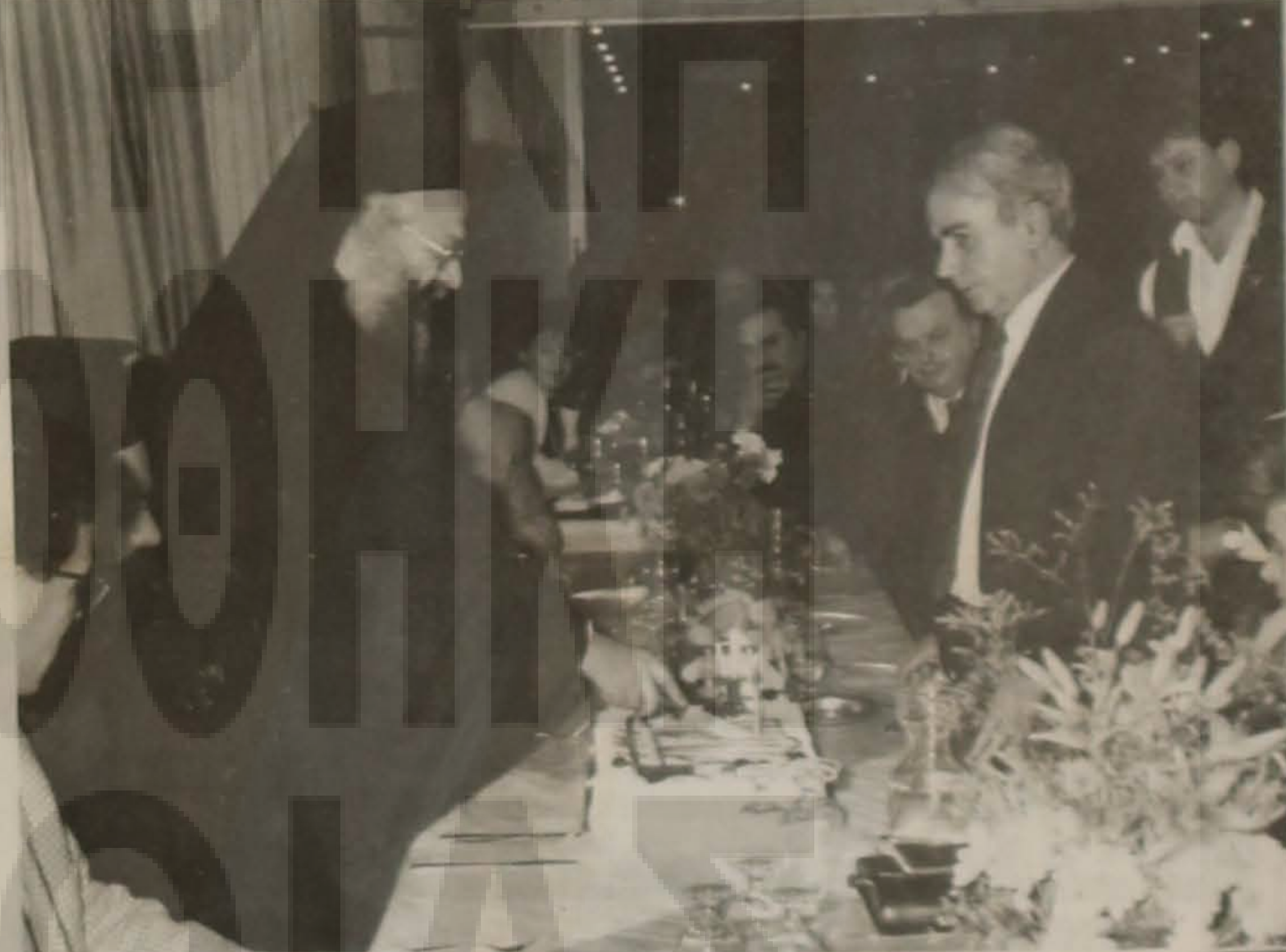
Ο Σεβασμιώτατος Μητροπολίτης ενώ κόβει την τούρτα των γενεθλίων του "Αργοναύτη".

Στην αρχή της εκδήλωσης έψαλαν τα παραδο-