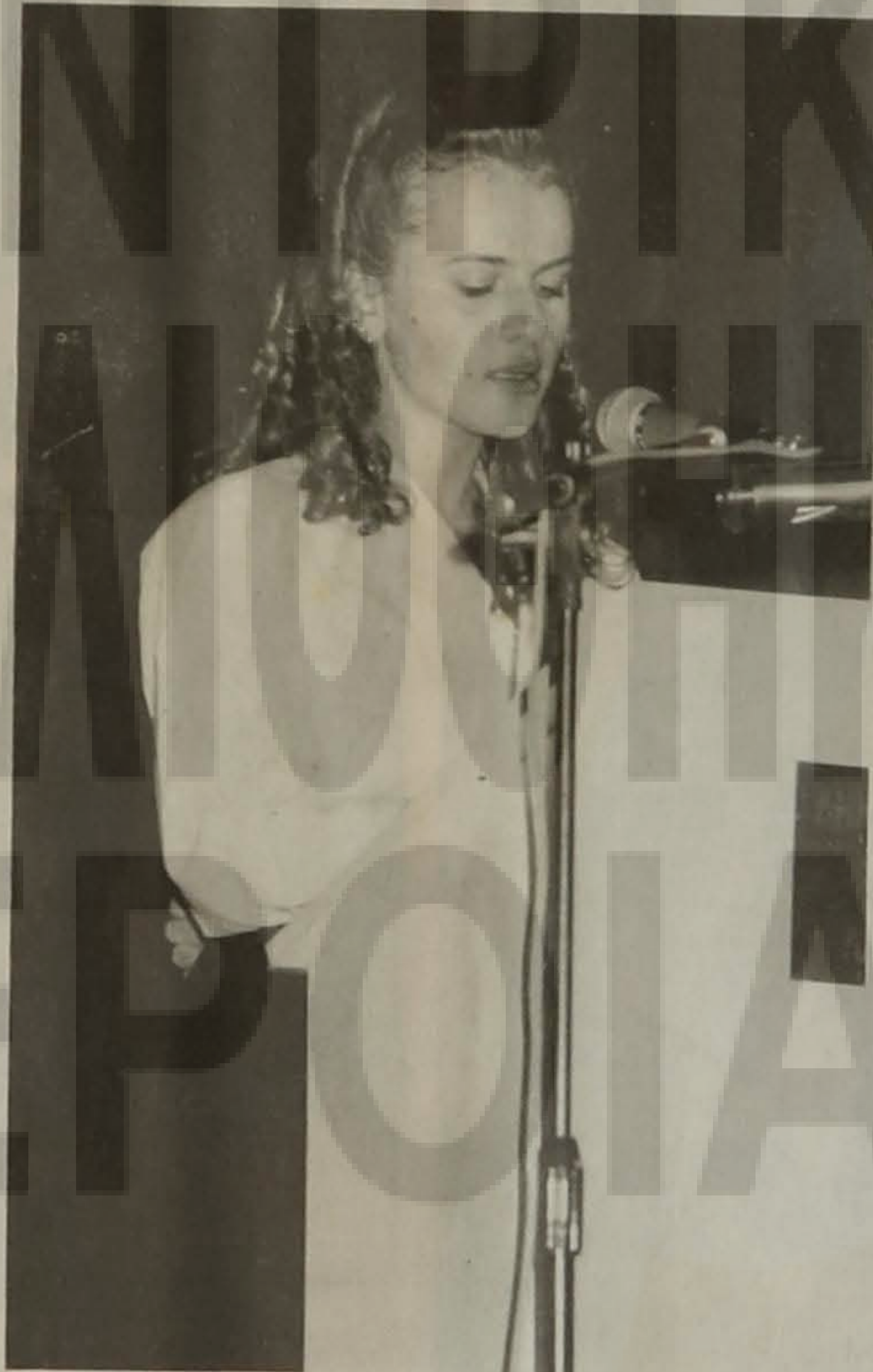
Η απαγγελία ποιήματος