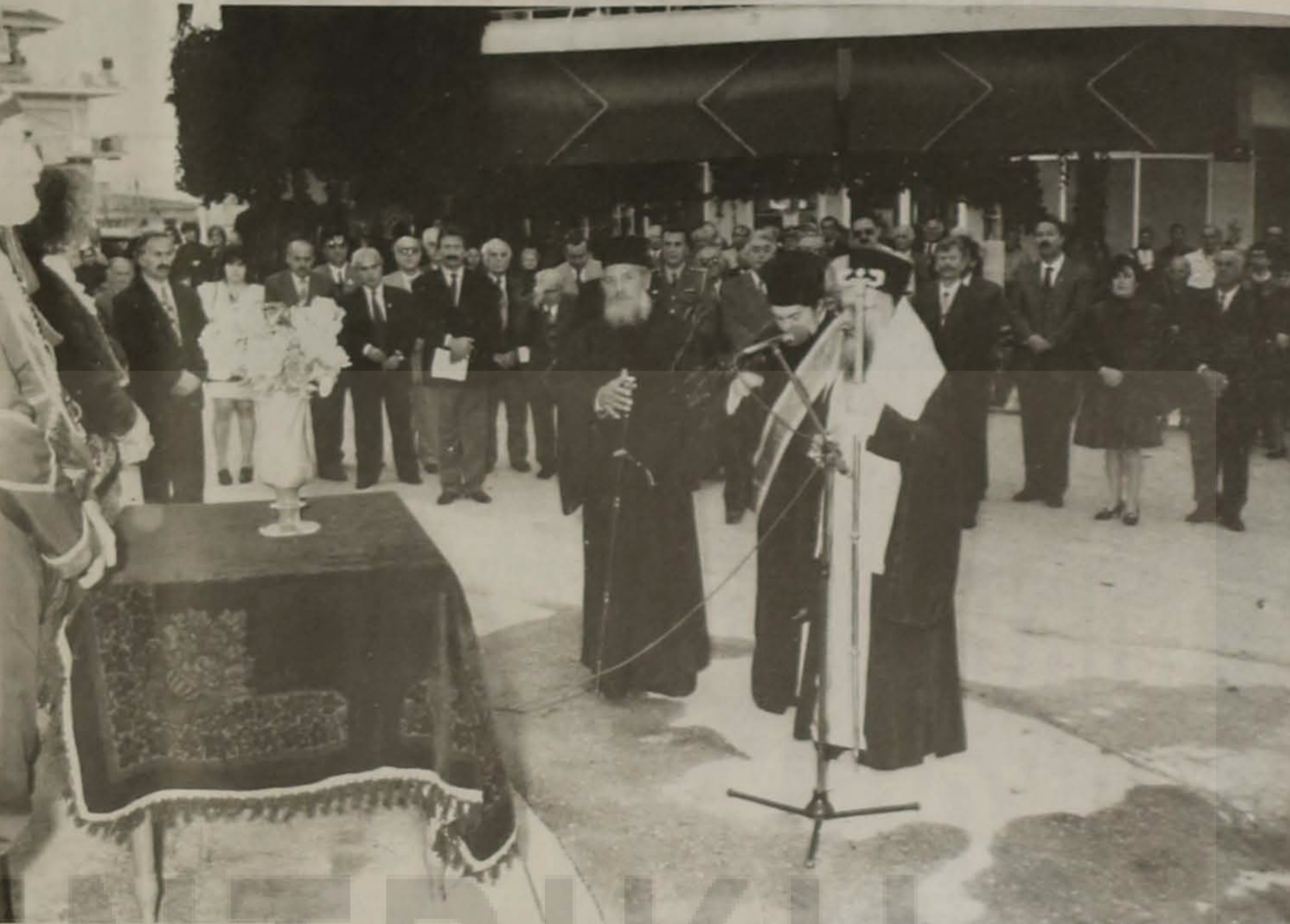
Στιγμιότυπο από την Αρχιερατική Επιμνημόσυνη δέηση στο χώρο των αποκαλυπτηρίων.

Όλοι οι πρόσφυγες, που ήρθαν στην Ελλάδα την περίοδο των ανταλλαγών μα και οι νεοπρόσφυγες αδελφοί μας, που ήλθαν και έρχονται από την πρώην Σοβιετική Ένωση, είχαν πληγωμένη ψυχή. Εφεραν, όμως, μαζί με τον πόνο και τη νοσταλγία και τη χριστιανοσύνη με τις εικόνες στον κόρφο τους, έφεραν την