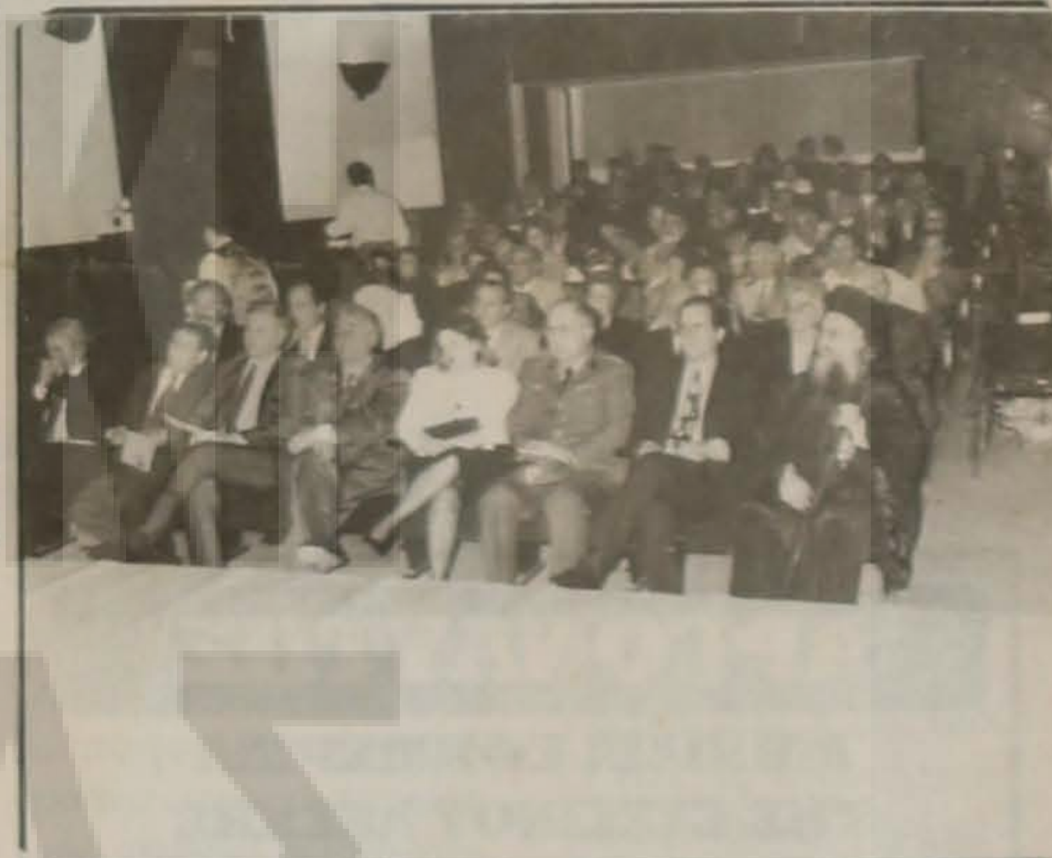
Στιγμιότυπο από την παρακολούθηση της φιλολογικής επιμνημόσυνης εκδήλωσης.

Στη συνέχεια έγινε κατάθεση στεφάνων, ακολούθησε σιγή ενός λεπτού, εθνικός ύμνος από τη Μπάντα του Δήμου και οι σεμνές αυτές εκδηλώσεις έκλεισαν με δεξίωση.