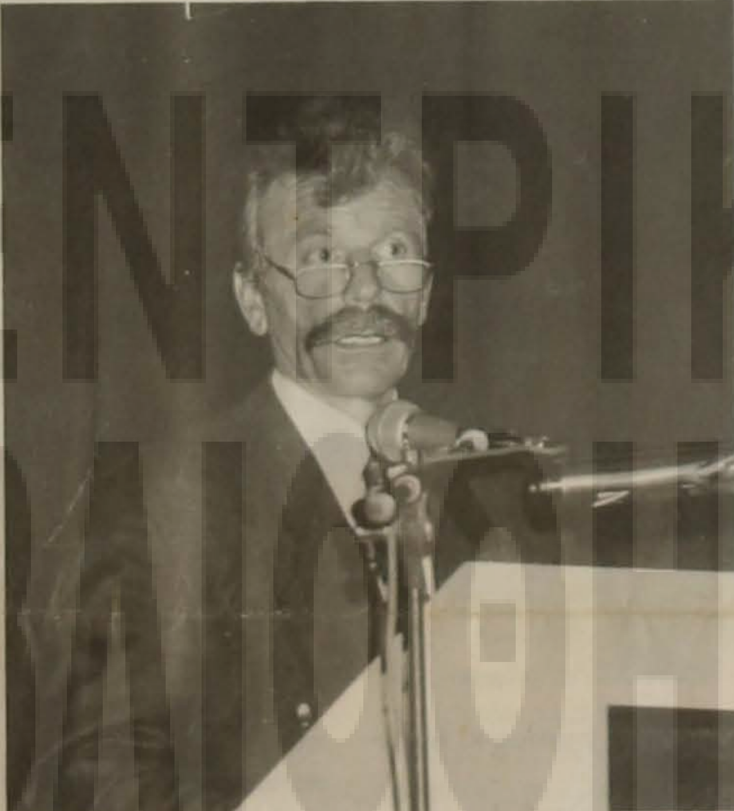
Ο Δήμαρχος Βεροίας κ. Ανδρέας Βλαζάκης ενώ απευθύνει το θερμό χαιρετισμό του.

Ναό Αγίου Αντωνίου Αρχιερατικό Μνημόσυνο, χοροστατούτος του Σεβασμιωτάτου Μητροπολίτη κ. Παντελεήμονα και επιμνημόσυνη ομιλία α-