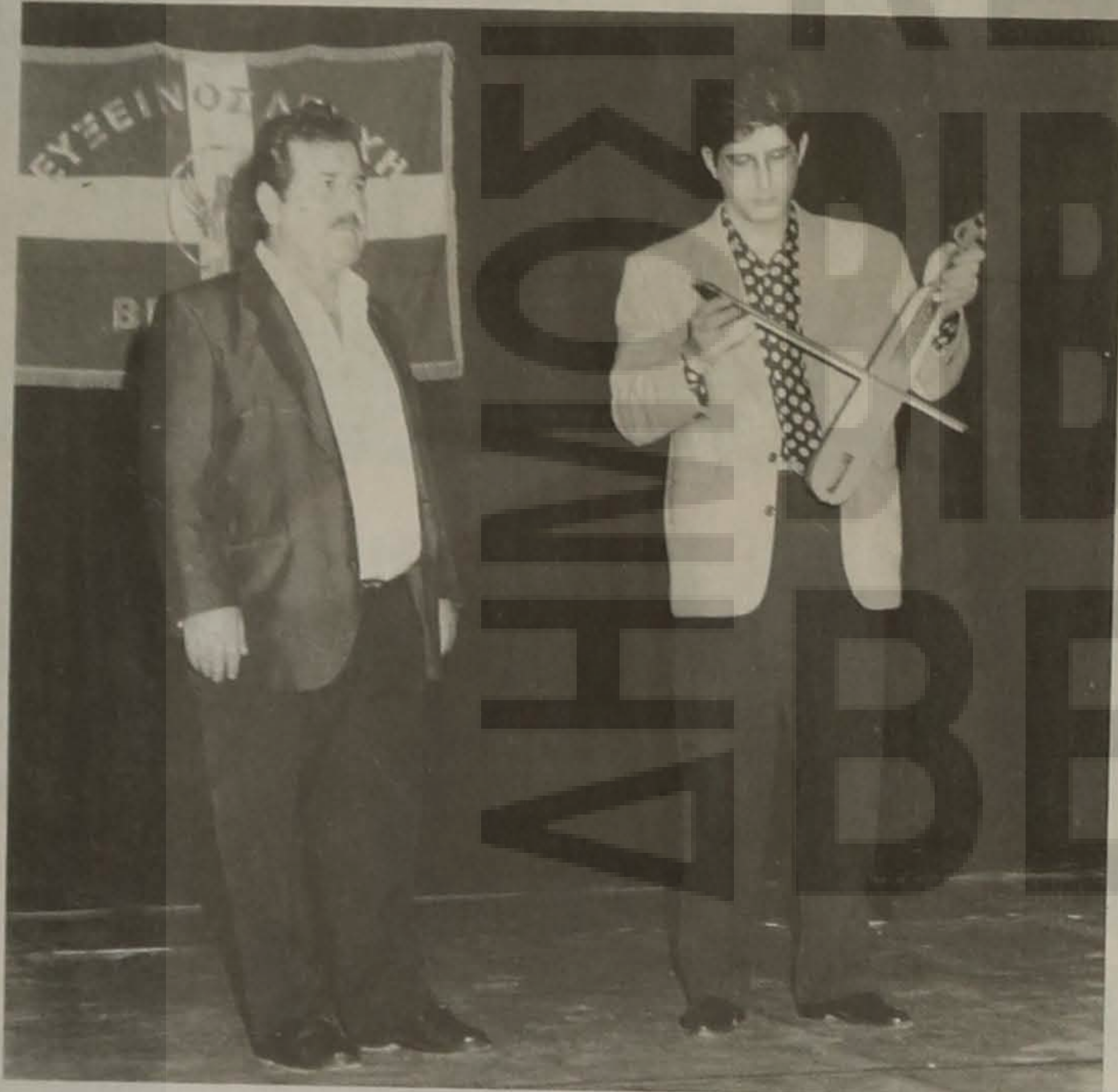
Οι καλλιτέχνες της εκδήλωσης