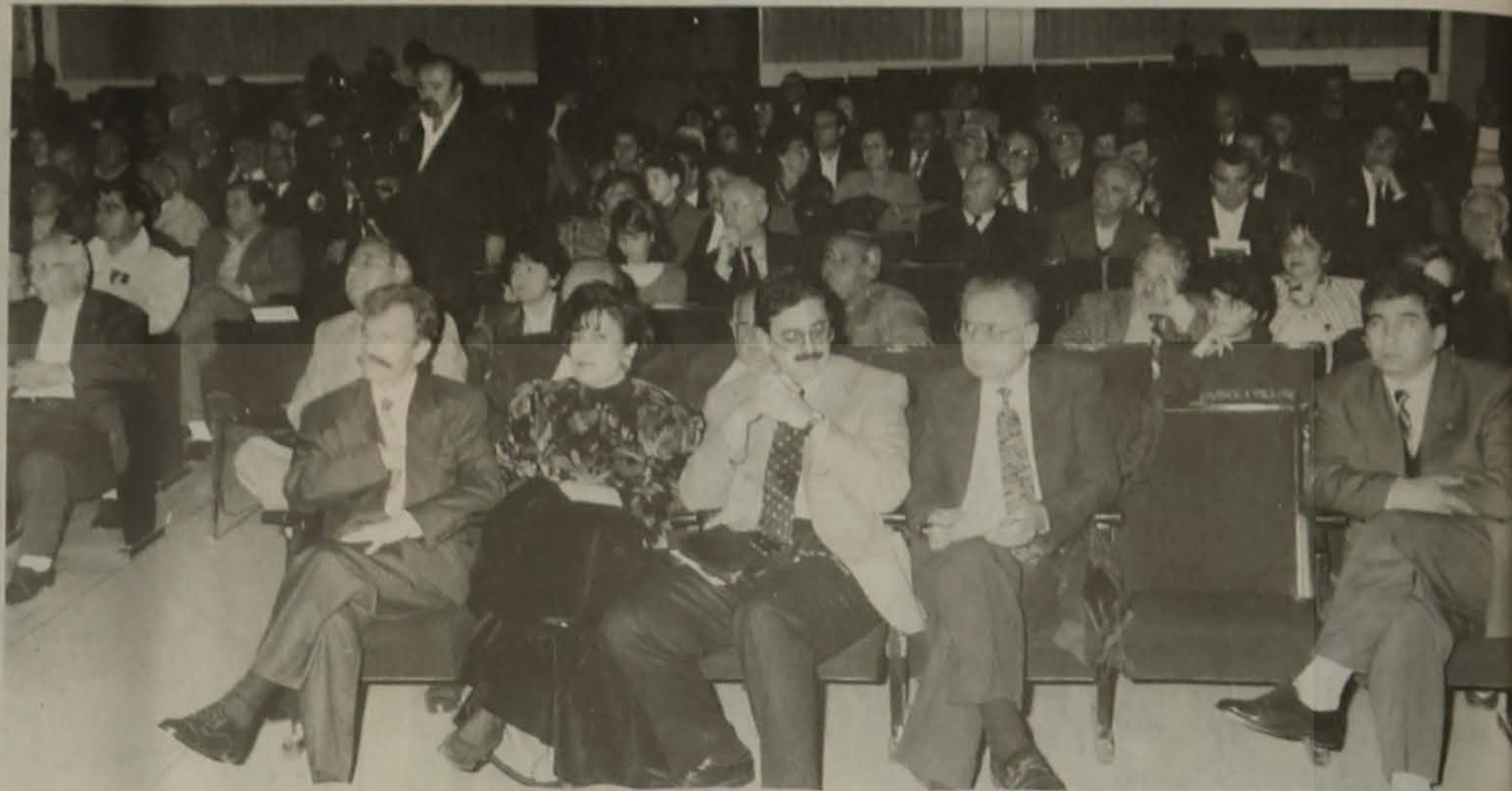
Στιγμιότυπο από την παρακολούθηση της φιλολογικής επιμνημόσυνης εκδήλωσης.