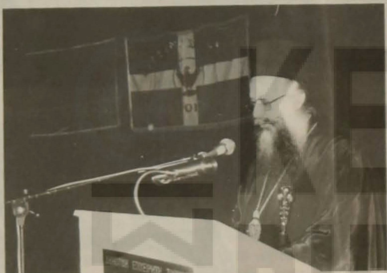
Ο Σεβασμιώτατος Μητροπολίτης Βεροίας, Ναούσης και Καμπανίας κ. Παντελεήμων, ενώ απευθύνει χαιρετισμό, που ιδιαίτερα εντυπωσίασε το ακροατήριο.

Στην εκδήλωση απηύθυναν χαιρετισμούς ο κ. Παντελεήμονας, Μητροπολίτης Βεροίας, ο Δήμαρχος κ. Ανδρέας Βλαζάκης, ο εκπρόσωπος της Πανελληνίας Ομοσπονδίας Ποντιακών Σω-