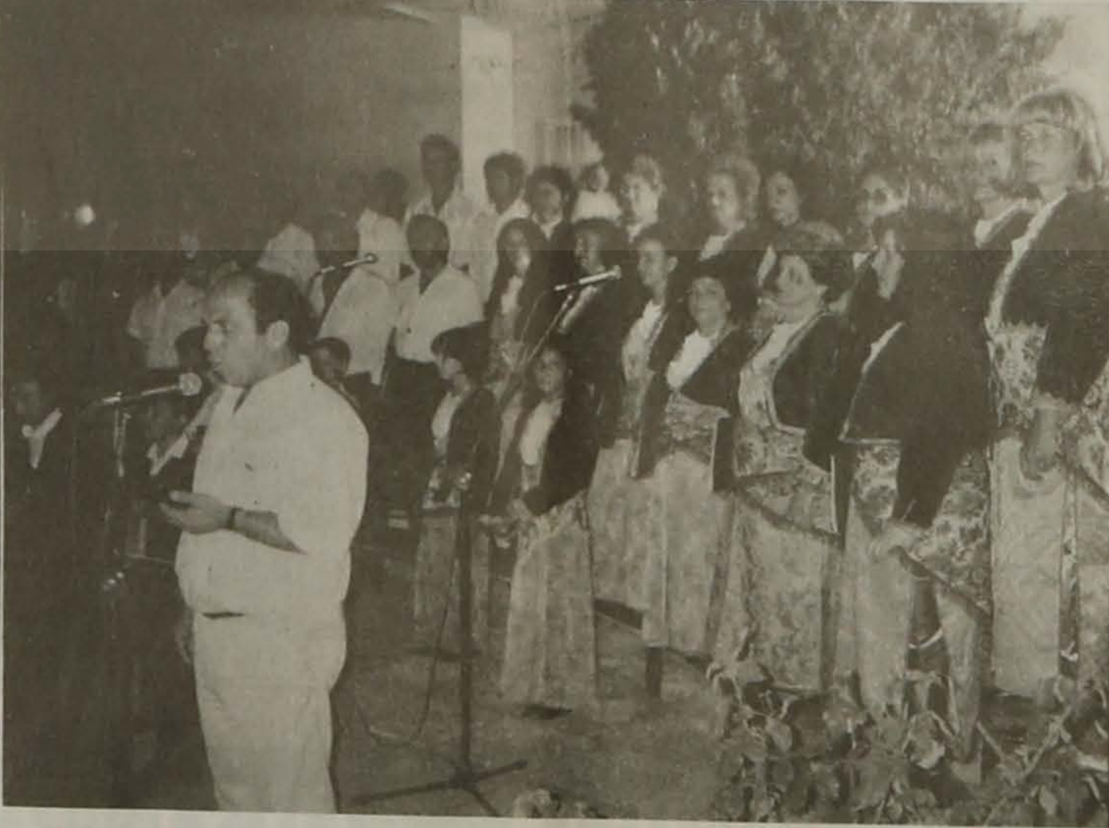
Η χορωδία της ΕΛΒ που κατενθουσίασε τους συμπατριώτες μας της Νέας Ιωνίας Βόλου.