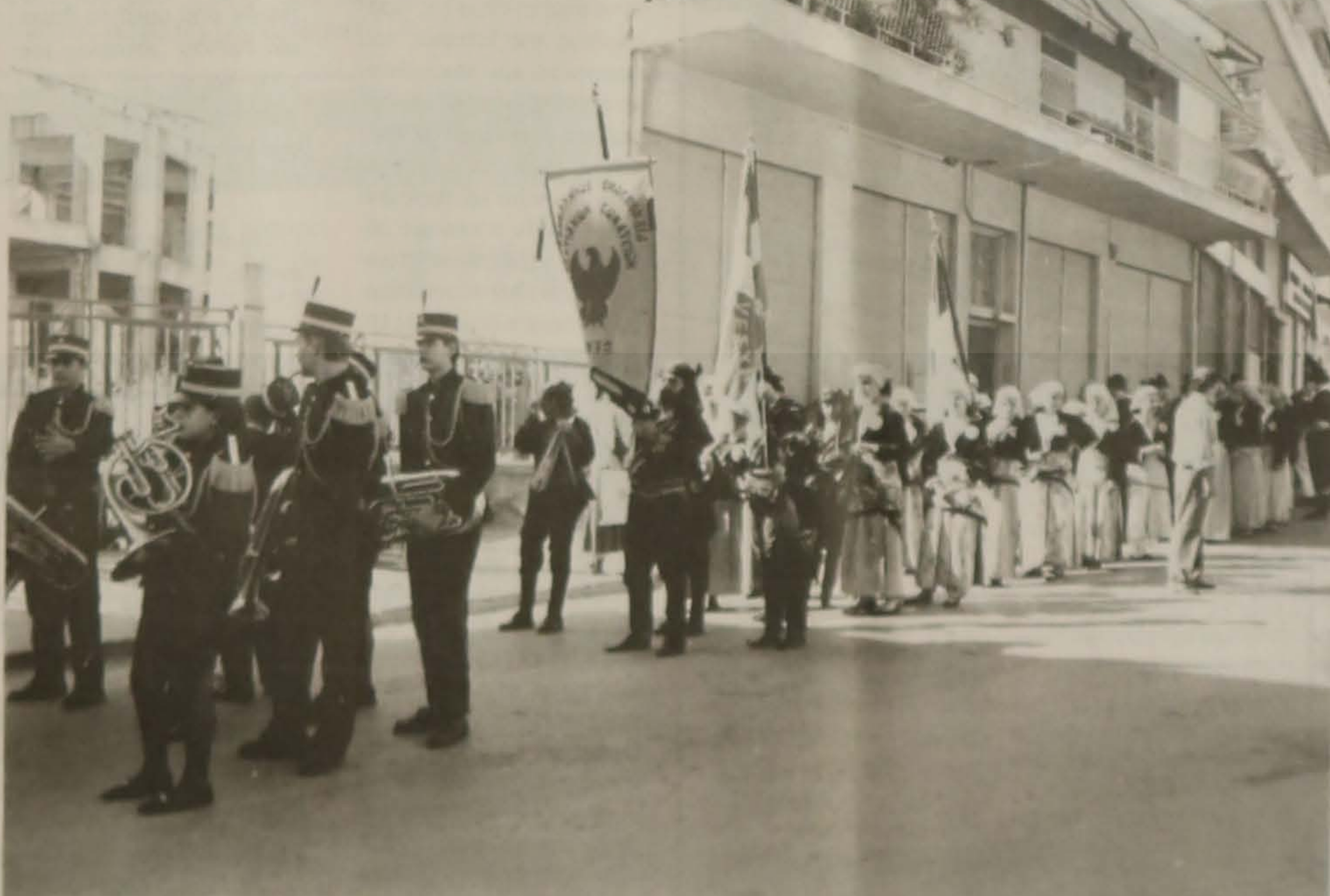
Στιγμιότυπο από την εμφάνιση της Δημοτικής Μπάντας και των παραδοσιακών τμημάτων με τις σημαίες και τα λάβαρα.

Σημειώνουμε ότι το Φεστιβάλ Ποντιακής παράδο-