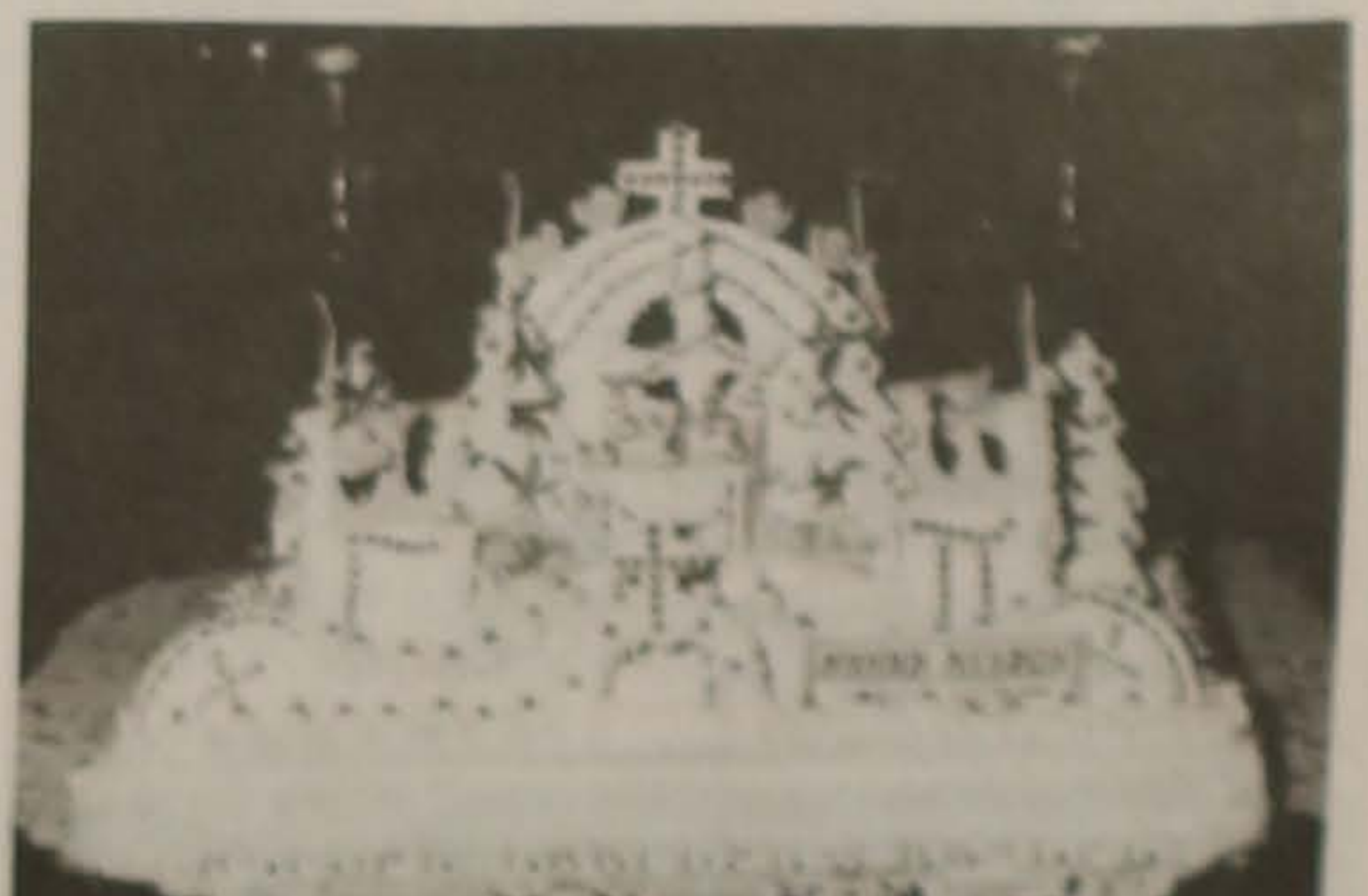
Μνήμη Νεκρών. Υπέρ αναπαύσεως της ψυχής...