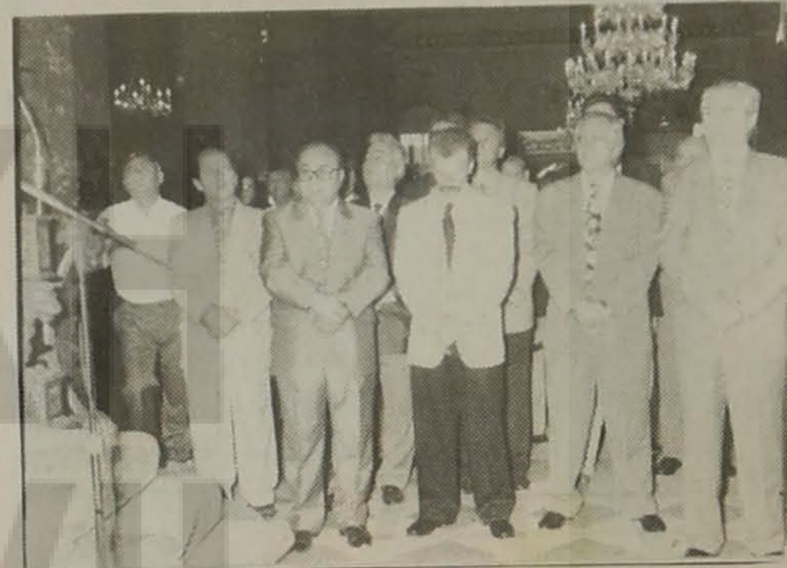
Οι επίσημοι σε άθλο πλάνο.