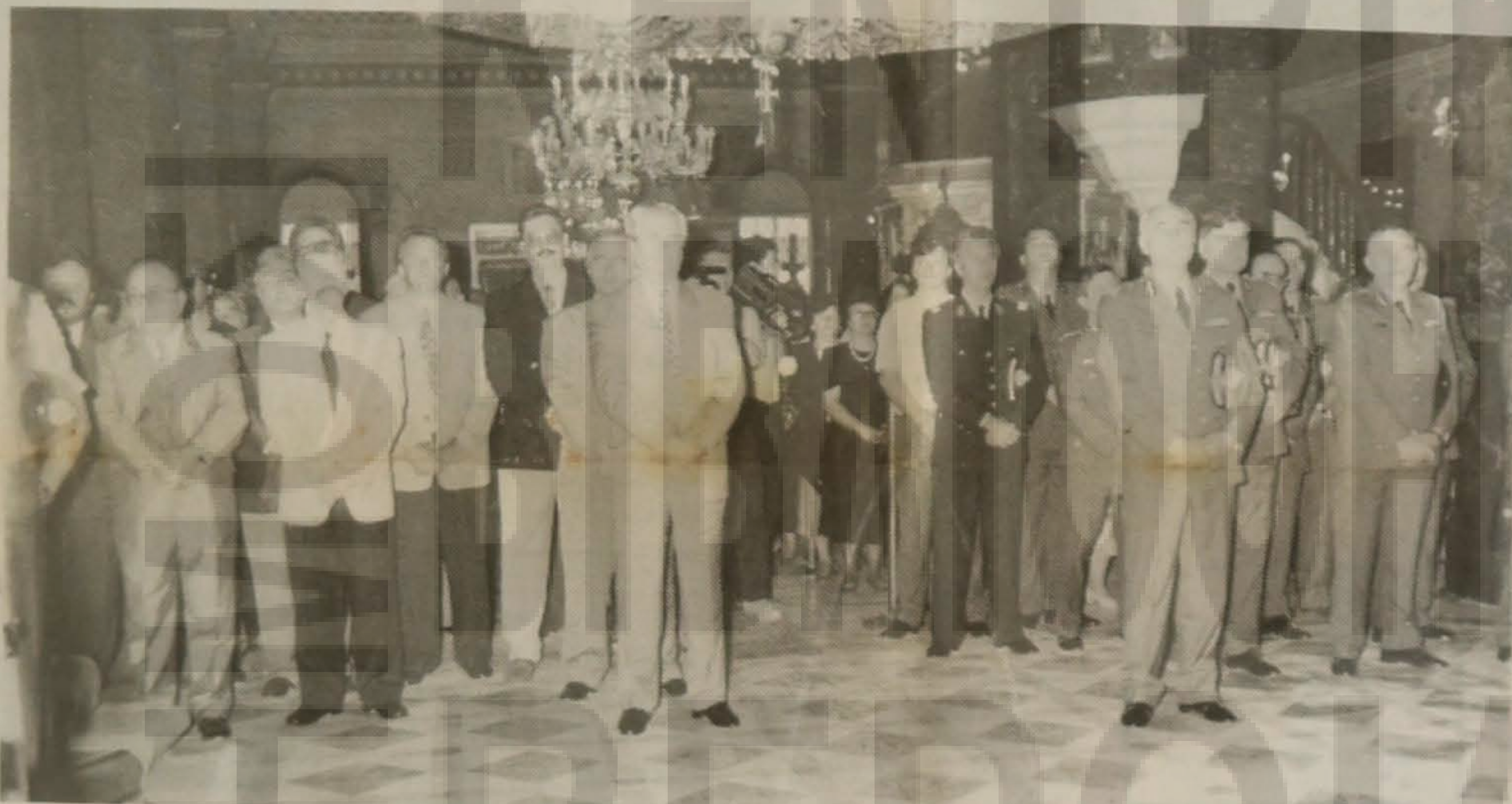
Οι επίσημοι κατά την τέλεση του μνημοσύνου.

Οι επιτυχημένες αυτές εκδηλώσεις πραγματοποιήθηκαν σε κλίμα πανηγυρικό στην ιστορική πόλη της Βέροιας, την Κυριακή 22-5-1994, με σκοπό τη διάδοση, διατήρηση, διάδοση, ανάδειξη και προβολή της πολιτιστικής μας κληρονομιάς.