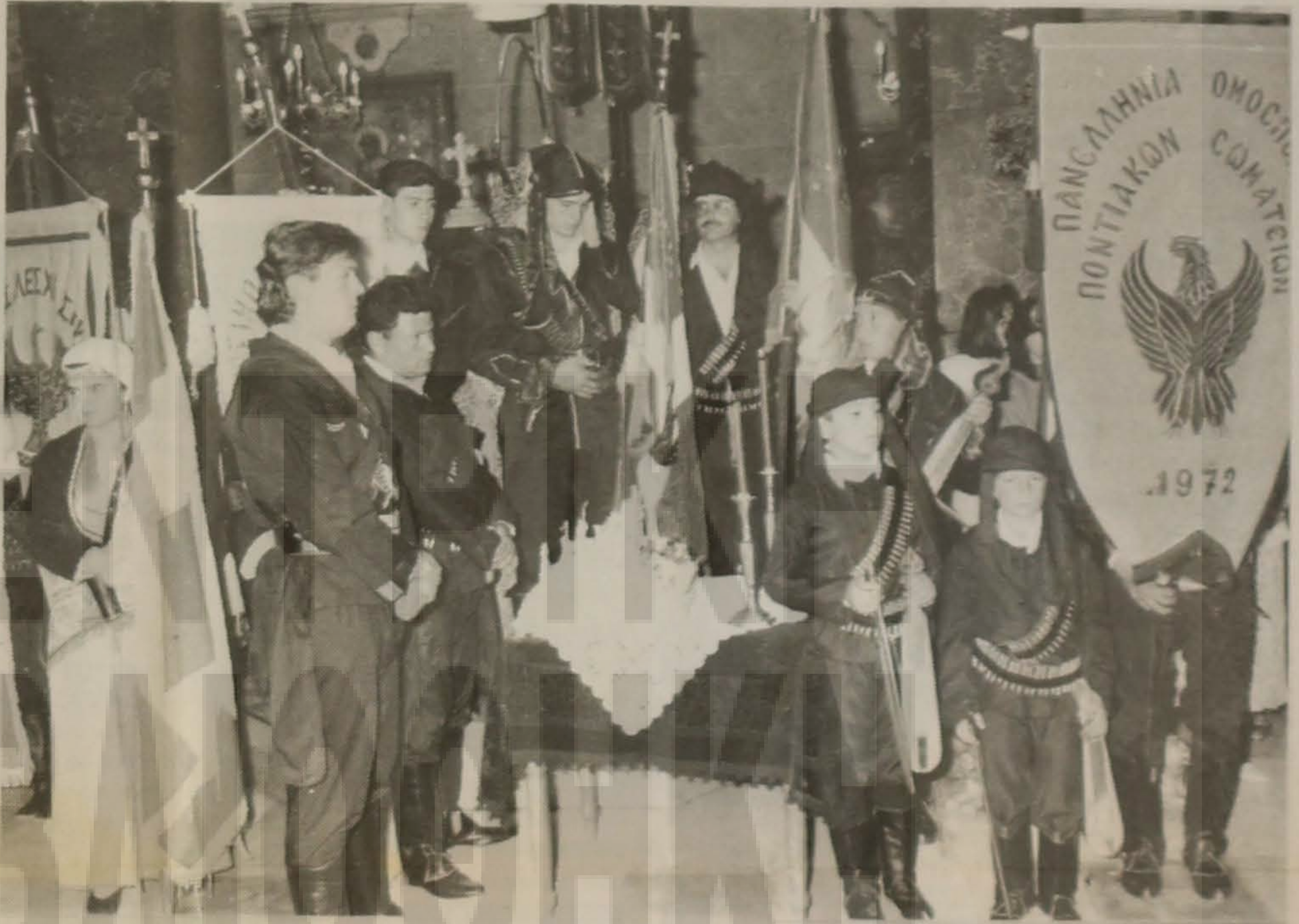
σταθμό στην ιστορία της Ελλάδας.

Σήμερα, από την ιστορική πόλη της Βέροιας ξεκινά και καθιερώνεται πλέον ένας θεσμός, που αποτελεί