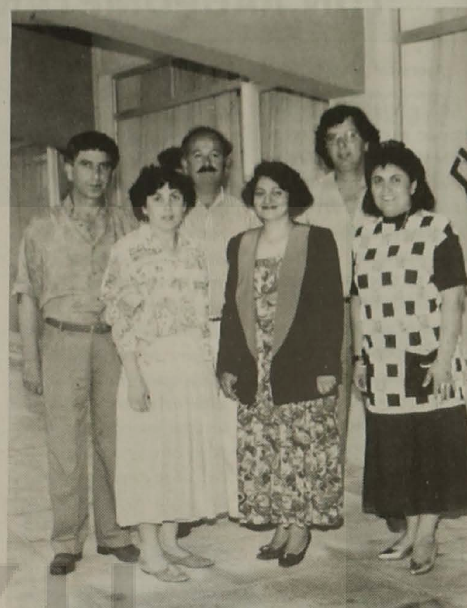
Μέλη του Δ.Σ.