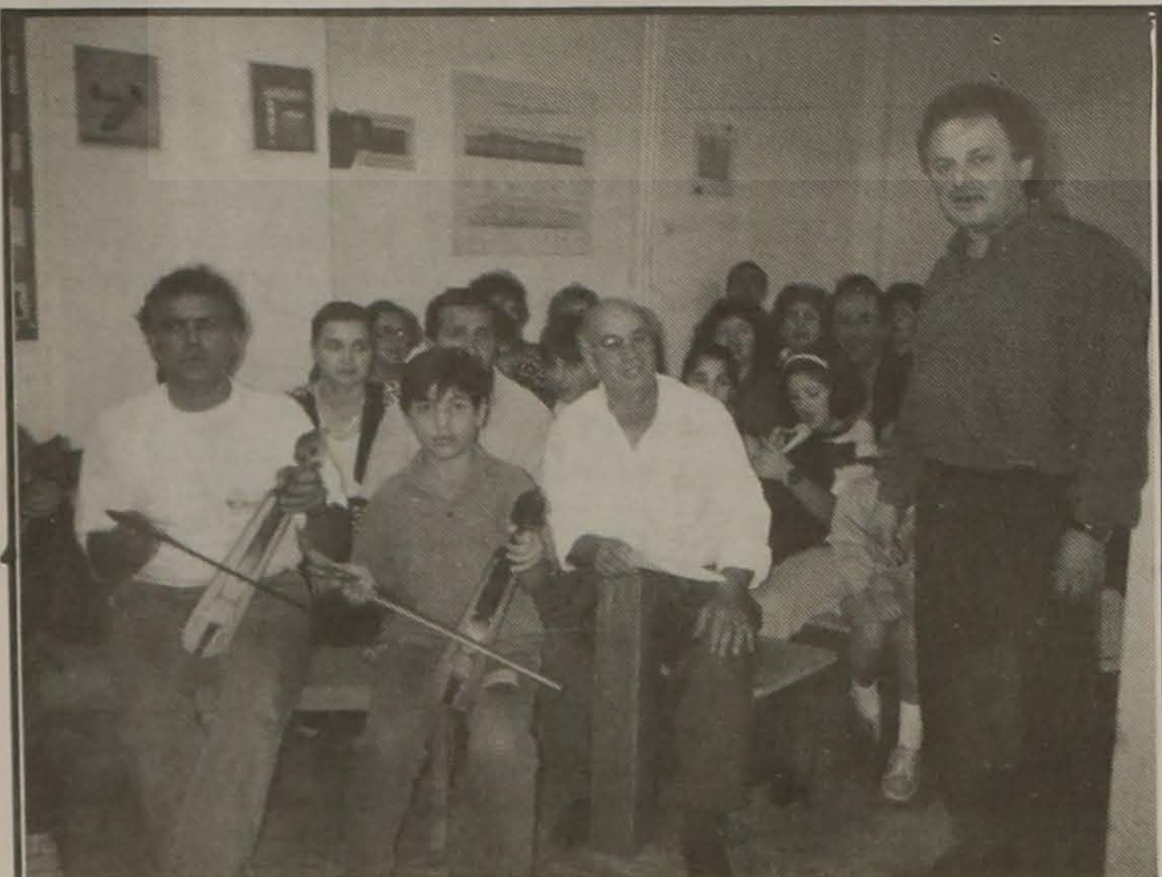
Η ώρα της χορωδίας.