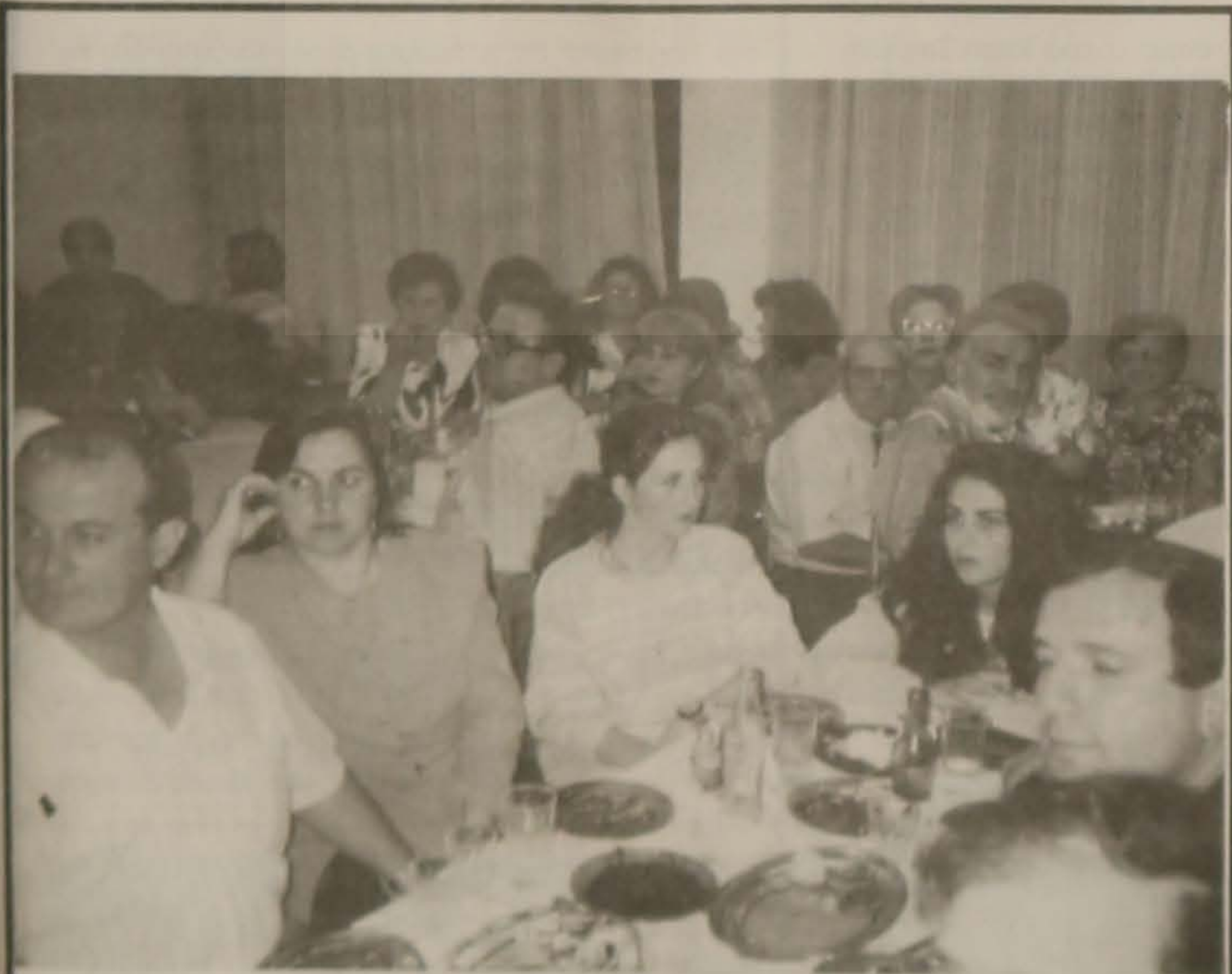
Στην ταβέρνα της Λέσχης σε κάποιες ώρες...

* Αναδημοσιεύεται από το περιοδικό "Ο Ιωάννης".