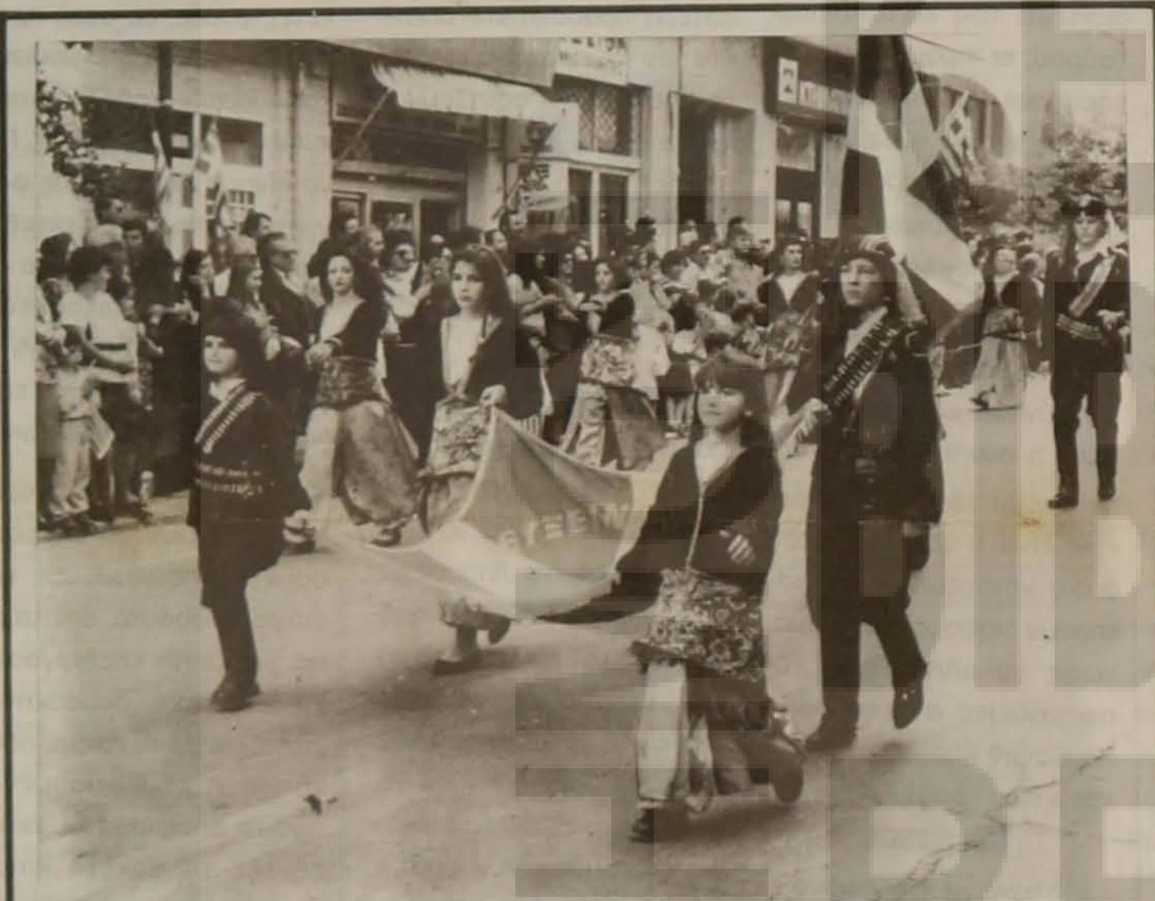
Με ιδιαίτερη λαμπρότητα γιορτάστηκε και φέτος η εθνική επέτειος της 28ης Οκτωβρίου 1940 στη Βέροια. Στην μεγάλη παρέλαση που ακολούθησε συμμετείχαν και τα Ποντιόπουλα που εντυπωσίασαν με την άσφηση εμφάνισή τους.

Κατά την διάρκεια των ει- Συνέχεια στην 3η σελ.