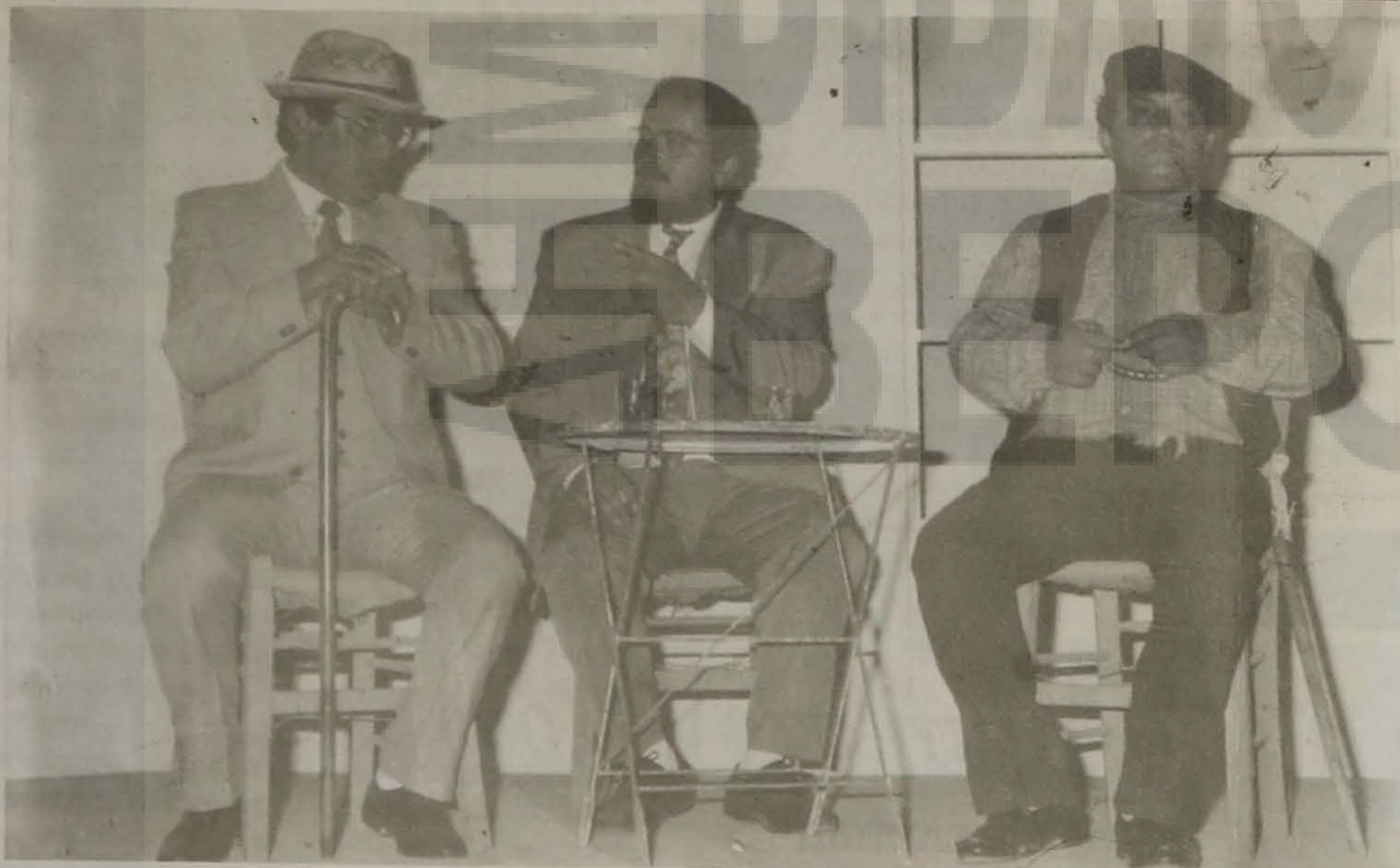
Σκηνή από το έργο.

Ένα επιτυχημένο κυριοθε- κτικά θεατρικό έργο με ά- ξιους ερμηνευτές, με θου- μάσια σκηνοθεσία, είναι κα- τά κοινή ομολογία η φαρσο- κωμωδία του Νίκου Σιδηρό- πουλου "Τέρεν και γυναί- κ' σον".