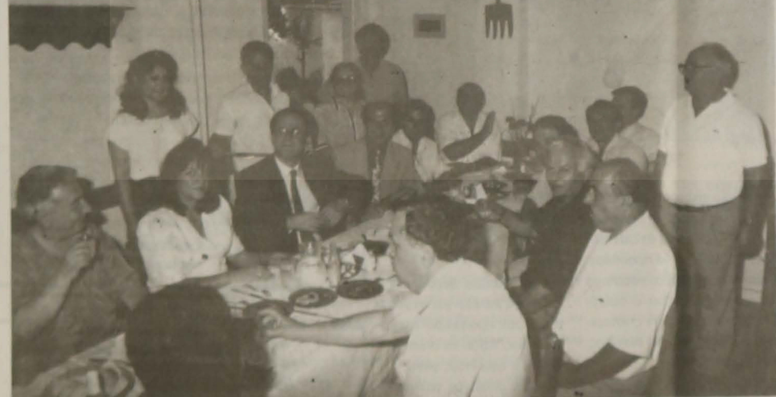
Στιγμιότυπο από τη χαρούμενη νότα της επίσκεψης του κ. υφυπουργού Εξωτερικών.

Συνέχεια από την 1η σελ. Ηες δραστηριότητες της ΕΛΒ. Μετά την ενημέρωση ακολούθησε παραδοσιακό τρα-