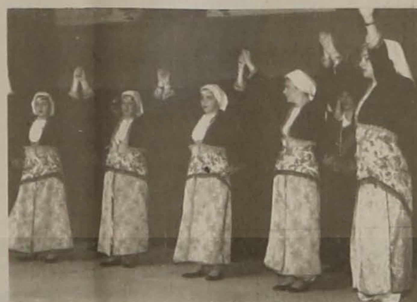
Οι Ποντιοπούλες της Ε.Λ.Β. στα Χανιά