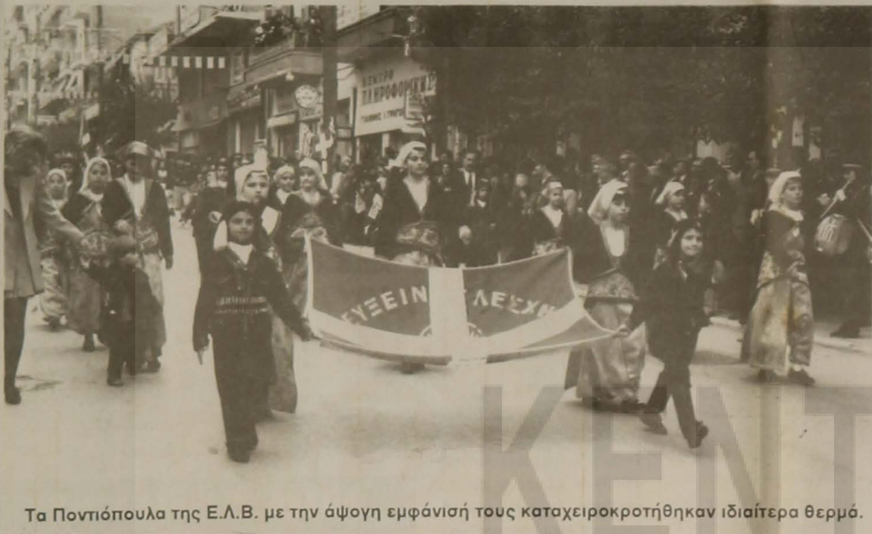
Τα Ποντιόπουλα της Ε.Λ.Β. με την άψογη εμφάνισή τους καταχειροκροτήθηκαν ιδιαίτερα θερμά.