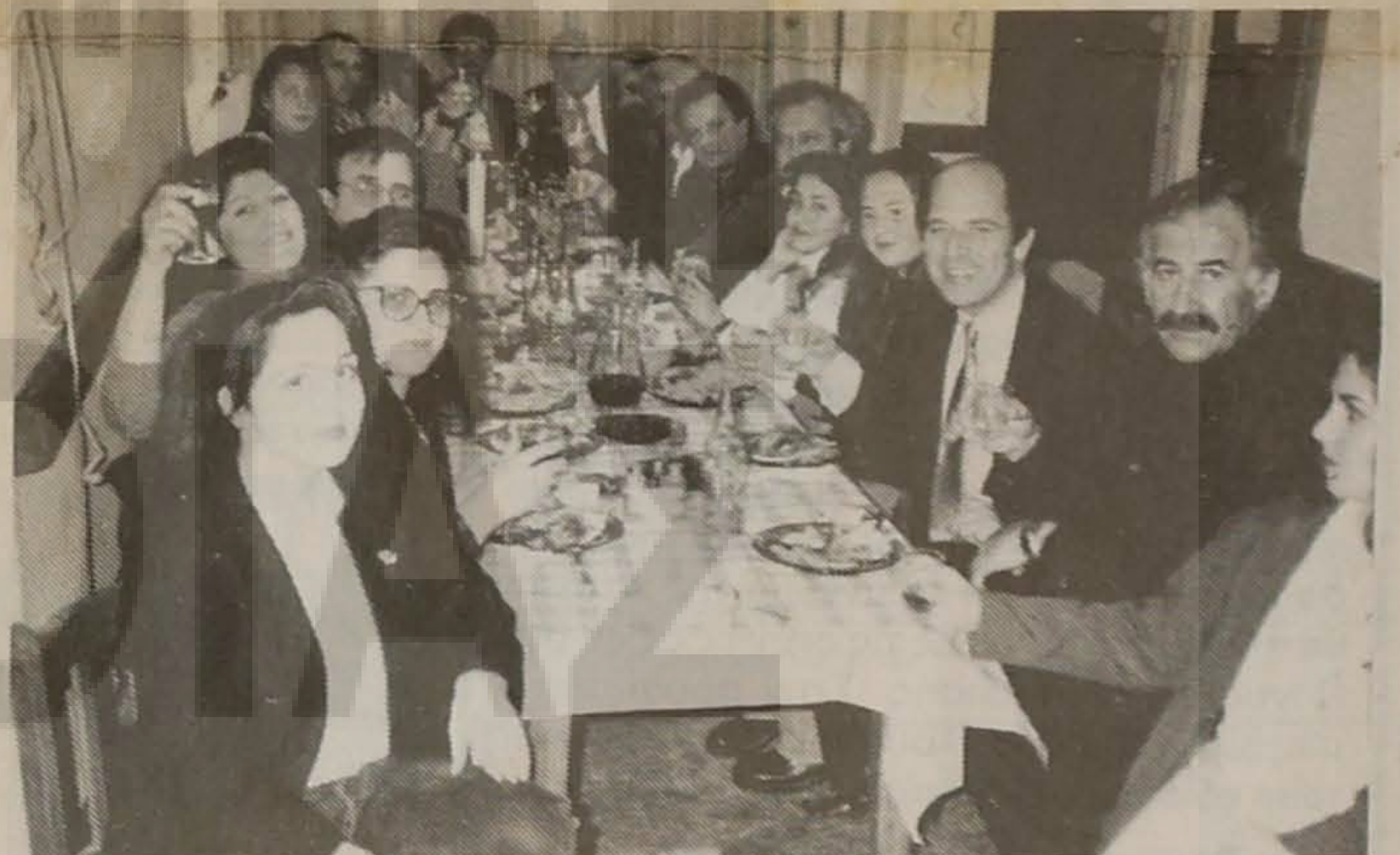
Και ο ευχάριστος επιπόλος της εκδήλωσης.