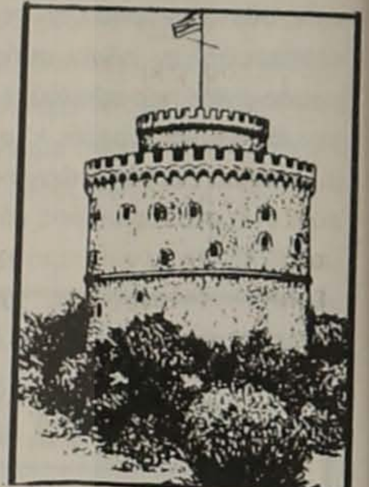
Της Μακεδονίας τα βουβά