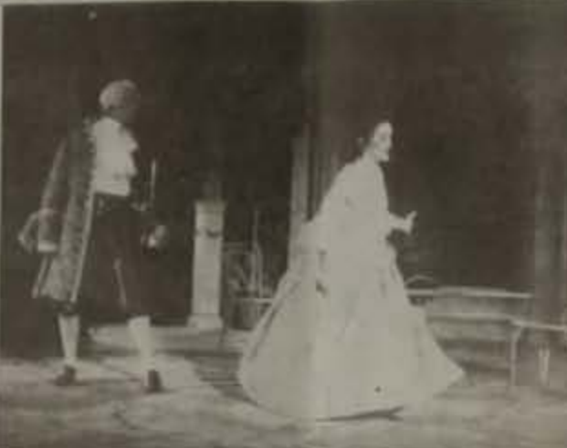
"ΦΙΛΗΣ ΜΕ ΦΙΛΙΑ" στη Βέροια (Θέατρο Αλφειών) Κυριακή 27 Αυγούστου και ώρα 9.00 το βράδυ

Μια κωμωδία καθ' όλα καλοκαμινά, ανέλαβε, κερτά, δροσική, παρουσιάζει το Δημοτικό Περιφερειακό Θέατρο Καβάλας την Κυριακή 27 Αυγούστου 1995 στη Βέροια (Θέατρο Αλφειών).