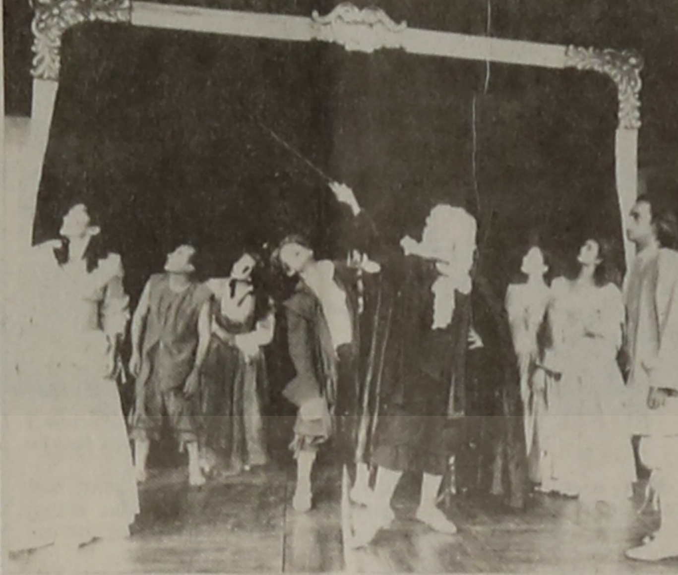
Ολοκληρώσε ο θίασος επί σκηνής κάπου στο τέλος της παραστάσεως του "ΦΙΛΑΡΓΥΡΟΥ"

ΥΠΕΡΟΧΗ ΣΚΗΝΟΘΕΣΙΑ - ΘΑΥΜΑΣΙΕΣ ΕΡΜΗΝΕΙΕΣ