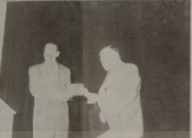
Ο Δήμαρχος Βεργίας κ. Γιάννης Κασιώτης την στιγμή που απονέμει το Χρυσό Μετάλλιο της πόλης στον Υπουργό Πολιτισμού κ. Θάνο Μικραεταίο