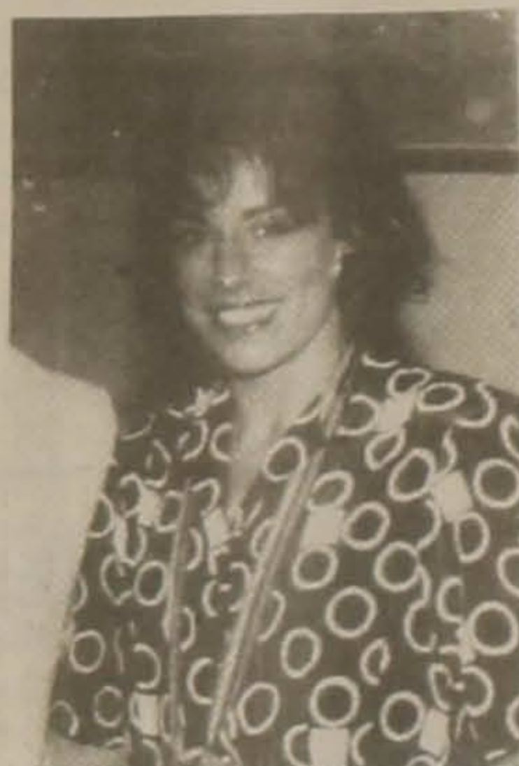
κωσα τα βάρη. Να! "για την Ελλάδα", ήταν οι μεγάλες εκείνες στιγμές.

Η γενναία ελληνική ψυχή της Πόντιας Βούλας Πατουλίδου τίμησε την Ελλάδα στους 25 Ολυμπιακούς Αγώνες της Βαρκελώνης. Τα χρυσά μετάλλια της Βούλας Πατουλίδου και του Πύρρου Δήμα, αλλά και οι διακρίσεις του Βαθέριου Λεωνίδα, του Παύλου Σαητοΐδη, του Παναγιώτη Ποικαλίδη, της Μαρίας Σανσαοφίδου, της Αρετής Σιναπίδου και της Χριστίνας Θαλασσινίδου και του Κώστα Κουκουδλήμου, έδωσαν την πιο μεγάλη χαρά σ' όλους τους Έλληνες. Ήταν η νίκη του ελληνικού αθλητισμού, ήταν "για την Ελλάδα" όπως ανέκραξε ο Ολυμπιονίκης Πύρρος Δήμας, όταν σή-