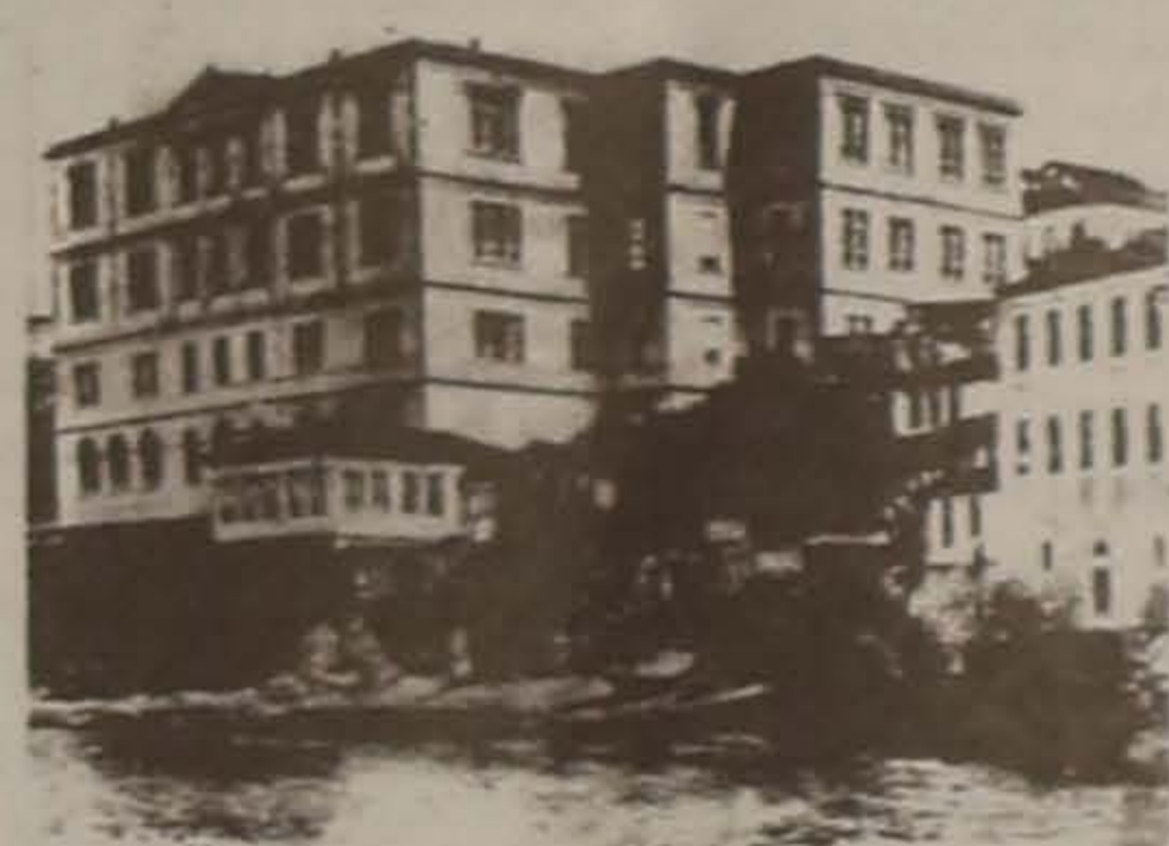
Το Φροντιστήριο Τραπεζούντας όπως φαίνεται από τη θάλασσα