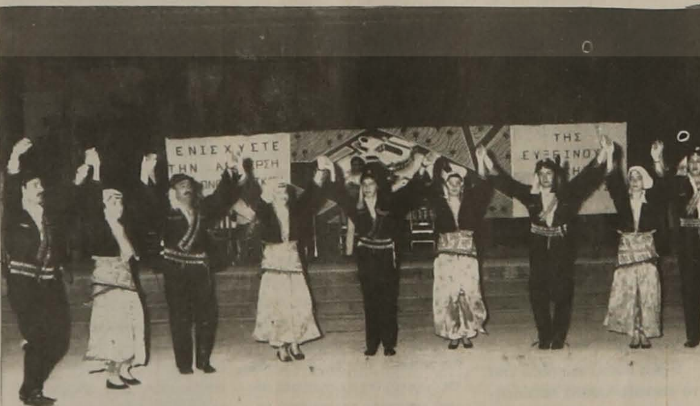
Τμήμα από το υπέροχο χορευτικό συγκρότημα της ΕΛΒ που συνεχίζει την υπέροχη ποντιακή παράδοση. Η εμφάνισή του δημιουργεί συγκίνηση και χαρά.

Οι ενδιαφερόμενοι παρακαλούνται να στέλνουν ένα αντίτυπο του βιβλίου ή του περιοδικού τους για τον παραπάνω σκοπό.