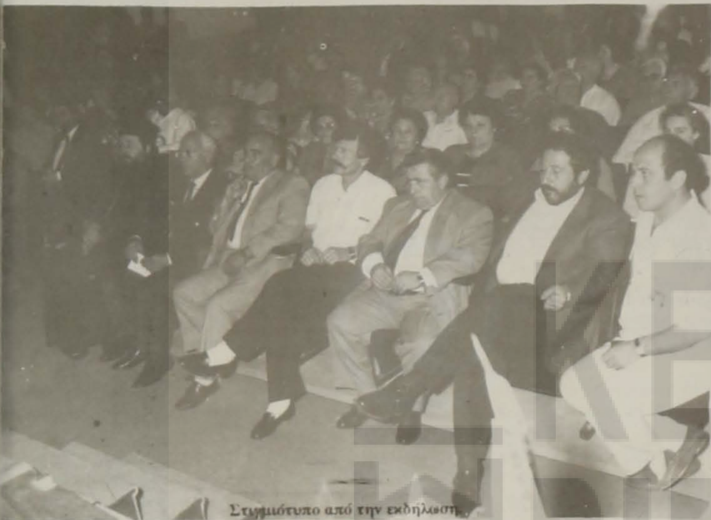
Στημύτιλο από την εκδήλωση.

Στα πλαίσια του Γ Παγκοσμίου Συνεδρίου του Ποντιακού Ελληνισμού με ιδιαίτερη επιτυχία πραγματοποιήθηκε η Ε.Λ.Β. στις 12 Μαΐου στην Ανεξαρτησία Στέγη Γραμμάτων και Τέχνων Πνευματική και Καλλιτεχνική εκδήλωση.