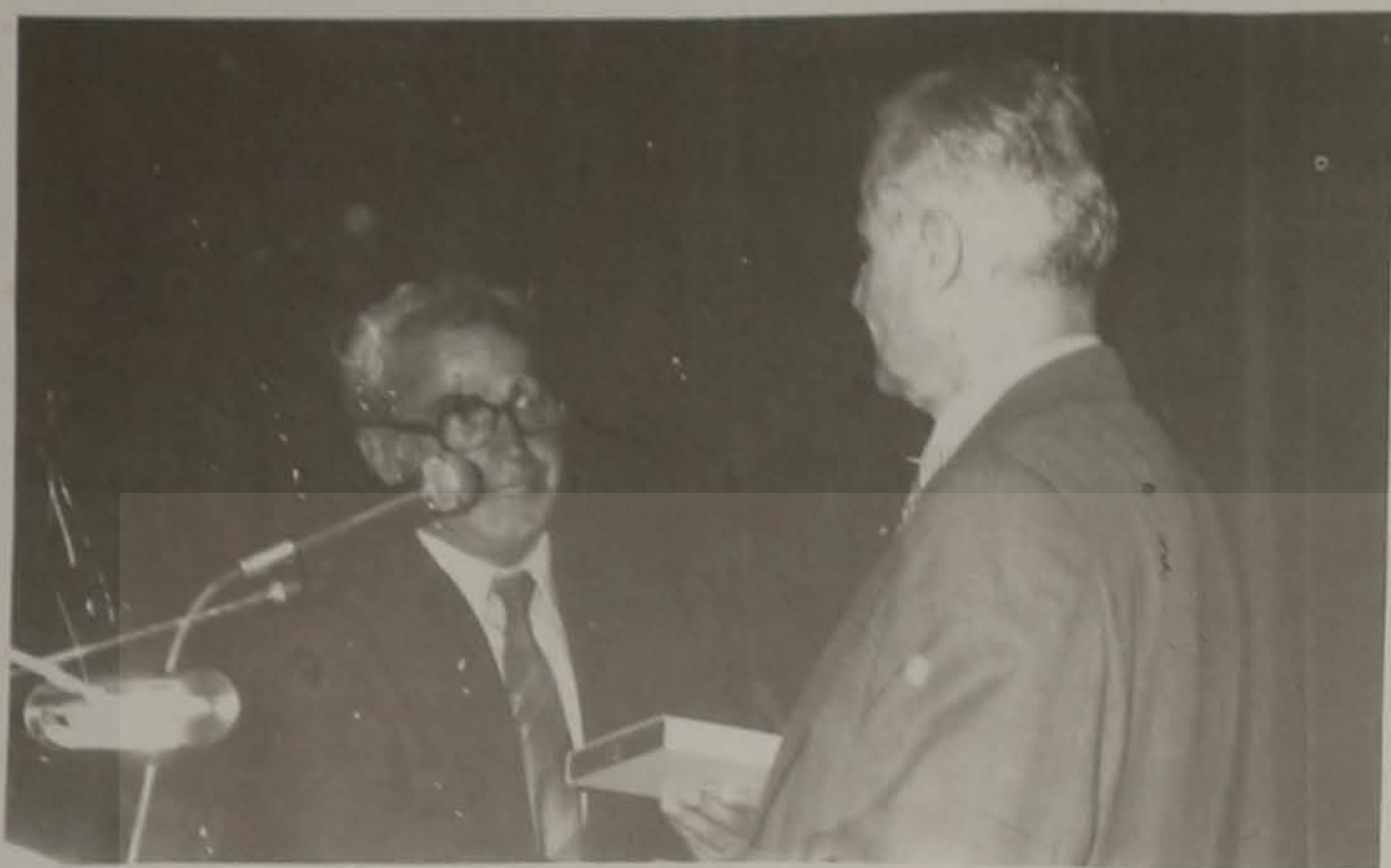
Ο Πρόεδρος του Δ.Σ. της Ε.Λ.Β. κ. Γιάννης Μελετιδής ενώ επιδίδει τιμητική πλακέτα στον πρόεδρο της Οργανωτικής Επιτροπής του Γ' Παγκόσμιου Συνεδρίου Ποντιακού Ελληνισμού π. Υπουργό κ. Βασίλειο Ιντζέ.