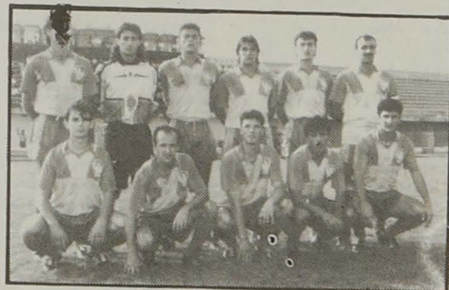
Η Α.Ε.Π. Βέροιας η οποία όπως δείχνουν τα πράγματα από τη νέα ποδοσφαιρική περίοδο θα αγωνίζεται στο πρωτάθλημα της Β' Εθνικής. Μένουν ακόμη δύο αγωνιστικές και η Ποντιακή Ταξιαρχία θέλει 3 βαθμούς για να ανακρουηθεί πρωταθλήτρια στο βόρειο όμιλο της Γ' Εθνικής.