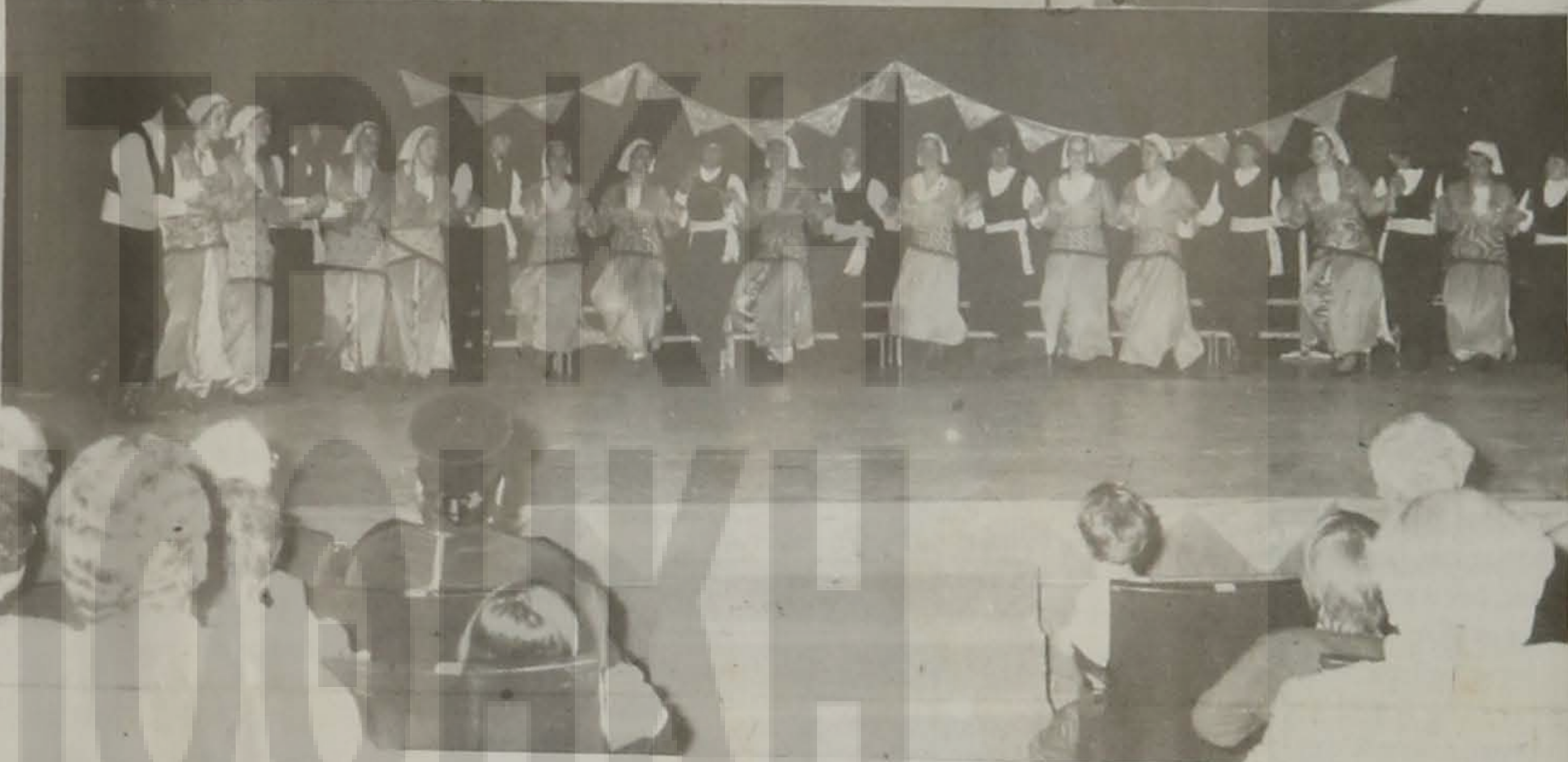
Τα χορευτικά συγκροτήματα της Ε.Λ.Β. και της Ένωσης Ποντίων Πολίχνης που με επιτυχία συμμετείχαν στην εκδήλωση.