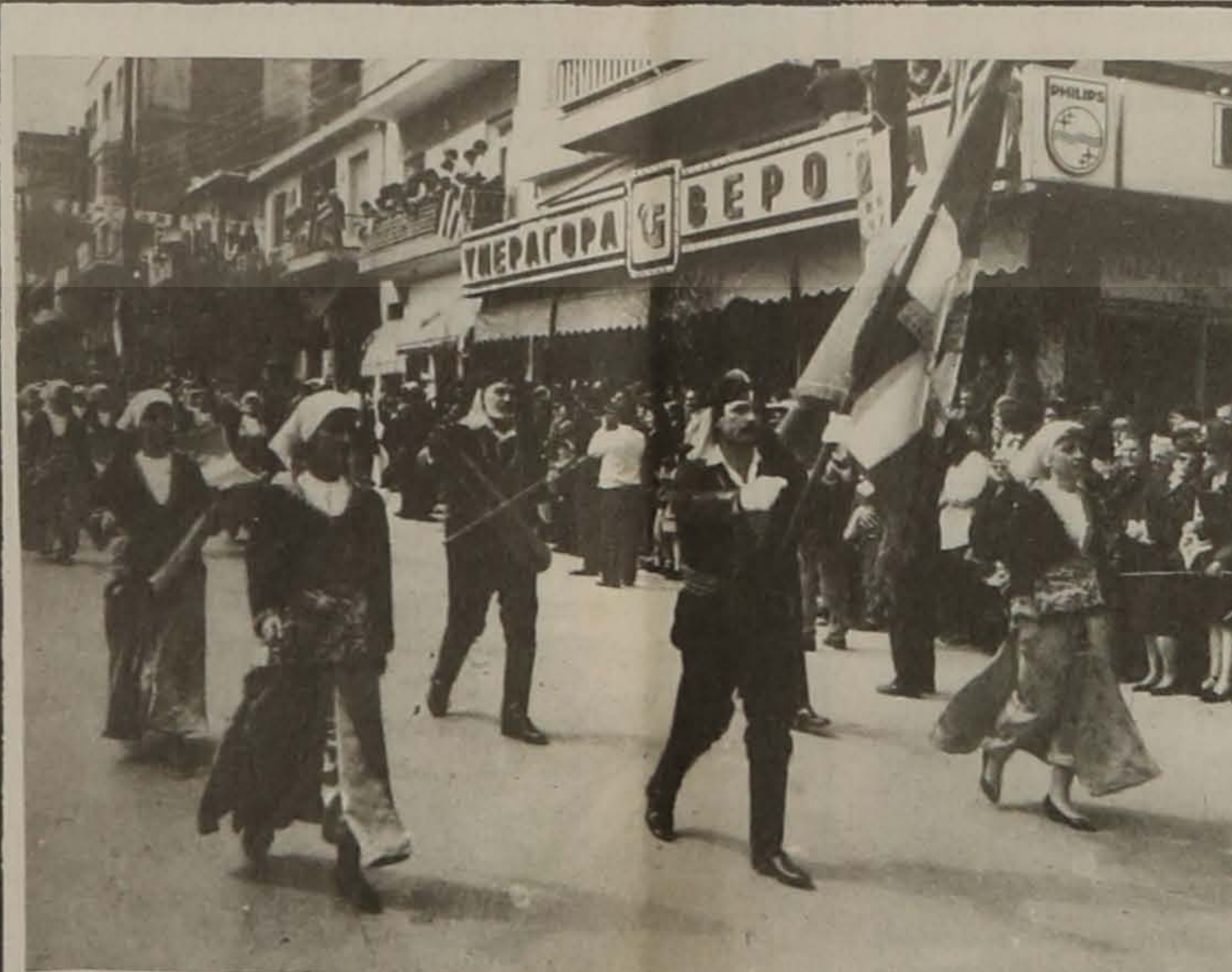
Στημιότυπο από την παρέλαση της 25ης Μαρτίου. Τα τμήματα της παρέλασης της ΕΛΒ με την άψογη εμφάνισή τους προκάλεσαν τα ενθουσιώδη χειροκροτήματα του κοινού της Βέροιας.

μετρική σατιρική των Κοτύρων, 1911 - 1913, Ανδρ. Μουτάφης