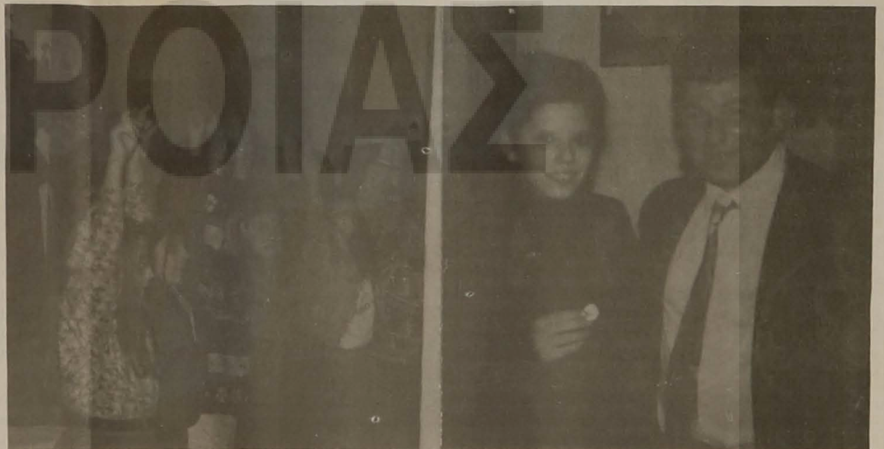
Το νέο φυτρωίο σε εντυπωσιακή εμφάνιση κατά την τελετή του κοψίματος της βασιλόπιτας