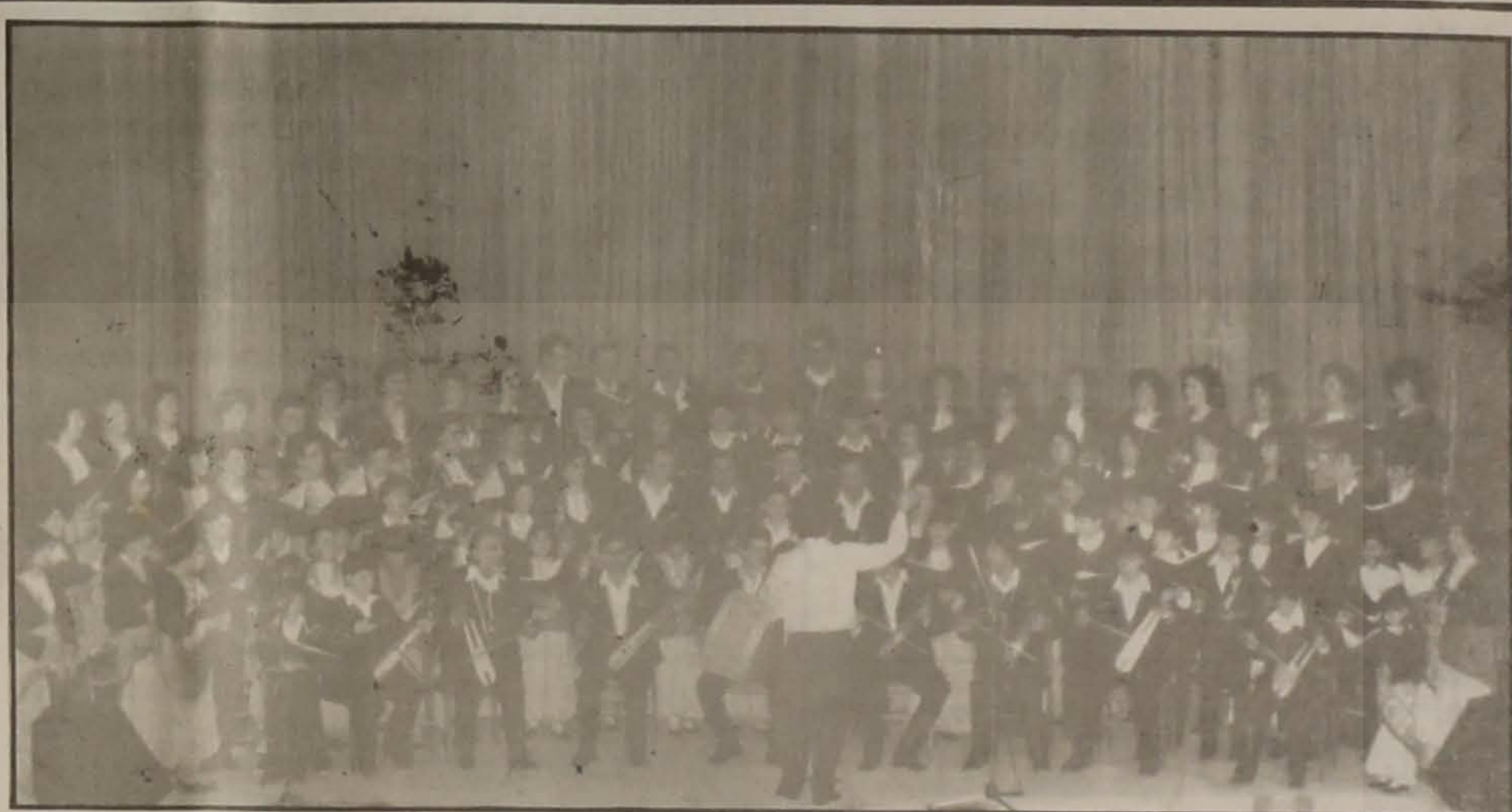
Εμφάνιση στις εκδηλώσεις "Λαϊκός Χειμώνας" θα κάνει η χορωδία της Ε.Λ.Β., ύστερα από σχετική πρόσκληση. Οι εκδηλώσεις θα πραγματοποιηθούν την Κυριακή 20-12-92 στο Πανεπιστήμιο Θεσσαλονίκης και τελούν υπό την διεύθυνση του Γιώργου Μελίκη.