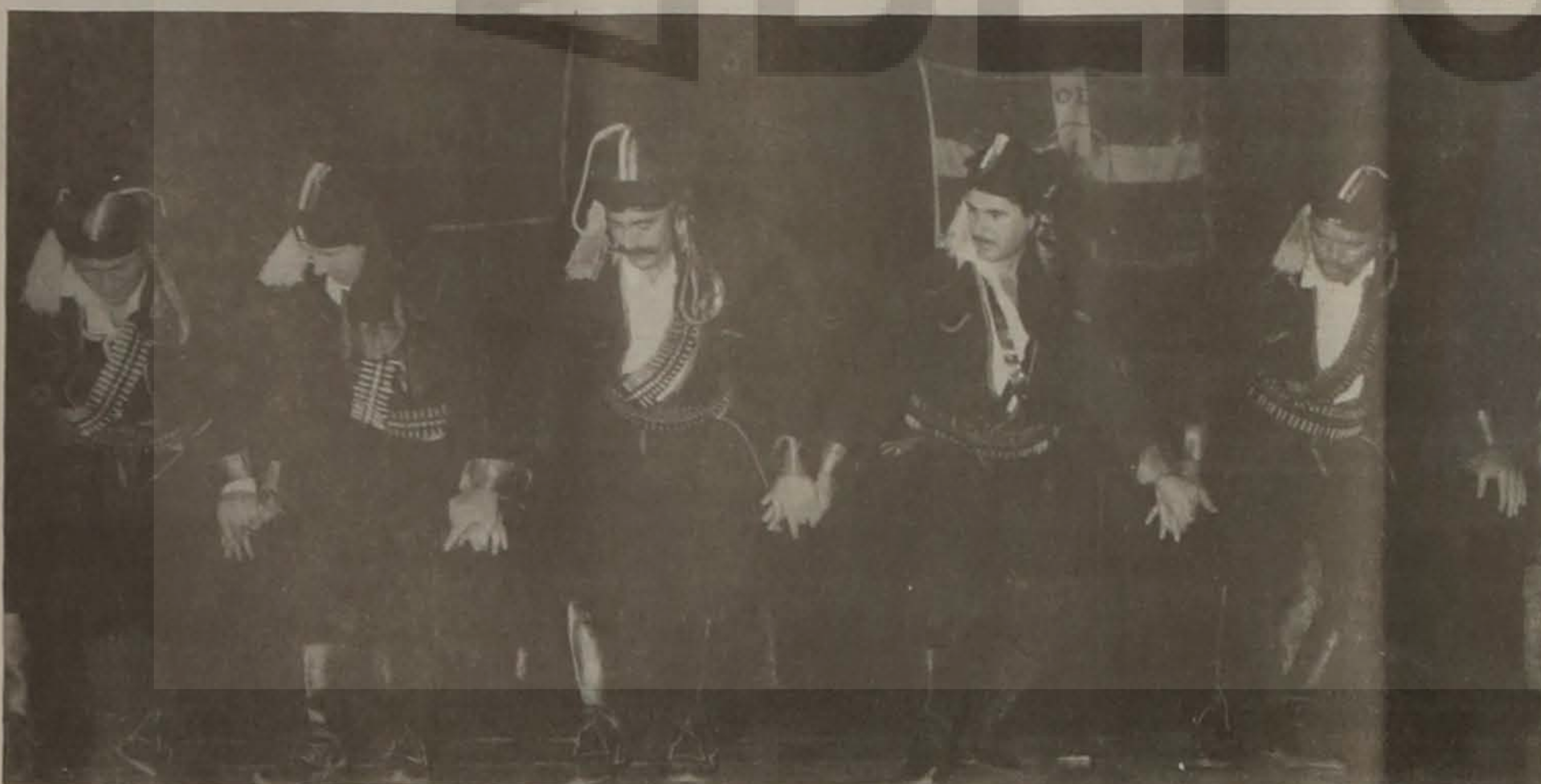
Φωτογραφικό στιγμιότυπο από την επίδειξη του χορευτικού συγκροτήματος της Ε.Λ.Β. κατά την διάρκεια της πνευματικής εκδήλωσης για την Μακεδονία που διοργάνωσε η Ε.Λ.Β.