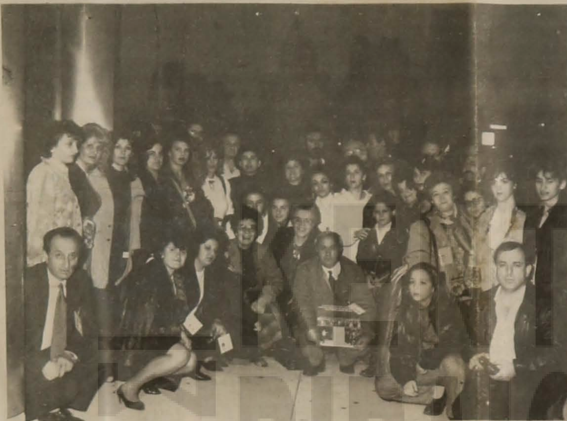
Στη φωτογραφία τα μέλη της Χορωδίας που συμμετείχαν στην αποστολή.