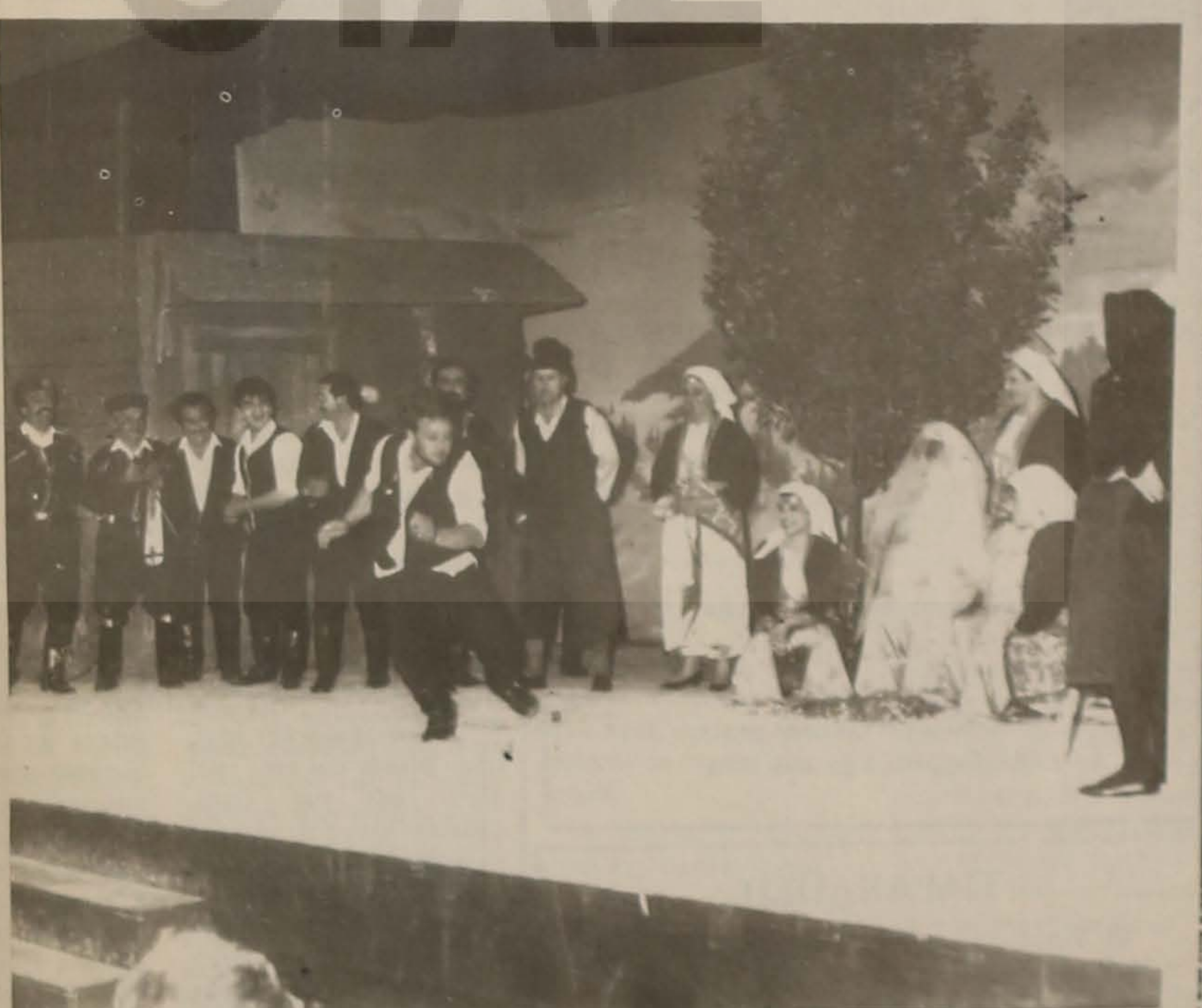
Σκηνές από το ηθογραφικό έργο του αείμνηστου Φίλωνα Κτενίδη, "Ο Κλήδονας", που όπως γράναμε και στο προηγούμενο φύλλο του "Αργοναύτη", ερμηνεύθηκε με αφάνταστη επιτυχία από τη θεατρική ομάδα της Ευξείνου Λέσχης Βέροιας, στις 26 Μαΐου 1991 στην κατάμεστη αίθουσα της Αντωνιάδου Στέγης Γραμμάτων και Τεχνών του Δήμου Βέροιας.