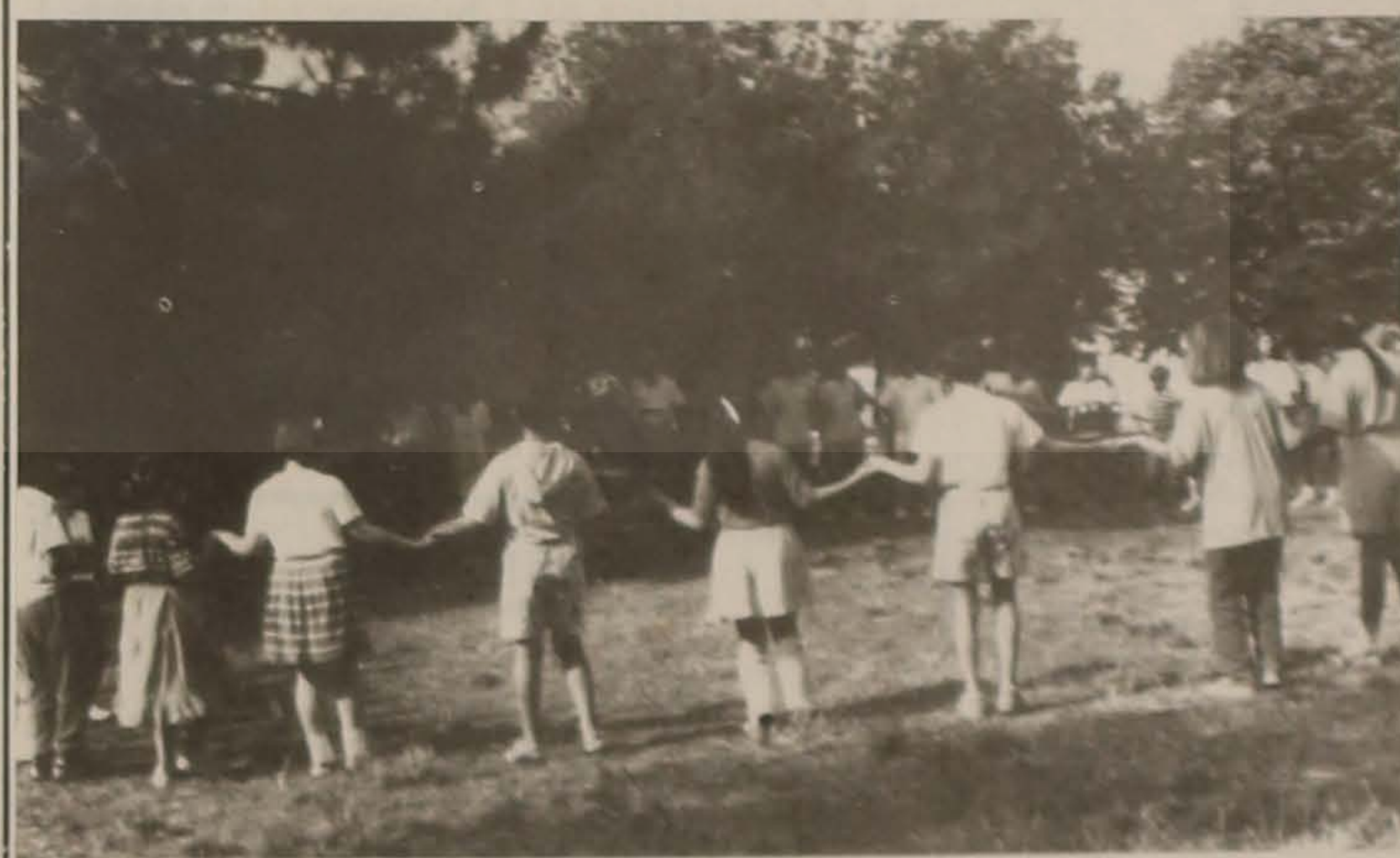
Η ώρα του παιχνιδιού

Από τις 5/7 έως τις 15/7/91 λειτούργησαν οι παιδικές κατασκηνώσεις της Ευξείνου Λέσχης Βέροιας στο Κωστόχωμι Βέροιας. Τα παιδιά που ήρθαν από τη Σοβ. Ένωση μαζί με τα άλλα παιδιά των μελών της Λέσχης πέρασαν ένα ευχάριστο και ωφέλιμο δεκα-