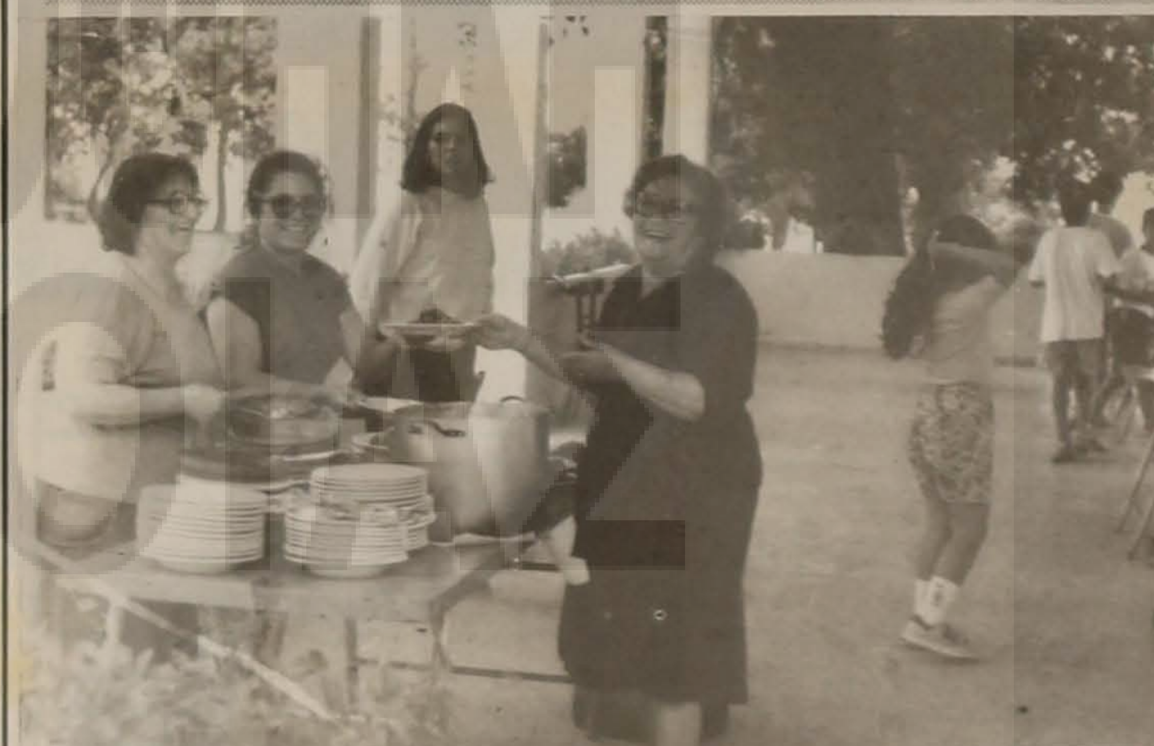
Ετοιμο το γεύμα.