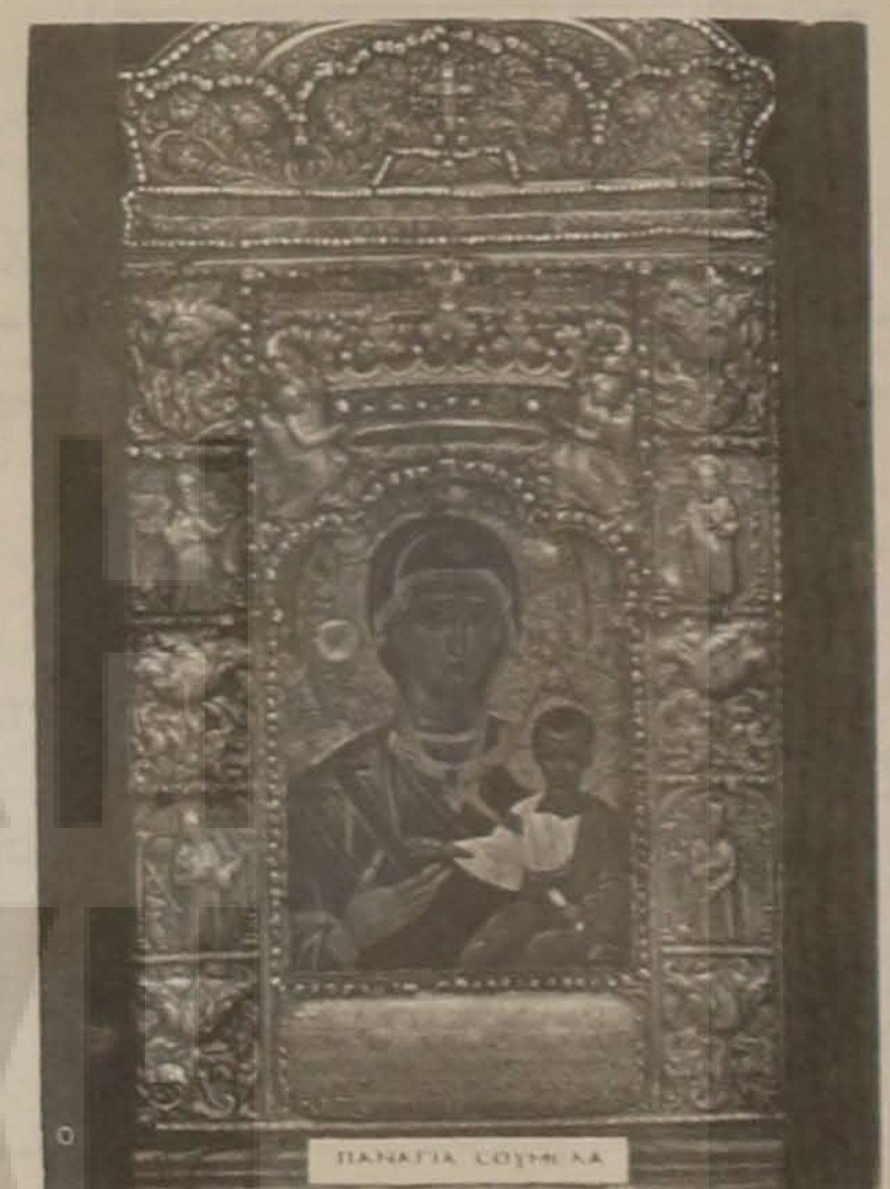
"Χαίρε του Θεού η Μητηρ, χαίρε των Ελλήνων η μάνα, χαίρε του Πόντου η Παντάνασσα! χαίρε Παναγία Σουμελά!"

χθεί ότι, η απόφαση της Διοίκησης της Π.Ο.Π.Σ. να πραγματοποιήσει συνεδρίασή της εκτός έδρας, ήταν ιδιαίτερα χρήσιμη και επίκαιρη, καθώς τα προβλήματα που απασχολούν τα Ποντιακά Σωματεία είναι πολλά και απαιτείται η από κοινού ενημέρωση και συνεργασία.