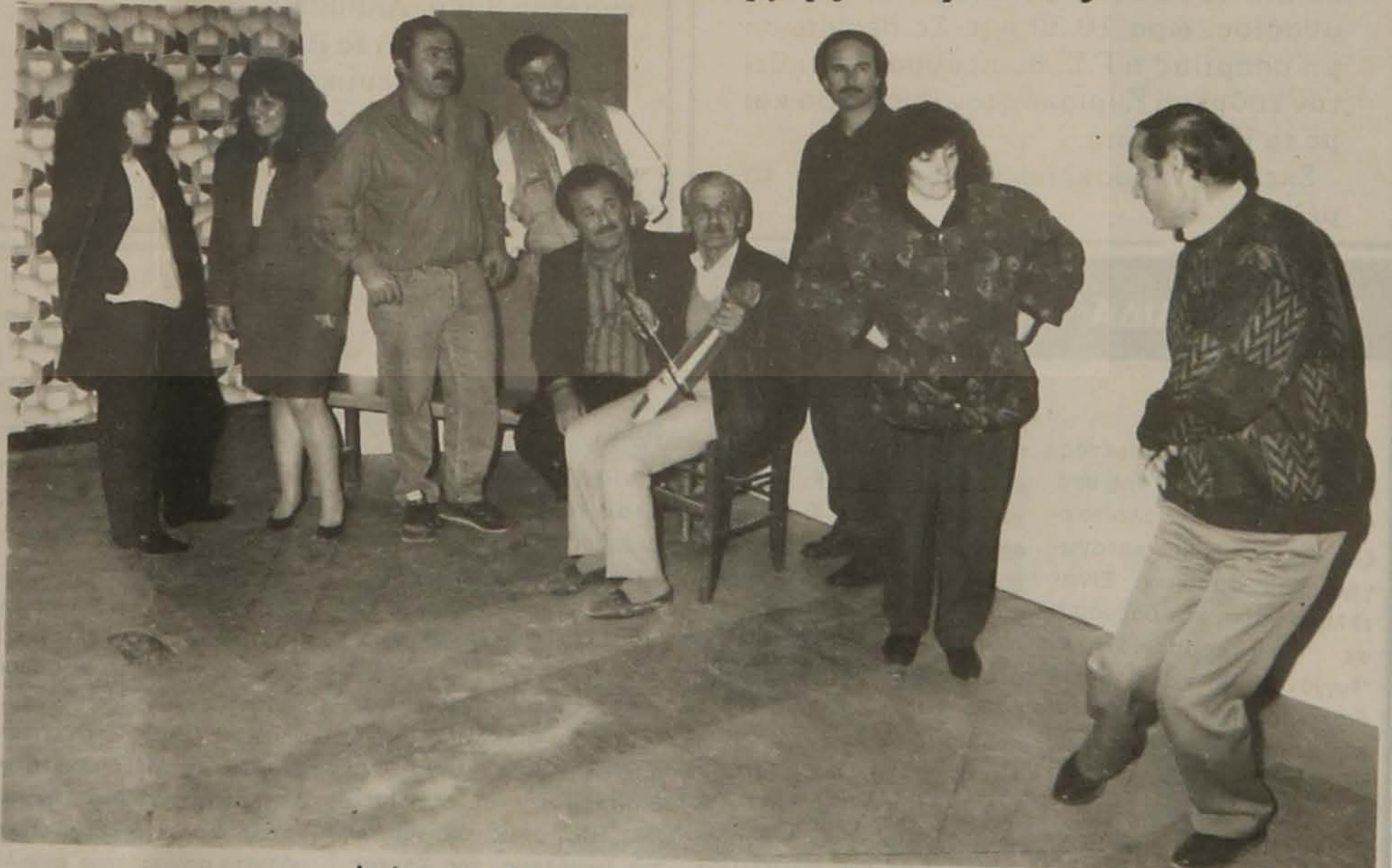
Από τις πρόβες του θεατρικού έργου "Ο Κληδωνάς"

Όπως αναγγείλαμε και στο προηγούμενο φύλλο μας, ολοκληρώνονται πια οι πρόβες για το ανέβασμα του θεατρικού έργου του Φίλιππου Κτενίδη "Ο Κληδωνάς". Σύντομα αναμένεται να ανακοινωθεί η ημερομηνία της παράστασης. Αξίζει να σημειωθεί ότι το θεατρικό τμήμα της Ε.Λ.Β. συμβάλλει αποφασιστικά στην αποκάλυψη και διατήρηση του παραδοσιακού ποντιακού πολιτισμού και γι' αυτό θα πρέπει να αγκαλιαστεί από όλους μας.