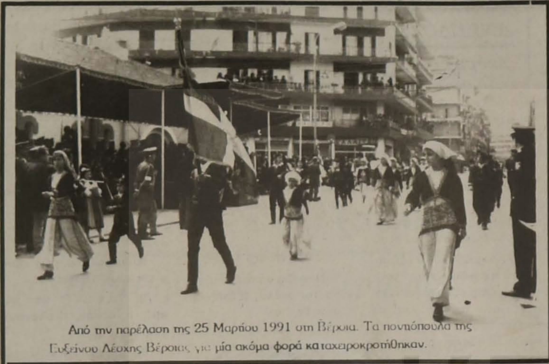
Από την παρέλαση της 25 Μαρτίου 1991 στη Βέροια. Τα ποντιόπουλα της Ευξεινού Λέσχης Βέροιας για μία ακόμα φορά κα ταχειροκροτήθηκαν.