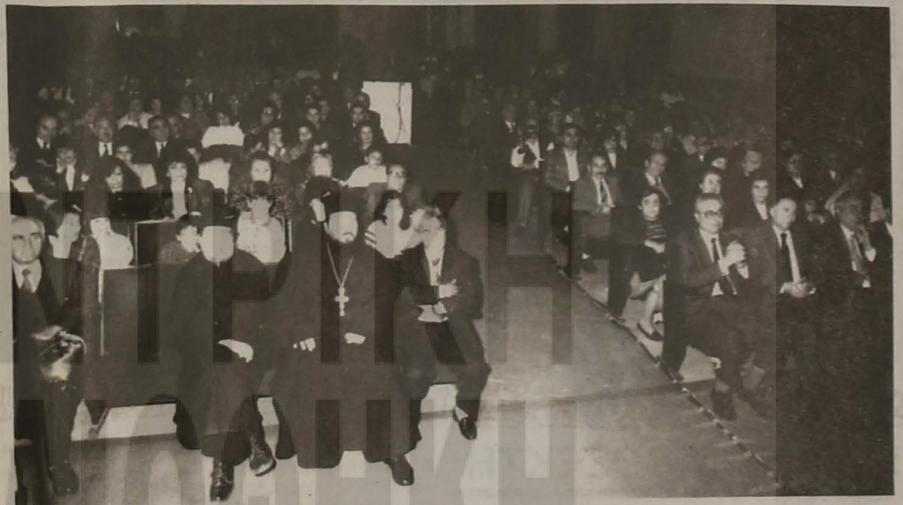
Ενα μέρος του ακροατηρίου που παρακολούθησε την εκδήλωση, επιτυχημένη γιορταστική εκδήλωση για την εθνική παλιγεννεσία του 1821.

ΠΡΑΓΜΑΤΟΠΟΙΗΘΗΚΕ ΑΠΟ ΤΗΝ ΕΥΞΕΙΝΟΥ ΛΕΣΧΗ ΒΕΡΟΙΑΣ ΓΙΑ ΤΗΝ ΕΘΝΙΚΗ ΕΠΑΝΑΣΤΑΣΗ ΤΟΥ 1821