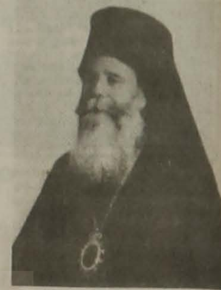
Το 1936 μας χάρισε ένα ογκώδες σύγγραμμα σε δύο τόμους, το "Αρχαίον Πόντου" για την Εκκλησία της Τραπεζούντος.

Απεδήμησε εις Κύριον την 28 Σεπτεμβρίου 1949. Η καρδιά του πάντα έμεινε στον Πόντο.