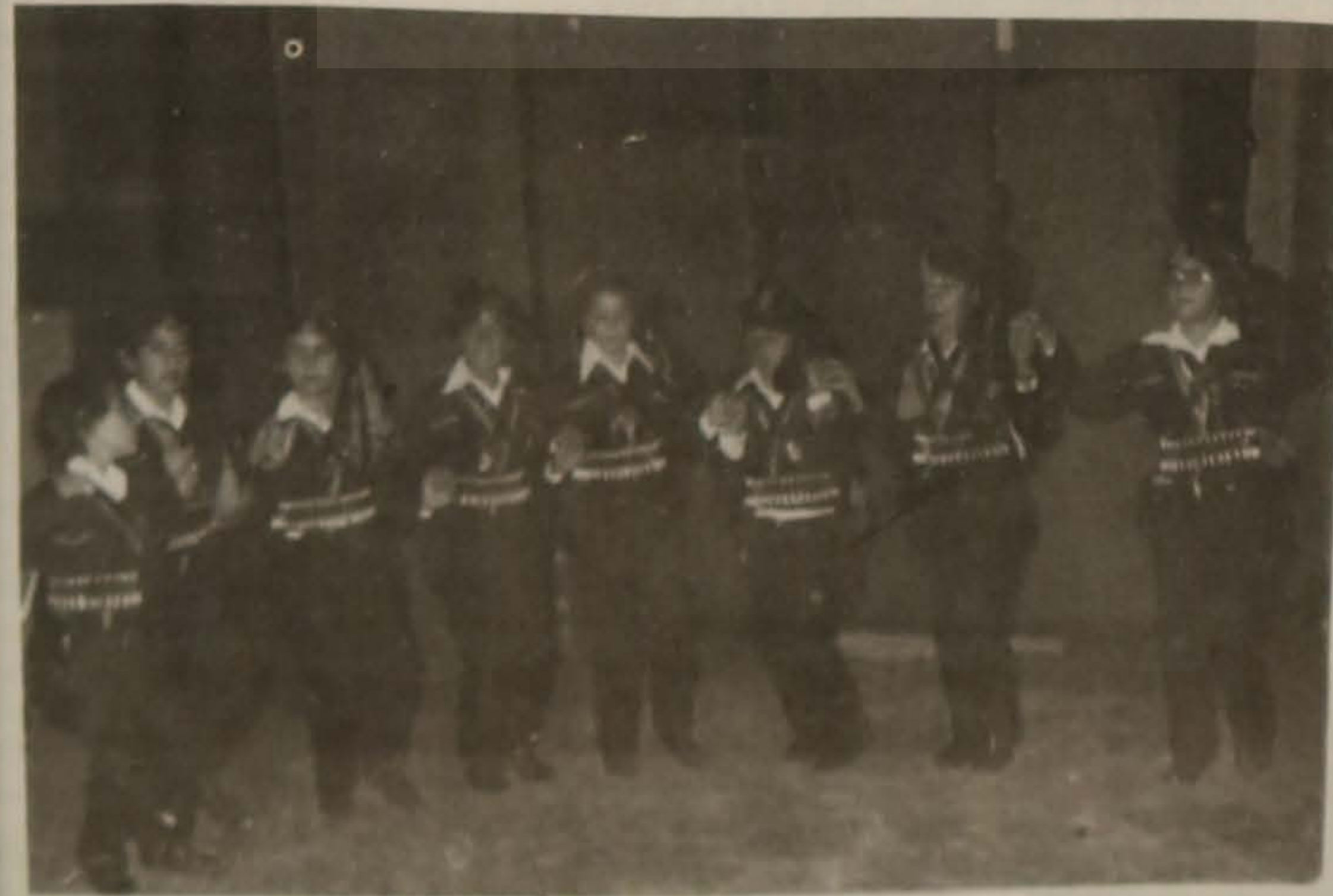
Το παιδικό χορευτικό συγκρότημα της Λέσχης της περιόδου 1976 - 80.