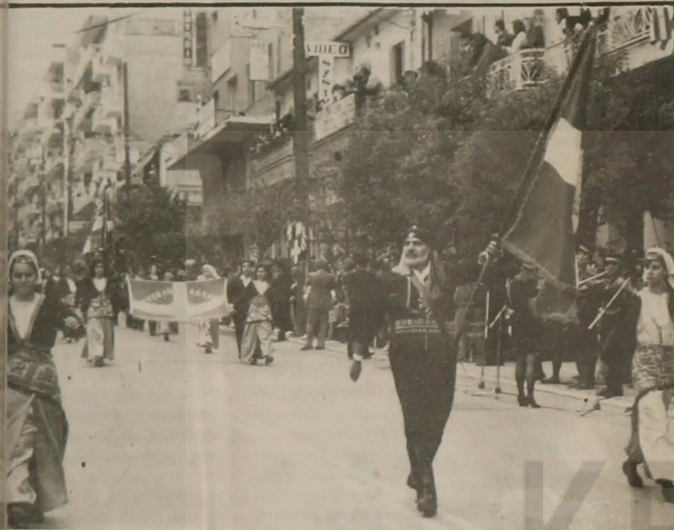
Στη φωτογραφία τμήμα της Ευξεινού Λέσχης Βέροιας κατά την παρέλαση της 28ης Οκτωβρίου. Ο κόσμος χειροκρότησε θερμά το τμήμα για την άψογη εμφάνισή του.