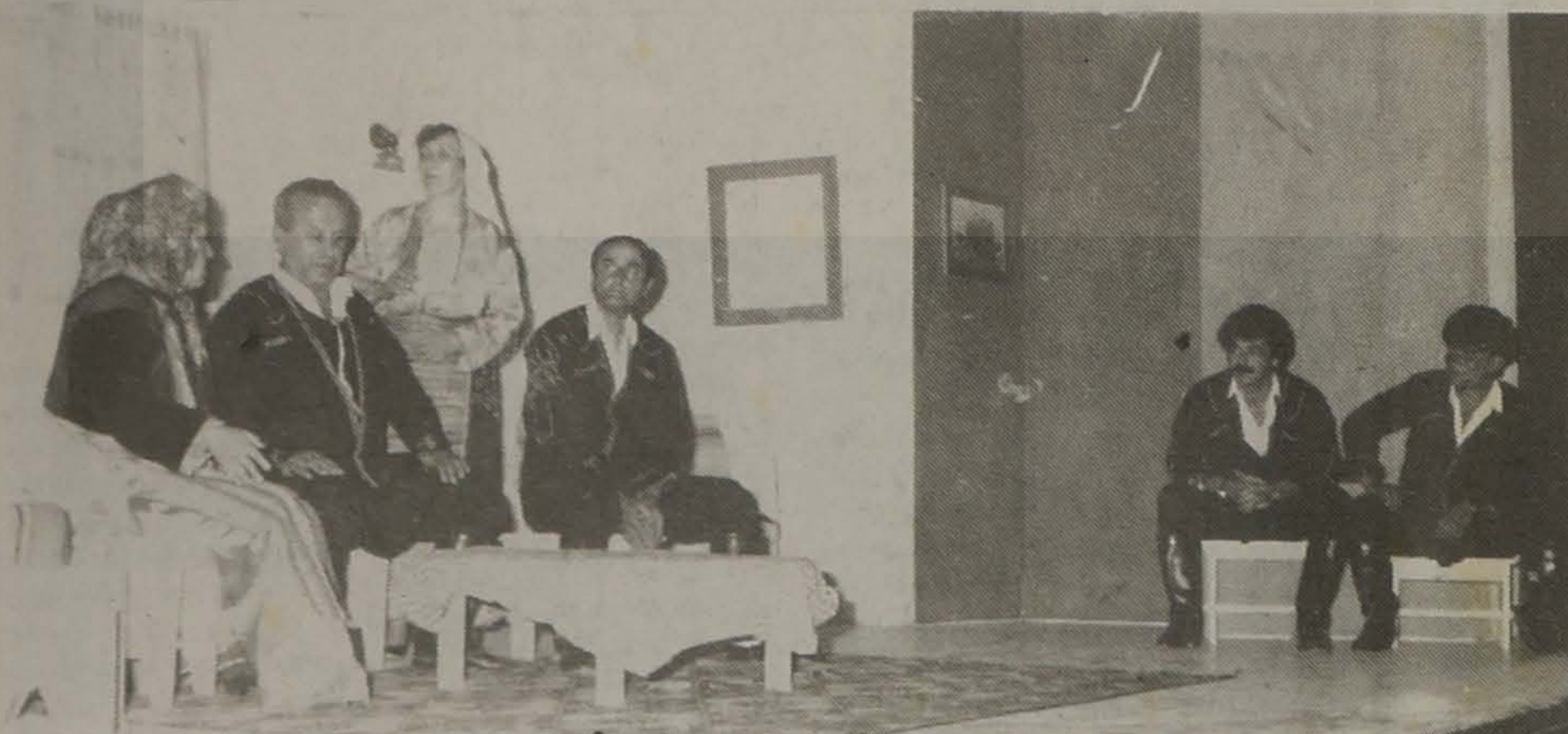
Σημείο από την παράσταση.

Δύο παραστάσεις έδωσε στις 21-12-1990 το θεατρικό τμήμα της Ε.Λ.Β. στην Κοιλάδα Κοζάνης με το έργο "Σειράν κι καλάνω" της Αννας Μαυροπούλου - Βαφειάδου, σε σκηνοθεσία του κ. Οδυσσέα Γωνιάδη.