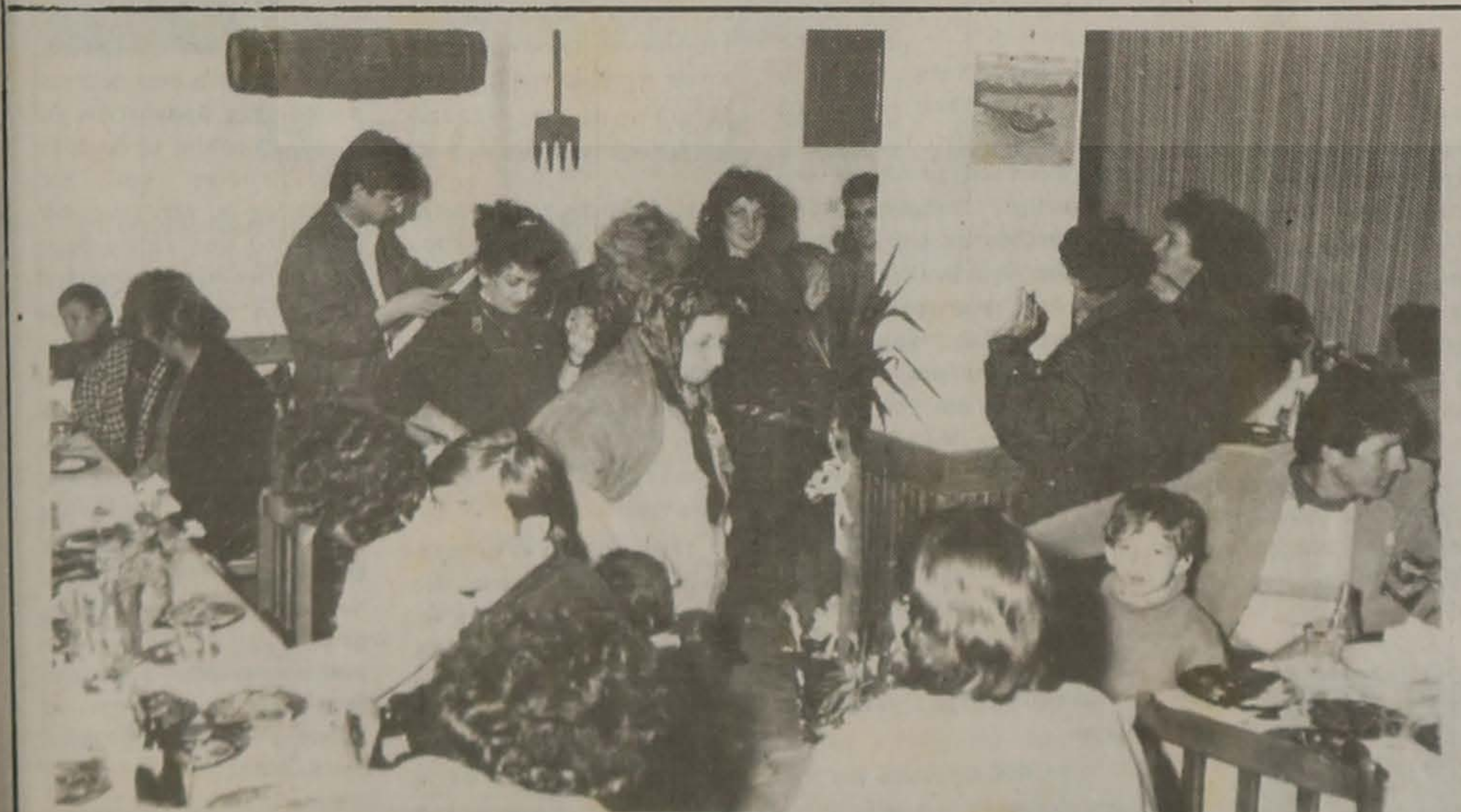
Στη ταβέρνα της Λέσχης σε κάποιες ξενιαστές ώρες

Η εκδήλωση συνεχίστηκε Σάββατο στις 4η σελ.