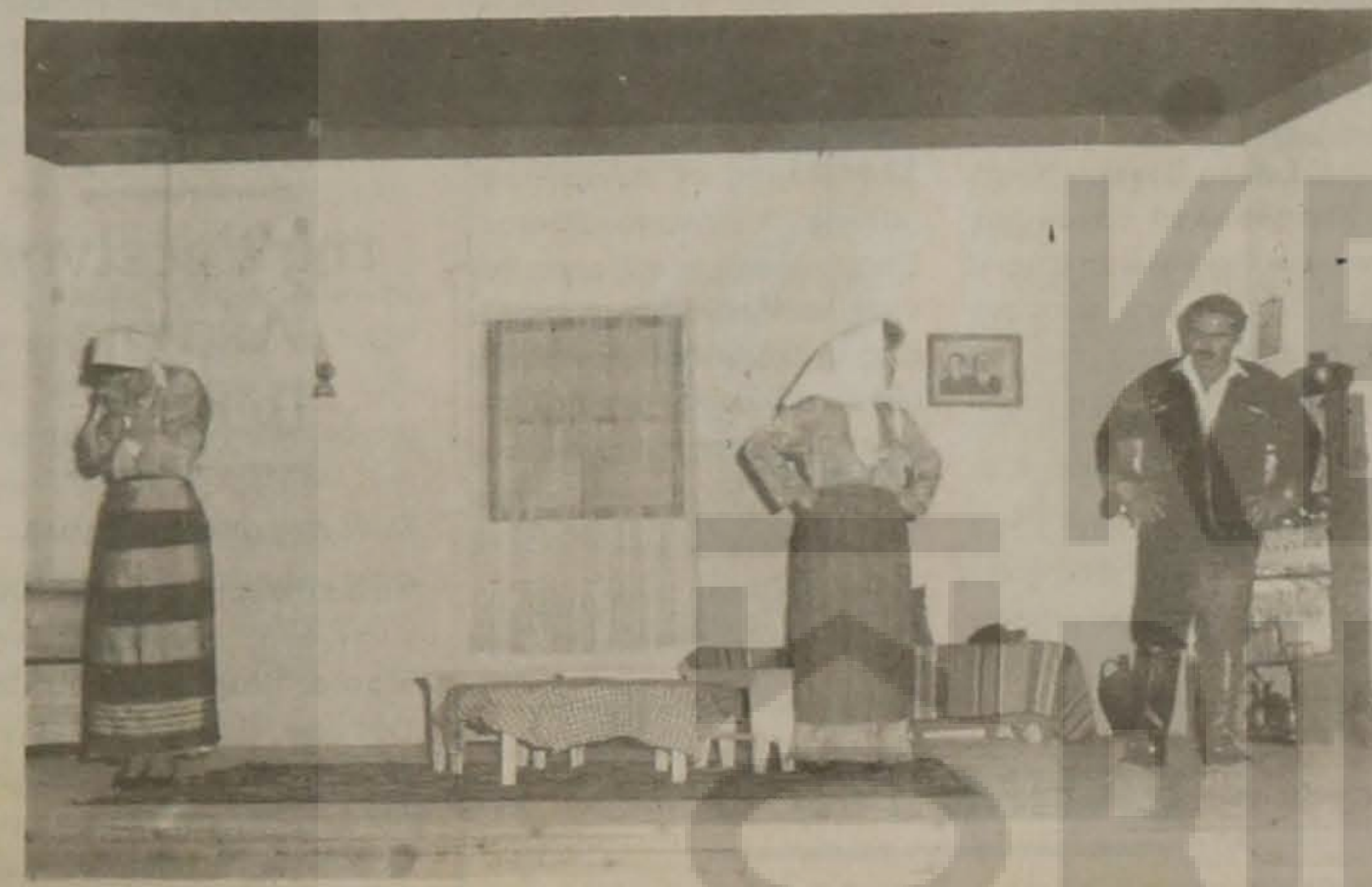
Σκηνές από το έργο "Σειράν κι χαλάνω".