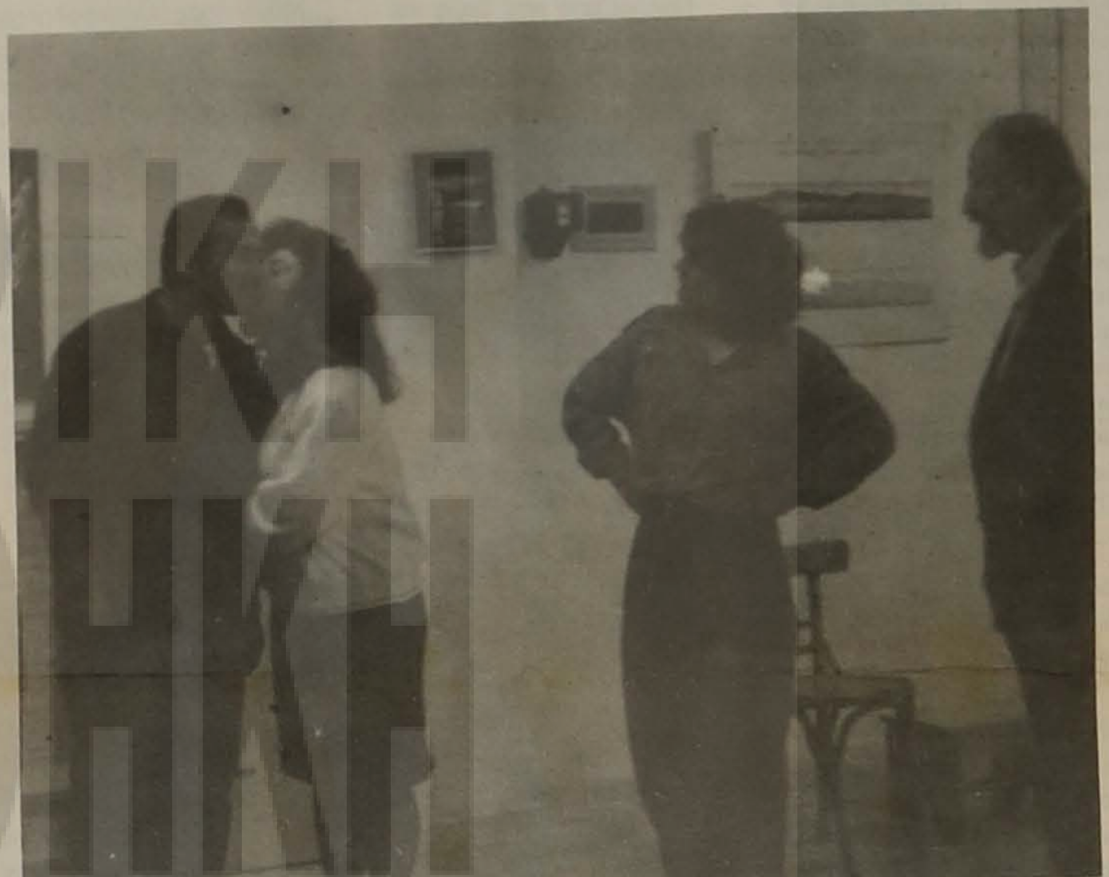
Σημιότυπο από την δοκιμή του έργου "Σειράν κι καλάνω".

Συνεχίζονται με γρήγορο ρυθμό οι δοκιμές του έργου "ΣΕΙΡΑΝ ΚΙ ΧΑΛΑΝΩ" της Άννας Μαυροπούλου - Βαφειάδου από την θεατρική ομάδα της Ευξεινού Λέσχης Βέροιας. Στην ομάδα συμμετέχουν οι: