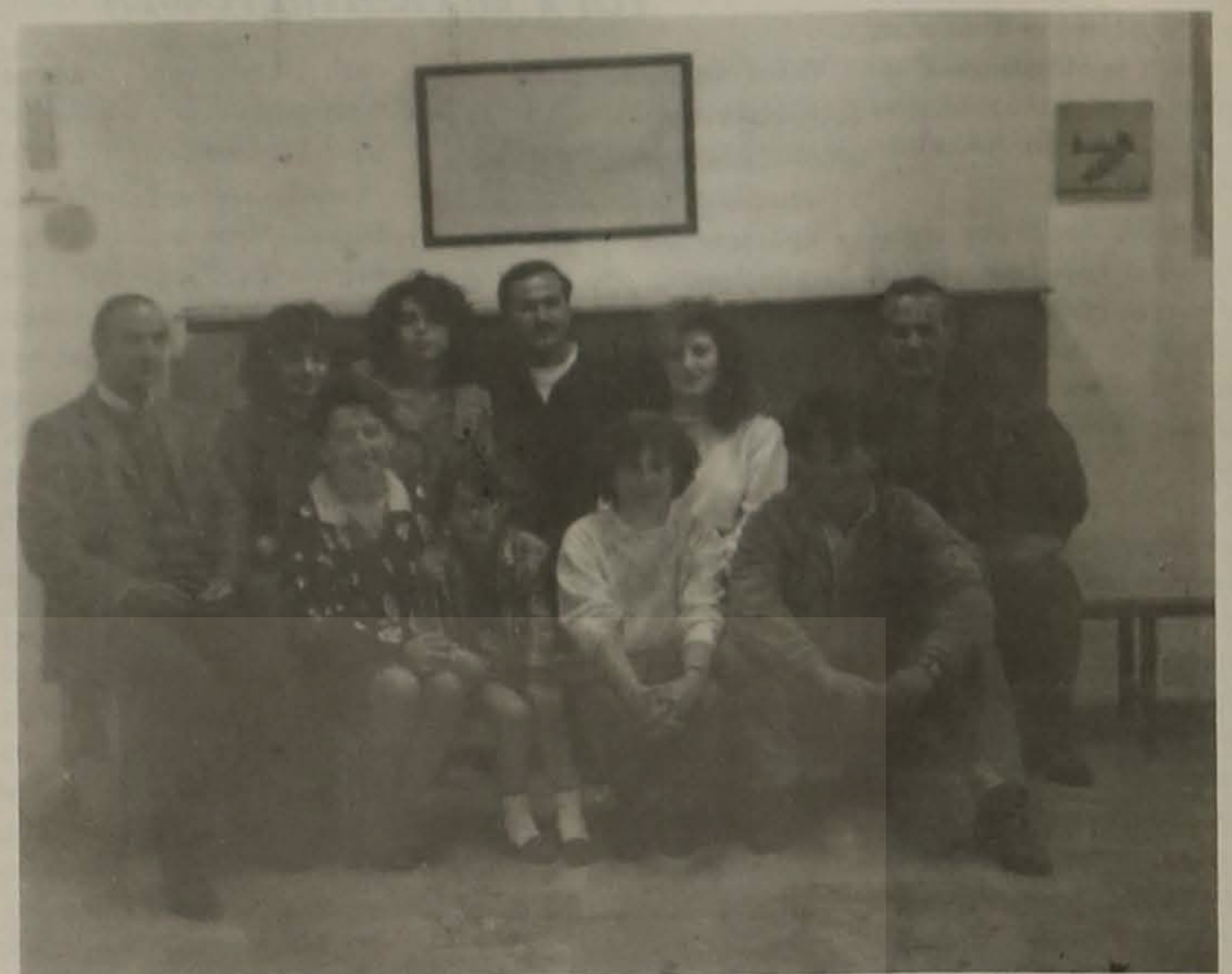
Η θεατρική Ομάδα.