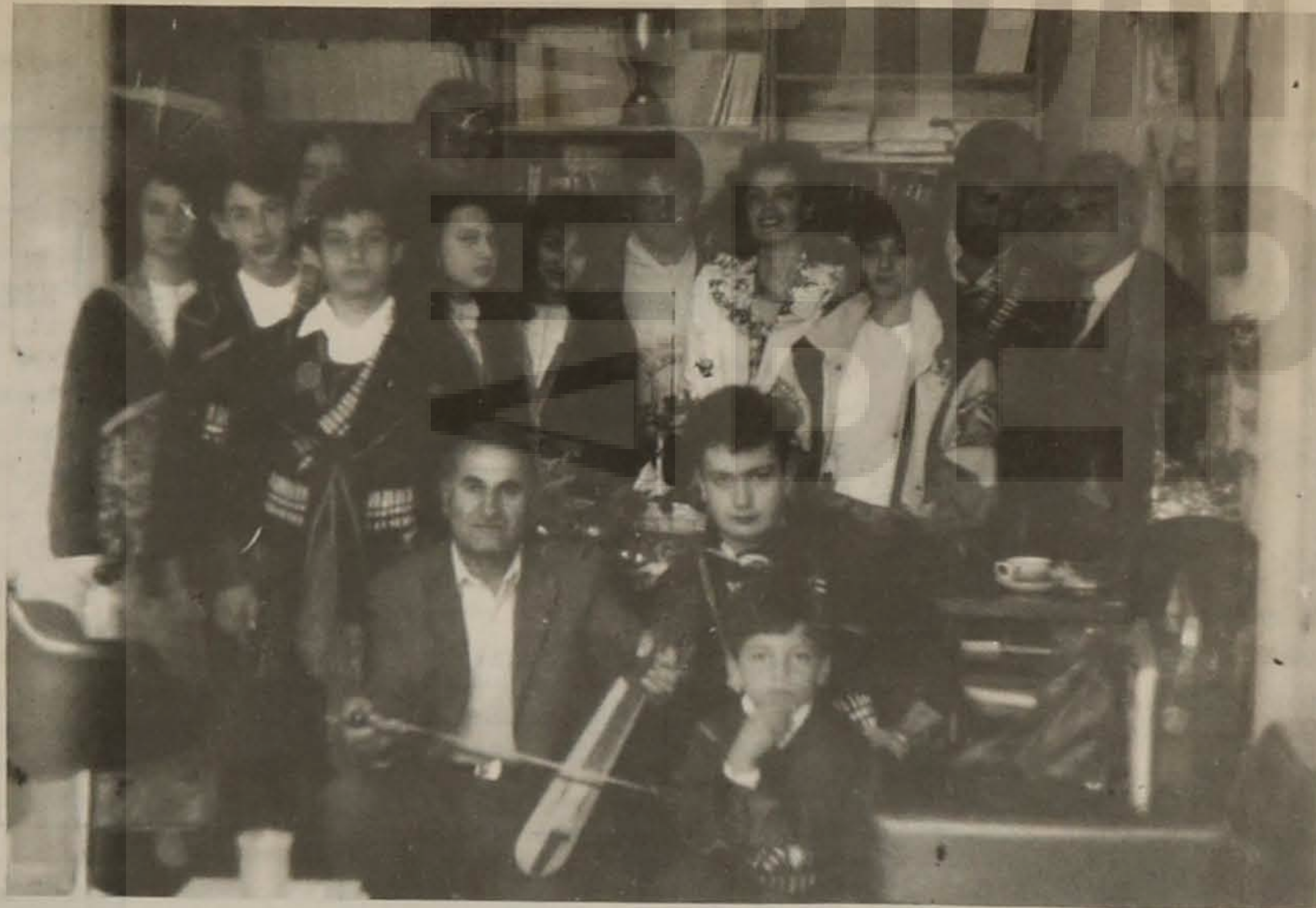
Στη φωτογραφία μέλη του Δ.Σ. της Ευξεινού Λέσχης Βέροιας και τμήμα του χορευτικού συγκροτήματος που πήγαν μέρος στην επίσκεψη της αγάπης.

στα ποντιόπουλα, που για χάρη τους χόρευαν παραδοσιακούς χορούς, παλιές αξέχαστες στιγμές. Κι αυτήν την θύμησή τους τη μαρτύρησε κάποιο δάκρυ που άθελά τους κύλησε από τα πονεμένα μάτια τους.