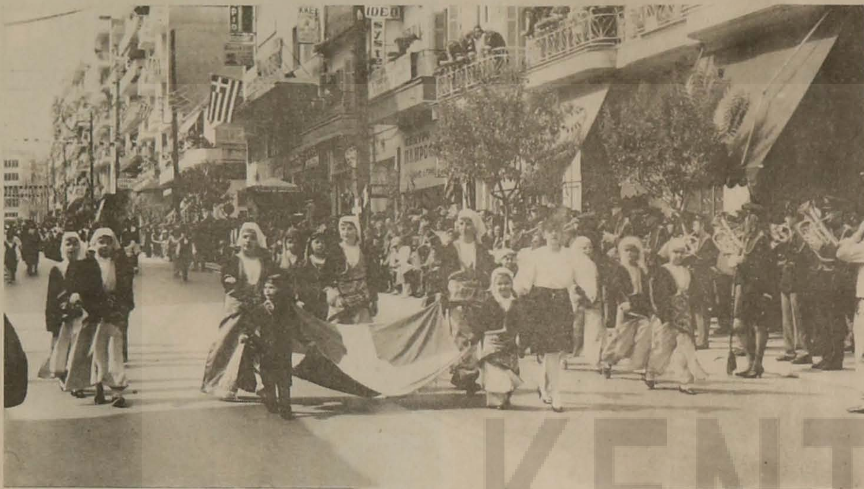
Με μεγαλοπρέπεια γιορτάστηκε στη Βέροια η επέτειος της 25ης Μαρτίου. Το πρόγραμμα περιλάμβανε δοξολογία, ομιλία, καταθέσεις στεφάνων και παρελάσεις. Στην παρέλαση έλαβε μέρος με επιτυχία η Ευξείνου Λέσχη Βέροιας με το καλλιτεχνικό της τμήμα. Ντυμένα τα Ποντιόπουλα με τις παραδοσιακές στολές, υπερήφανα για τη φυλή και τις ρίζες τους, μπροστά με την ελληνική σημαία που έχει έμβλημα το Μονοκέφαλο Αετό.

Ετος 2ο Αρ. φύλλου 15 ΜΗΝΙΑΙΟ ΔΗΜΟΣΙΟΓΡΑΦΙΚΟ ΟΡΓΑΝΟ ΤΗΣ ΕΥΞΕΙΝΟΥ ΛΕΣΧΗΣ ΒΕΡΟΙΑΣ ΜΑΡΤΣ 1990