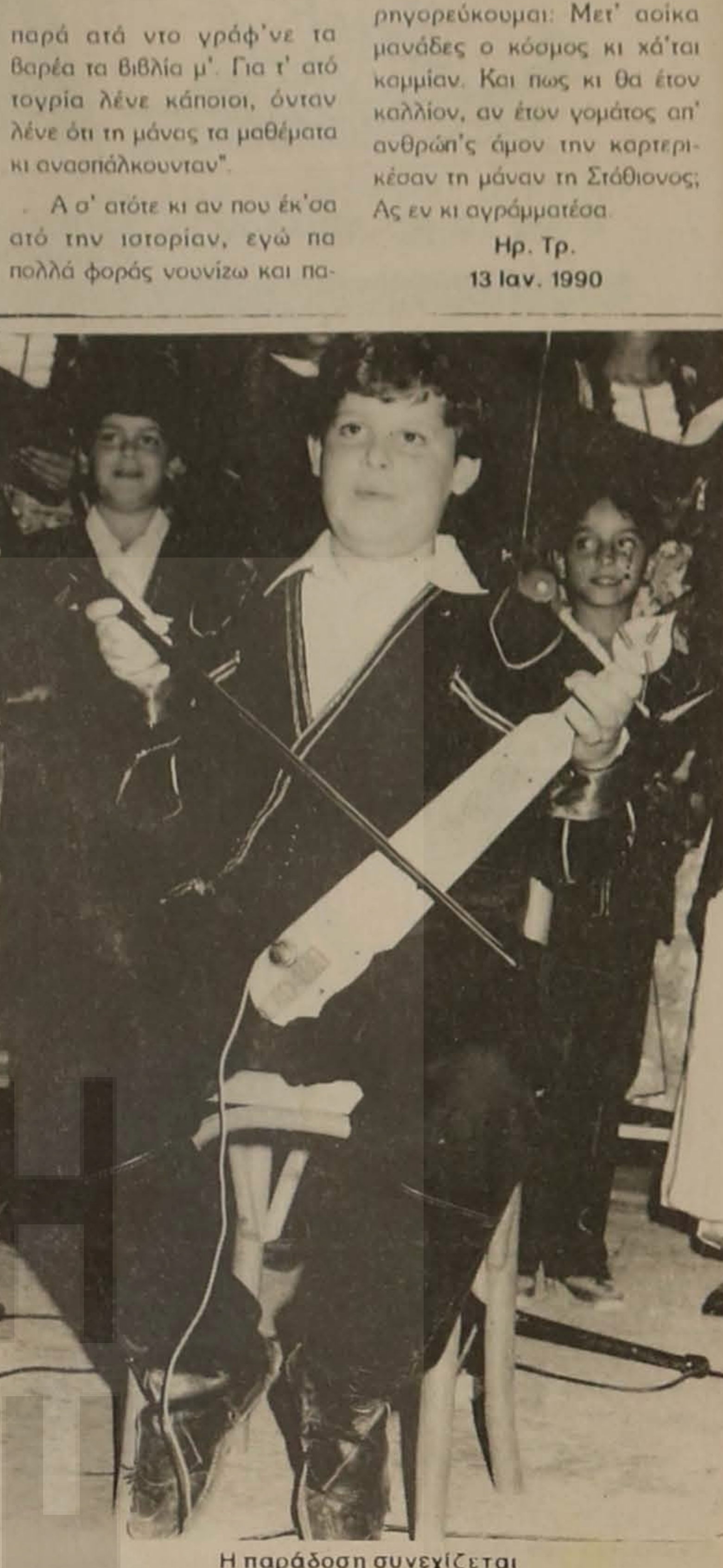
Η παράδοση συνεχίζεται