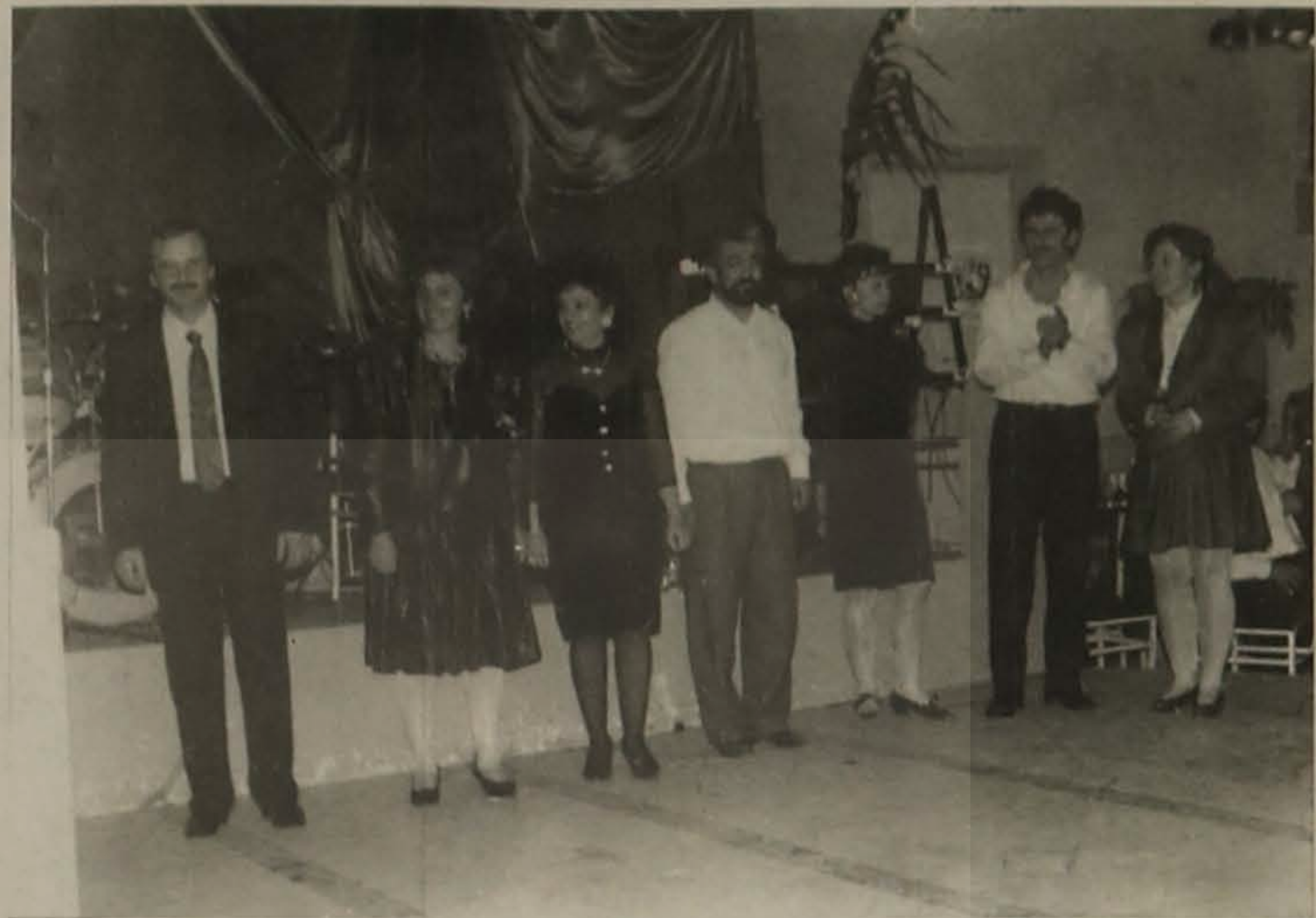
συνέχεια από την 1η σελ. είκαν οι: