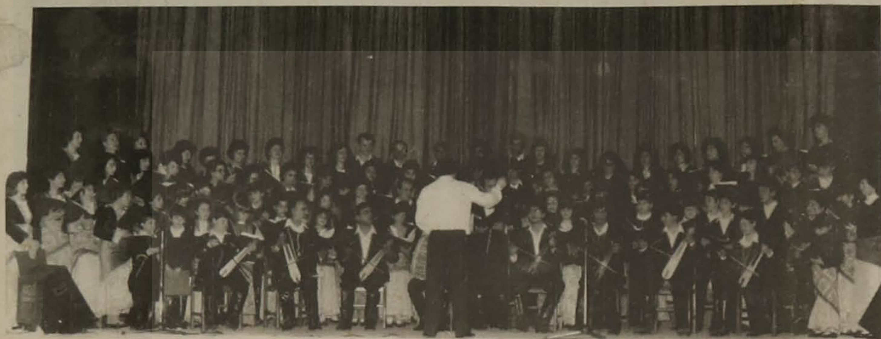
Η χορωδία της Ε.Λ.Β. που ηχογράφησε σε δίσκο τα παραδοσιακά τραγούδια.