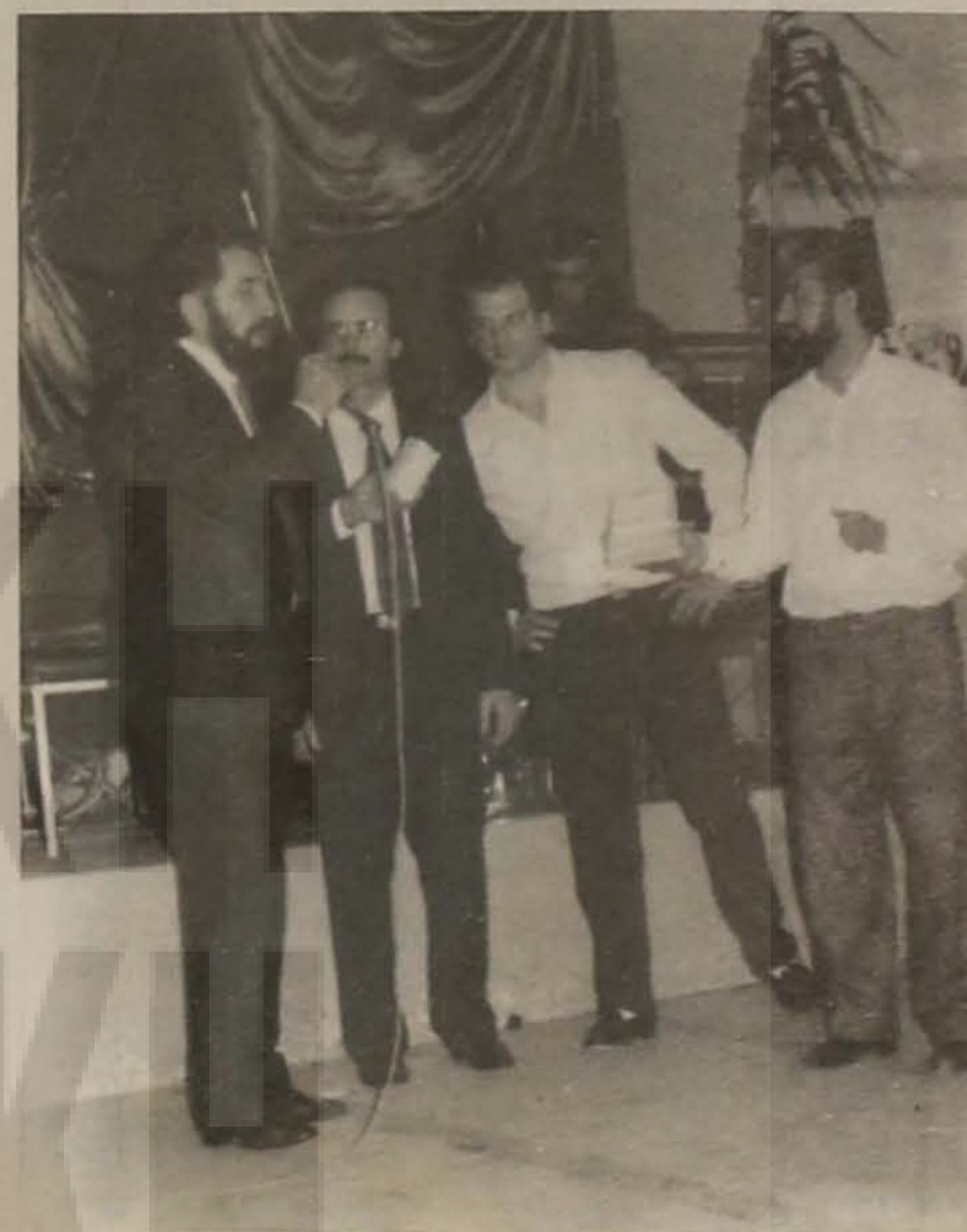
Στη φωτογραφία ο ηθοποιός Λάζος Τερζάς ενώ παρουσιάζει το πρόγραμμα της εκδήλωσης.

Για την ιστορία αναφέρουμε ότι την ομάδα στήριξης την αποτελούσαν οι Μπάμπης Καπουρτίδης, Βάσω