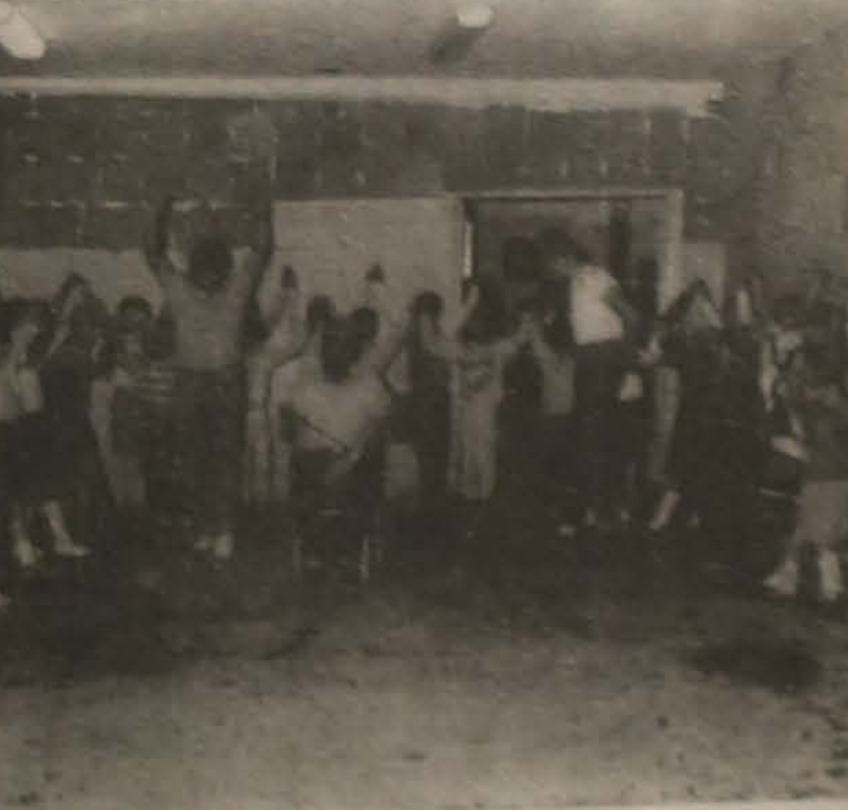
Το ημίμα αρχαρίων στην ώρα του μαθήματος.