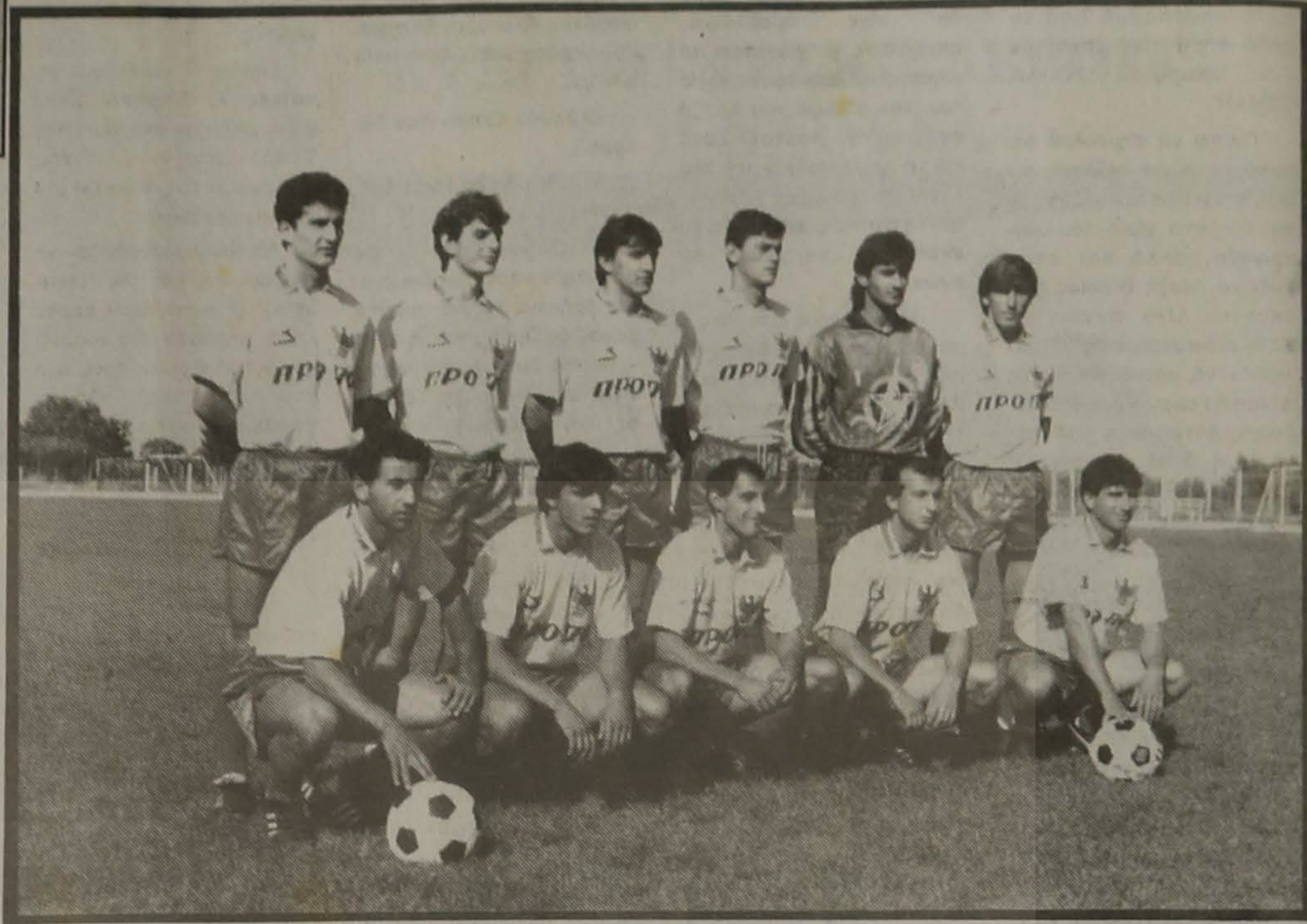
Η ομάδα θαύμα! Η δική μας ομάδα, η Α.Ε.Π. Βέροιας, που βαδίζει από επιτυχία σε επιτυχία.