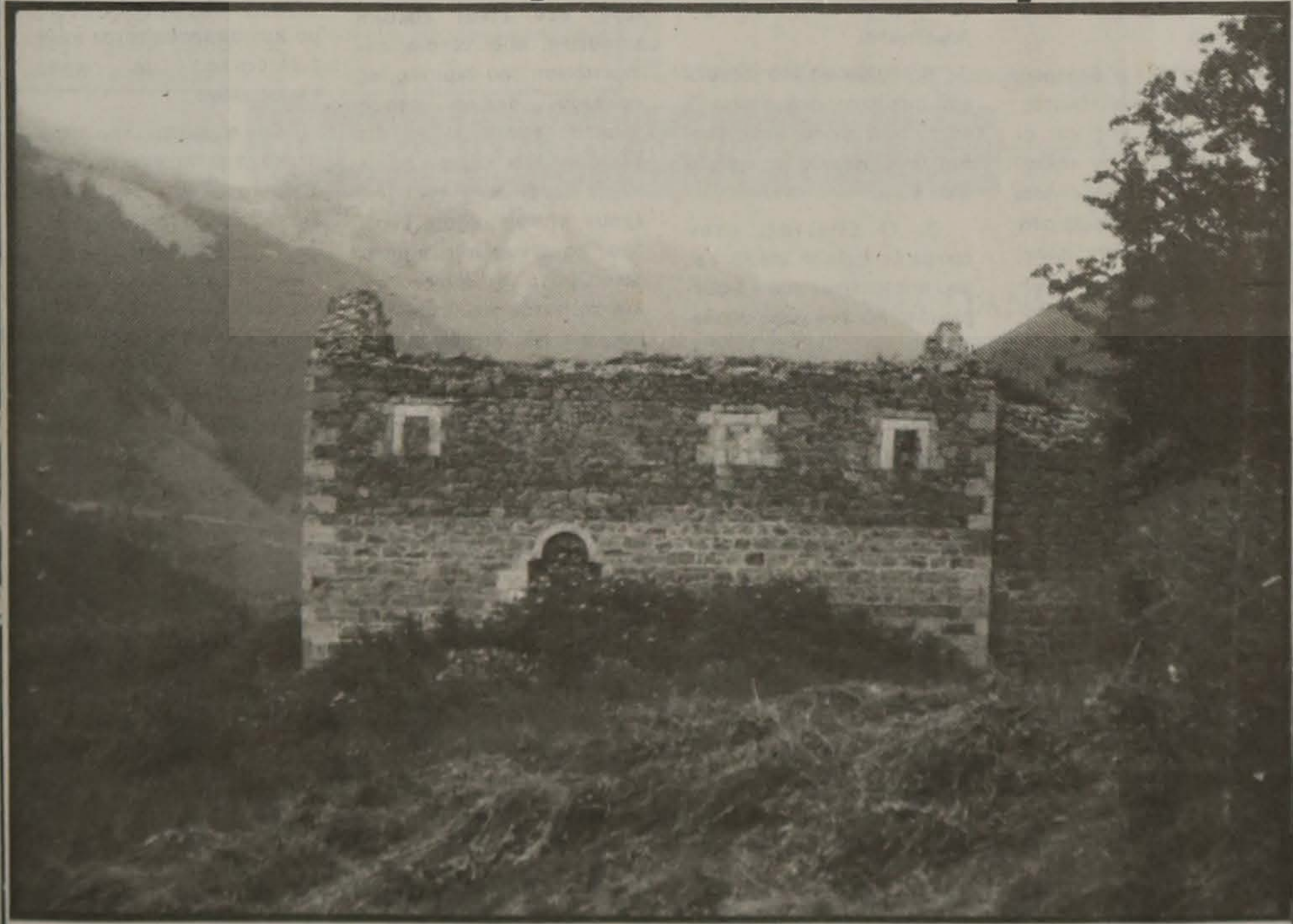
Αέρης της ενορίας Ζουρνασιάντων της Σάντας