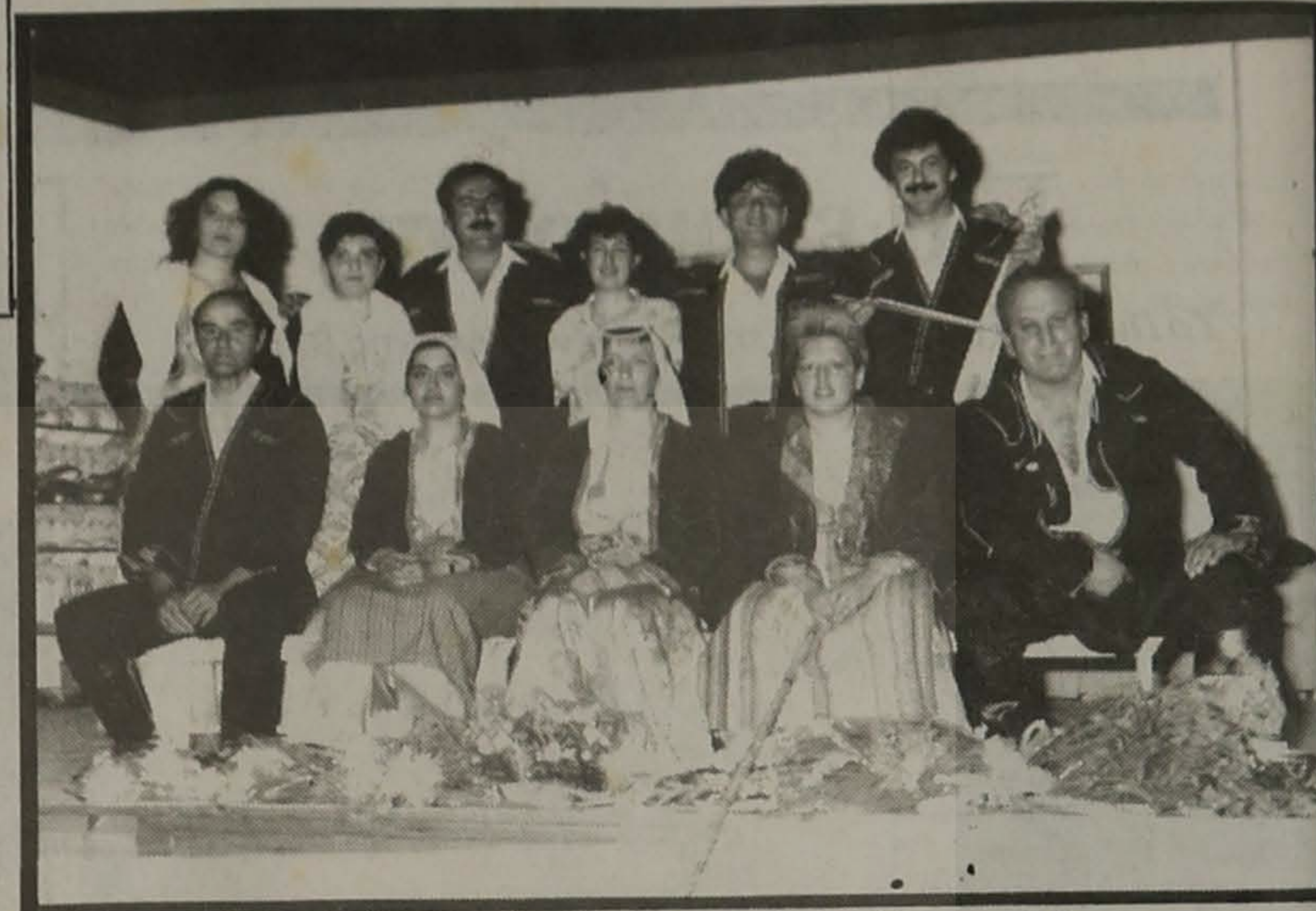
Το θεατρικό τμήμα της Ευξεινού Λέσχης Βέροιας

Την Κυριακή 18 Νοεμβρίου 1990 στις 8 το βράδυ το θεατρικό τμήμα της Ευξεινού Λέσχης Βέροιας σε συνεργα- σία με το Δ.Σ. της Ευξεινού Λέσχης Νάουσας παρουσί- ασε σε σκηνοθεσία του κ. Ο- δυσσέα Γωνιάδη το θεατρικό έργο της Άννας Μαυροπούλου - Βαφειάδου