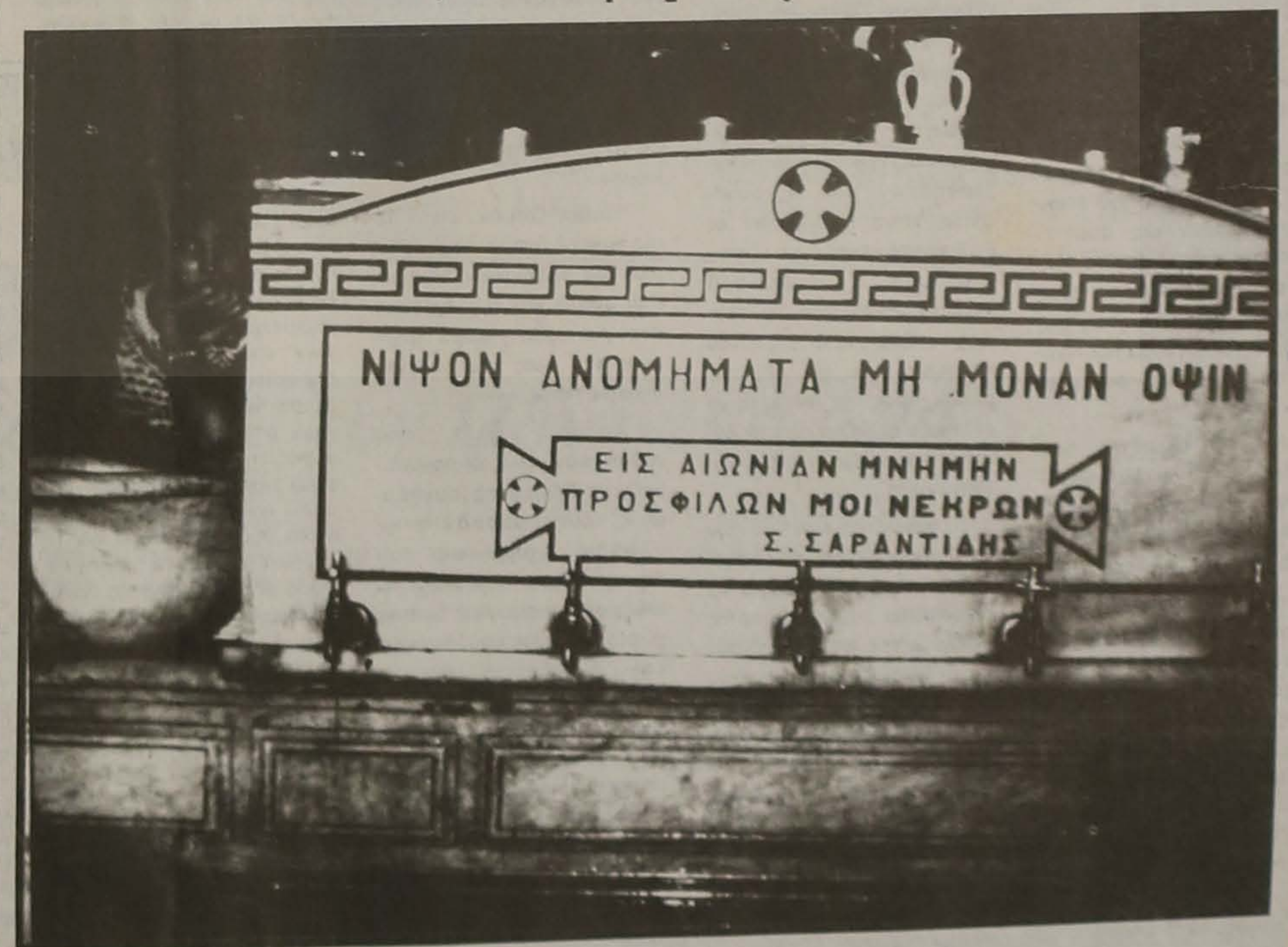
Για να θυμούνται ότι εδώ κάποτε στον Πόντο, ζούσε ένας δημιουργικός και υπερήφανος λαός, που τόσο βάρβαρα ξεριζώθηκε.