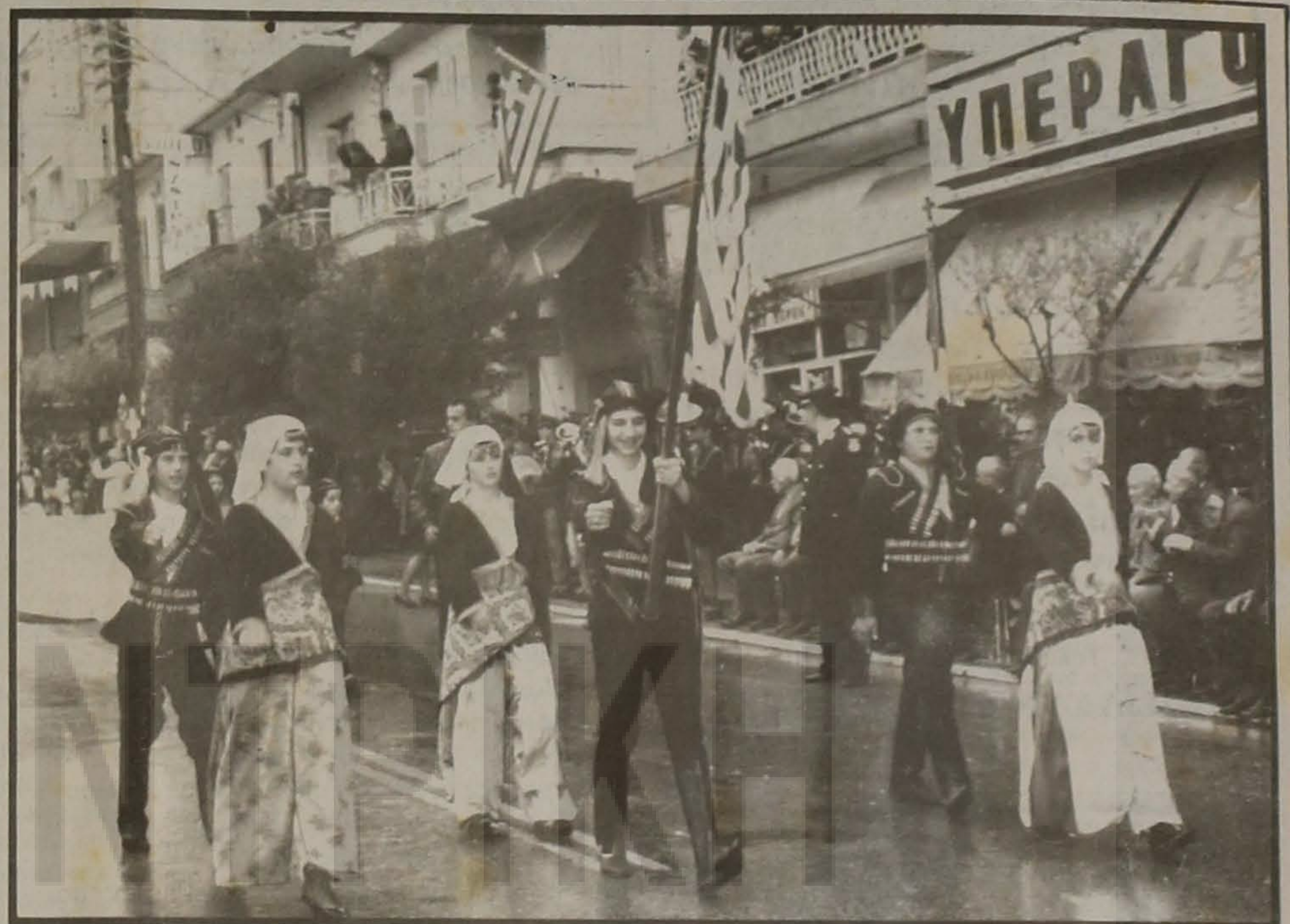
Η νέα γενιά των Ποντίων κατά την παρέλαση της 28ης Οκτωβρίου στη Βέροια.

Από το Πρωτόκολλο της Πετρούπολης του 1826, μεταξύ της Αγγλίας και Ρωσίας περί των ελληνικών Συνέχεια στην 4η σελ.