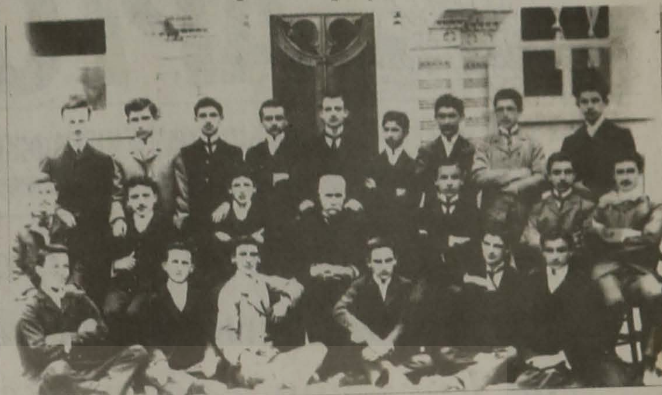
Απόφοιτοι του Φροντιστηρίου Τραπεζούντας το 1902-1903