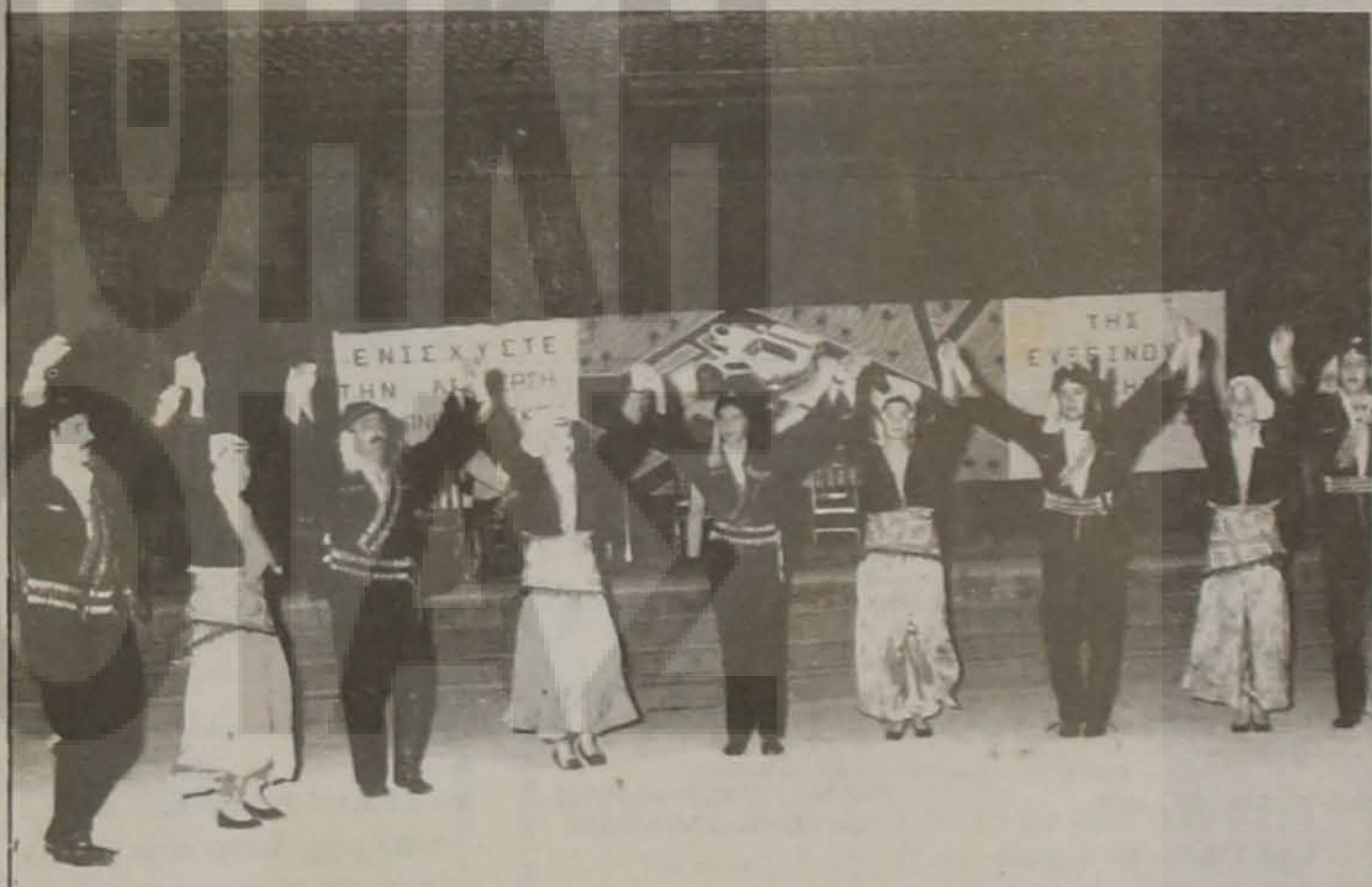
Οι χοροί μας αγαπήθηκαν. Σήμερα χορεύονται και από μη Πόντιους συμπατριώτες μας, καθώς επίσης και από ξένους, όπως Γερμανούς, Φιλανδούς κ.λ.π.