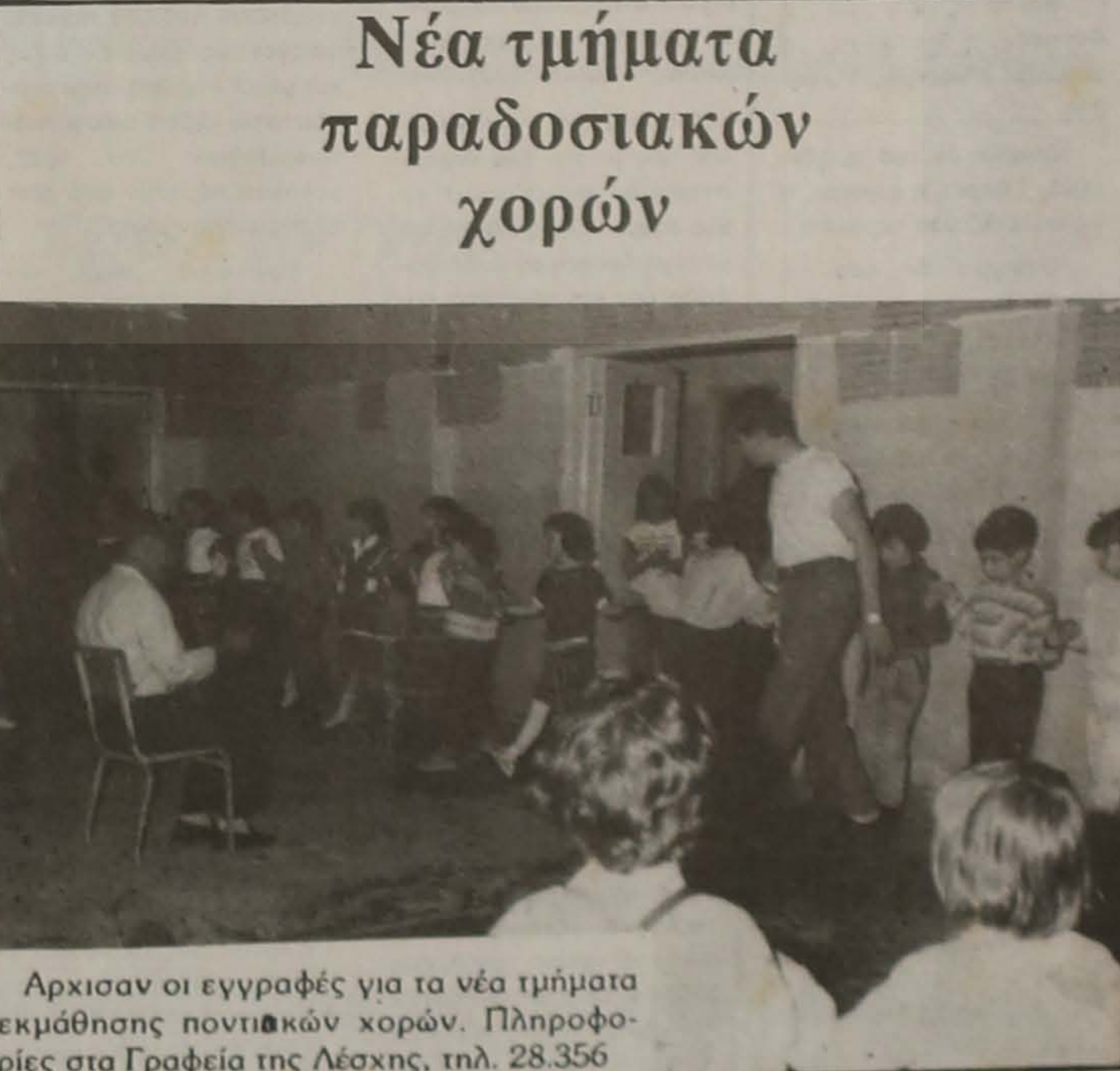
Αρχισαν οι εγγραφές για τα νέα τμήματα εκμάθησης ποντιακών χορών. Πληροφορίες στα Γραφεία της Λέσχης, τηλ. 28.356

Σημειώνεται ότι, ο ρουχισμός προέρχεται από τον Ο.Α.Ε.Δ. μετά από ενέργειες του Δήμου Βέροιας για την κάλυψη της σχετικής ανάγκης.