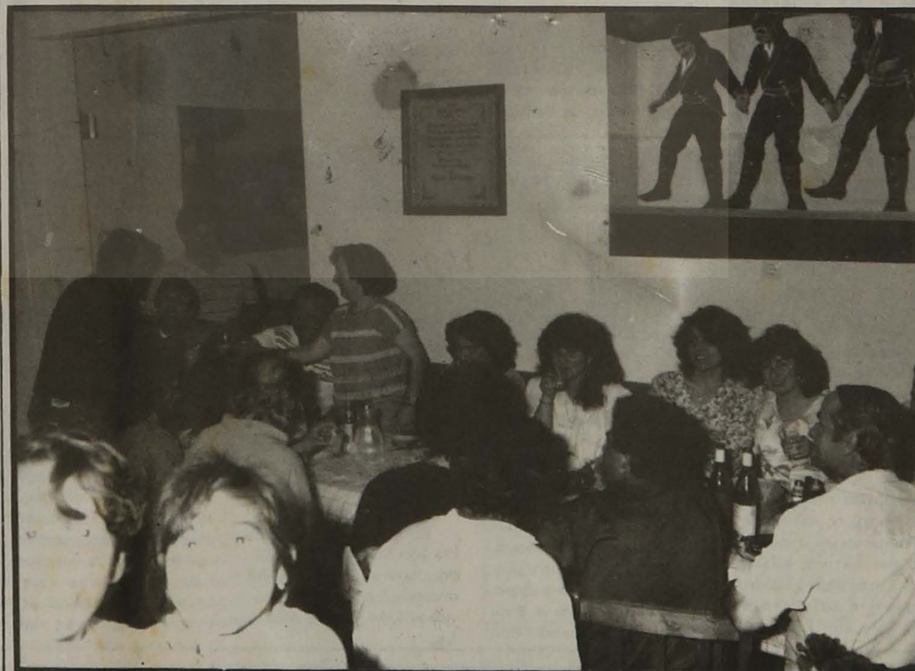
Η θεατρική ομάδα τς Ευξείνου λέσχης Βέροιας με μέλη του Δ.Σ. στην Ταβέρνα τς

Λέσχης, ύτερα από το ανέβασμα του έργου "Σειράν κι χαλάνω".