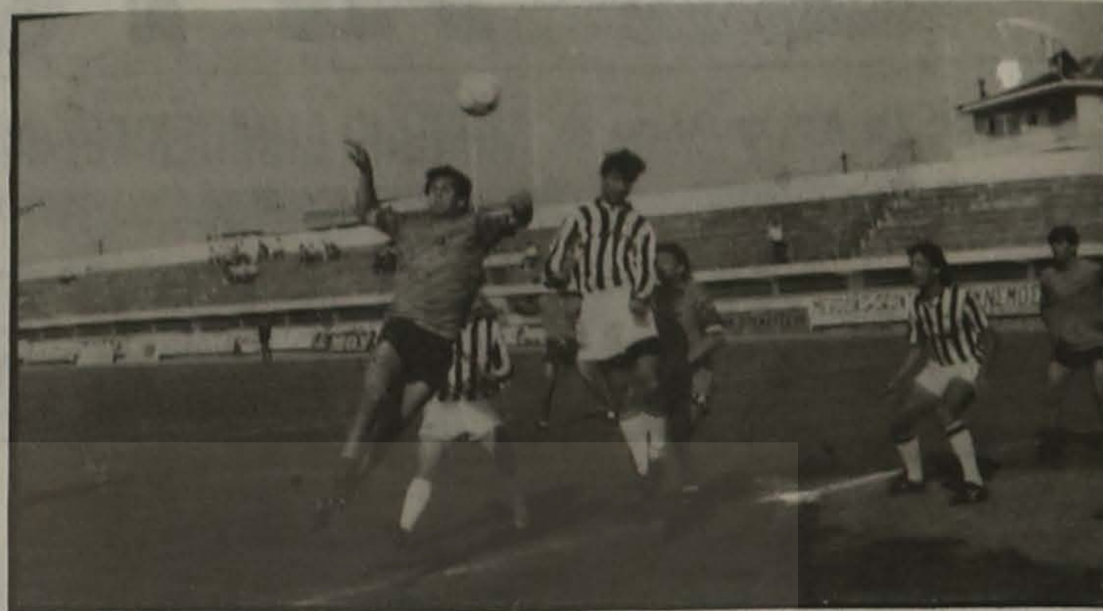
Φάση από αγώνα της Α.Ε. Ποντίων Βέροιας

Δύο περίπου βδομάδες πριν την έναρξη του πρωταθλήματος της Γ' Εθνικής κατηγορίας της περιόδου 1990-91 και η Α.Ε. Ποντίων Βέροιας βρίσκεται στο τελευταίο στάδιο της προετοιμασίας της. Μιας προετοιμασίας που ξεκίνησε στις 11 Ιουλίου και αφού πέρασε από τρεις φάσεις (προσαρμογής, φυσικής κατάστασης, αφομοίωση τακτικής) βρίσκεται αυτήν την στιγμή όπως προαναφέραμε στην τελευταία και πιο κρίσιμη. Στο δέσιμο δηλαδή των ποδοσφαιριστών.