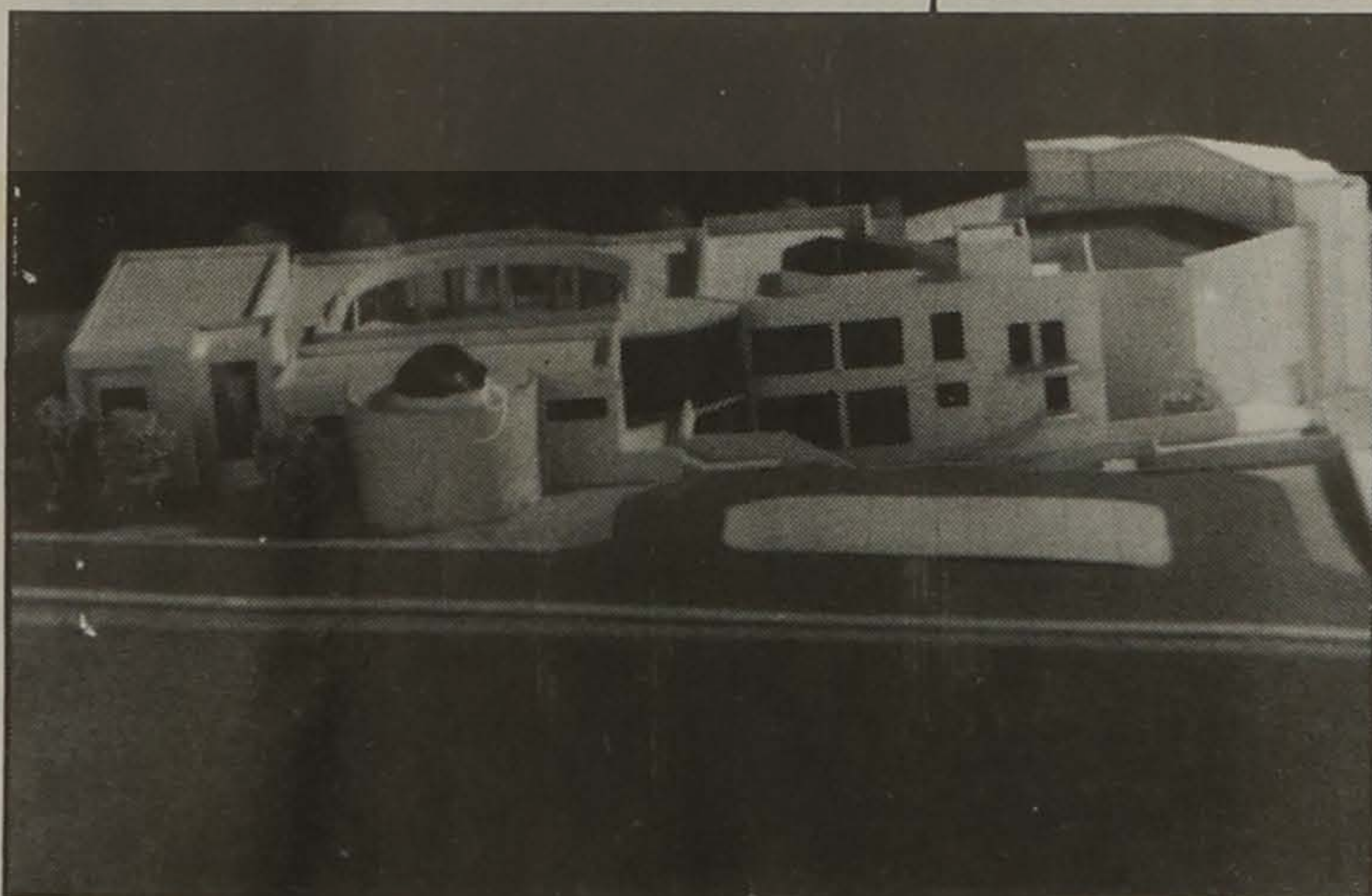
Το Πνευματικό Κέντρο της Ευξείνου Λέσχης Βέροιας. Ένας σκοπός ιερός που θα συνδέει το χθές με το σήμερα και θα προσφέρει ελπίδα για το αύριο.

Οι ενδιαφερόμενοι παρακαλούνται να στέλνουν ένα αντίτυπο του βιβλίου ή του περιοδικού τους για τον παραπάνω σκοπό.