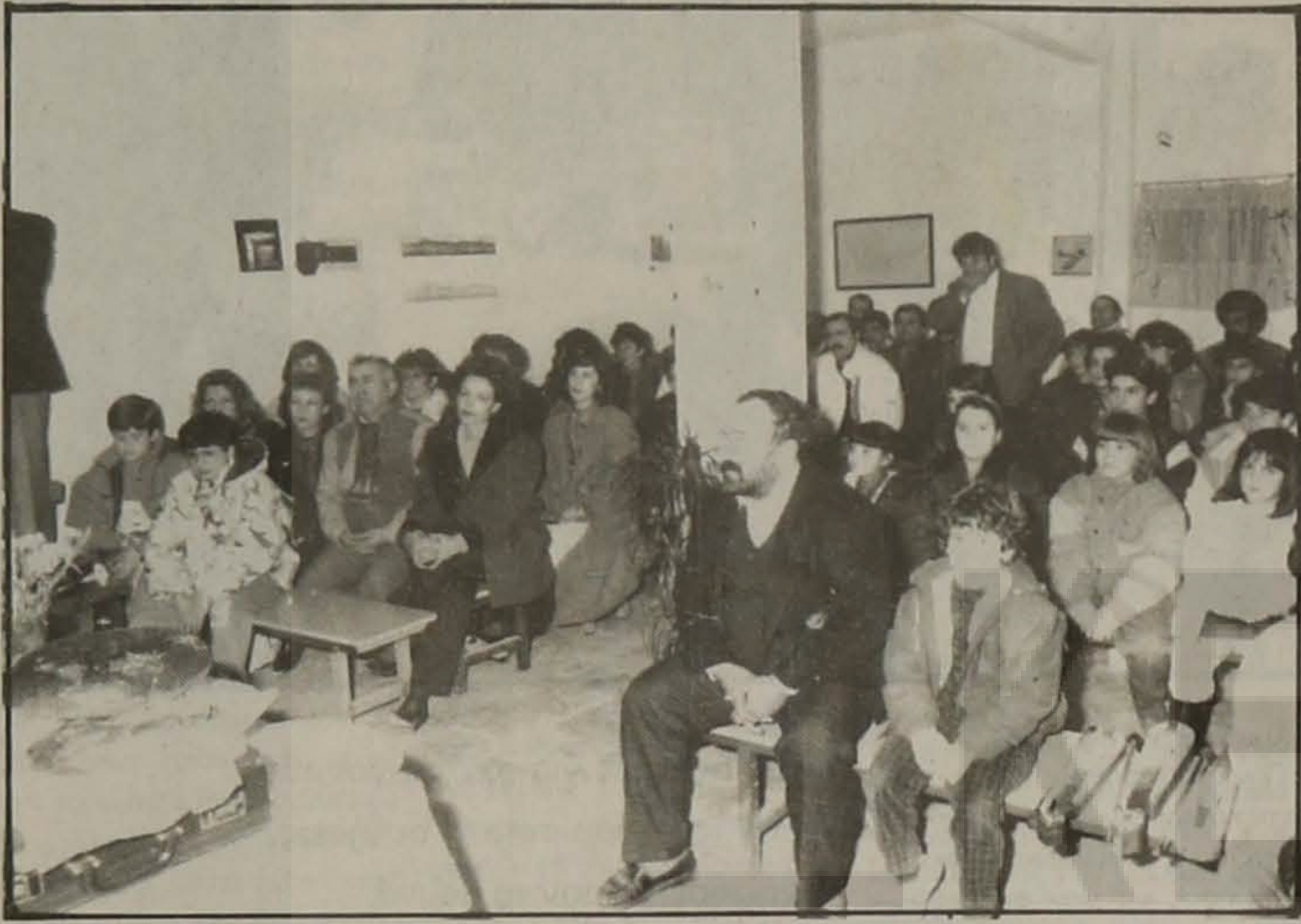
- Τα μέλη και οι φίλοι της χορωδίας στην κοπή της βασιλόπιττας.