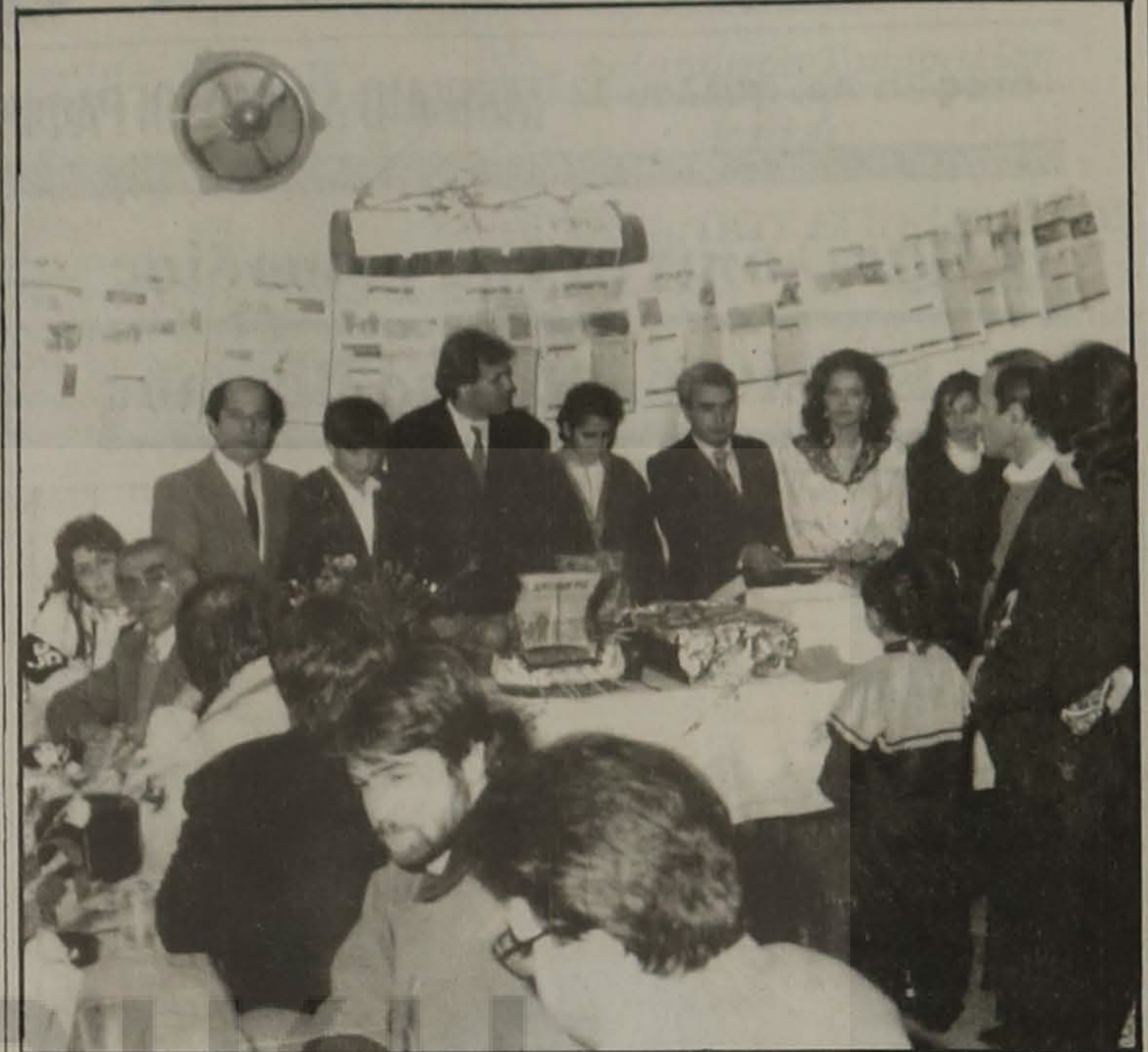
Συνέχεια από την 1η σελ.

οι Πόντιοι διαβάζουν κάθει το ποπτακό και έχουν την απαίτηση από τους πνευματικούς τους ανθρώπους να μην αγνοούν ούτε τη νοσταλγία των πρεσβυτέρων, ούτε την επιθυμία και την έφεση των νεοτέρων προς μάθηση και συνέχιση των παραδόσεών μας".